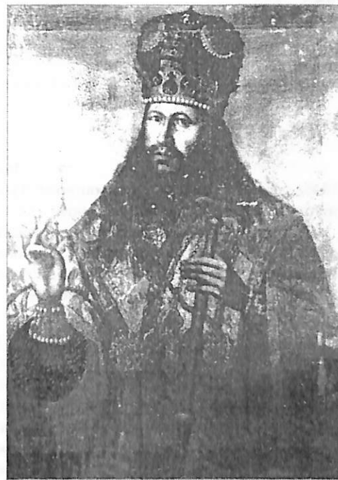
Илл. 8 (до реставрации). Кат. 22.

Никон (1603-1681) – происходит из крестьянской семьи. Инок Соловецкого Анзерского скита. Игумен Кожезерского скита. 1646 – архимандрит Московского Новоспасского монастыря. 1649 – рукоположен в митрополита Новгородского и Великолуцкого. 1652 – поставлен в патриарха. 1658 – оставил патриаршую кафедру. 1666 – низложен. Умер 1681 по пути в Воскресенский Новый Иерусалим именуемый монастырь. При патриархе Никоне началось соединение митрополий Западнорусской, Киевской, Восточнорусской, Московской и Никон первый начал называться патриархом «Московским и всея Великия, и Малыя и Белья России». При нем началось исправление церковных книг и обрядов. В 1654 со-