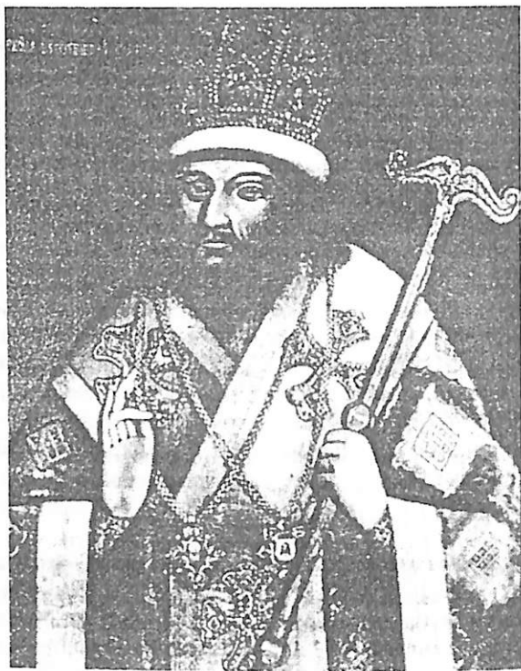
Илл. 1. Кат. 1.

Святитель Димитрий Ростовский (в миру Даниил Саввич Туптало; 1651-1709) – родился на Украине в семье малороссийского сотника. В 1662 поступил в Киево-Могилянскую Академию. В 1668 принял монашеский постриг. В 1675 рукоположен в сан иеромонаха архиепископом Лазарем (Барановичем). В 1684 – архимандрит Киево-Печерской лавры Варлаам (Ясинский), пригласил Димитрия в Киев и благословил на составление Четьих-Миней. «Труд важнейший, огромнейший, и выполненный с особенным искусством, – писал Макарий Булгаков. – Важнейший по своему предмету, который для