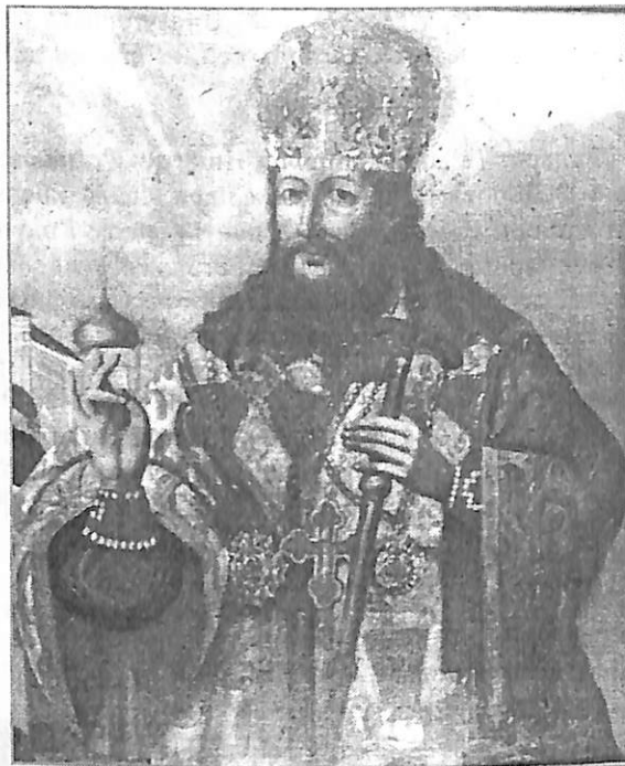
Илл. 9 (после реставрации). Кат. 22.

Иоасаф II (?-1672) – архимандрит Троице-Сергиева монастыря. Рукоположен в патриарха 10. 02. 1667.