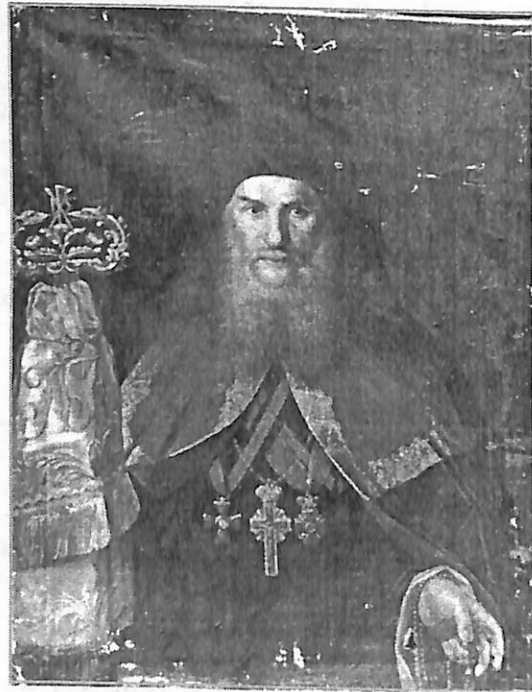
Илл. 10. Кат. 18.

поездки в Пекин и определен в Вознесенский Иркутский монастырь настоятелем. Ректор и учитель богословия Иркутской семинарии, присутствующий в Иркутской Духовной консистории. С 1813 – настоя-