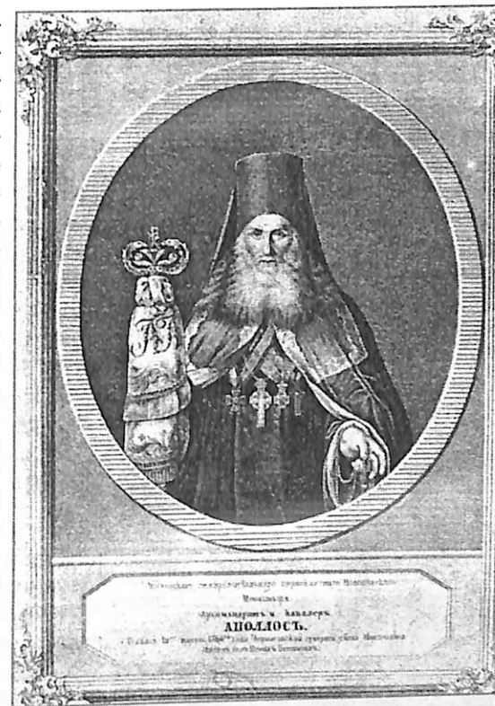
Илл. 11 (1840-е гг. Литография). Кат. 18.

Изображен в черной рясе, мантии и клобуке, на груди – крест и орден св. Владимира III степени, св. Анны II степени и наградной крест в память Отечественной войны 1812 г. В правой руке жезл, в левой четки.