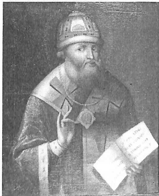
Илл. 7. Кат. 21.

Вокруг головы Филарета: Свтейший Филаретъ Ники-