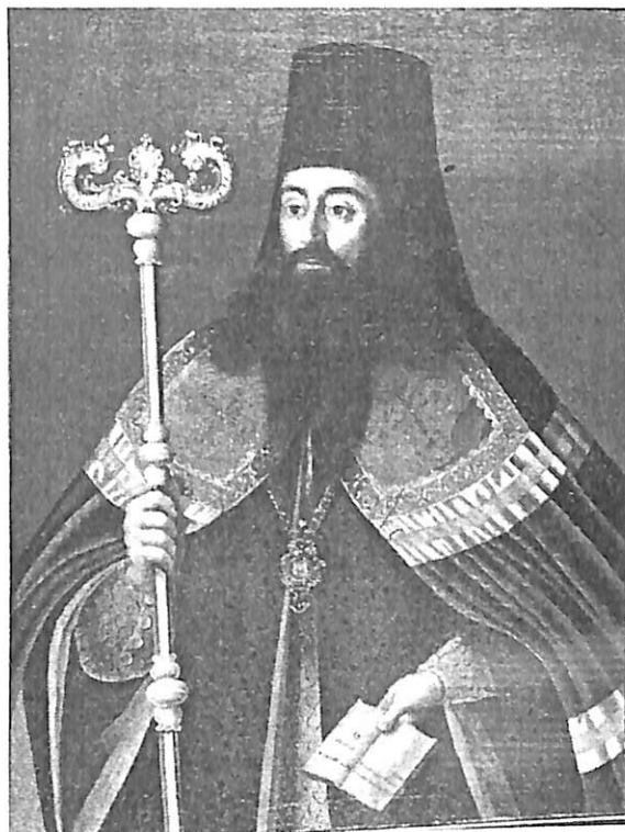
Илл. 5. Кат. 9.

На лицевой стороне сверху справа: «Преосщенны Амфілої, Бывъ/ Архіандритомъ въ Яковлевском/ Манастире, съ 1776 м года, по 1786/ Год, Переведень В киевъ в межигорскій манастирь. А по упражнений/ в Николаевской, Произведень во/ епископа Переяского, 1795/ года, преставися, 1799 года,/ Юля./ Дня». В правой руке раскрытая книга с надписью: ГДъ просвещеніе/ мое и спаситель мой/ кого убоюся/ паломъ/ кс.