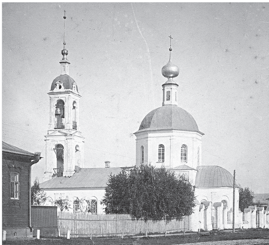
Ил. 6. Николо-Вспольский храм. Фото. Начало XX в.