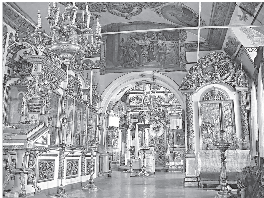
Ил. 7. Интерьер Никольской церкви. Фото. 2020 г.