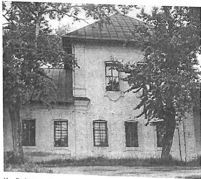
Ил. 7. Фрагменты южного фасада церкви Никольской на Подозерье. Фото 1978 г.