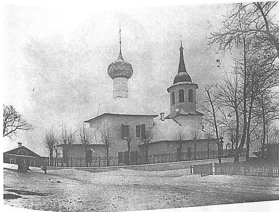
Ил. 3. Вид с северо-востока на церковь Никольскую на Подозерье (1745-1751). Фото 1920-х годов.