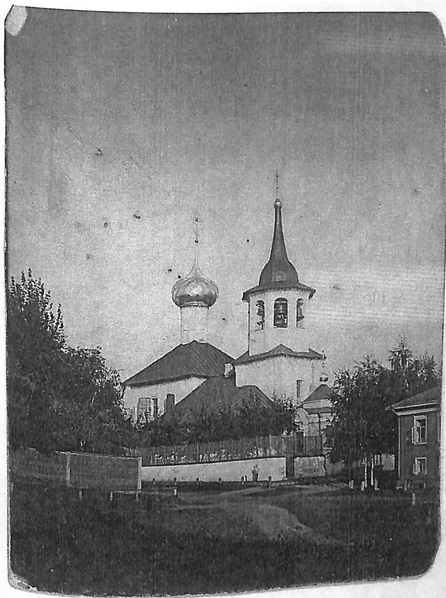
Ил. 1. Вид с северо-запада на церковь Никольскую на Подозерье (1745-1751). Фото начала XX в.