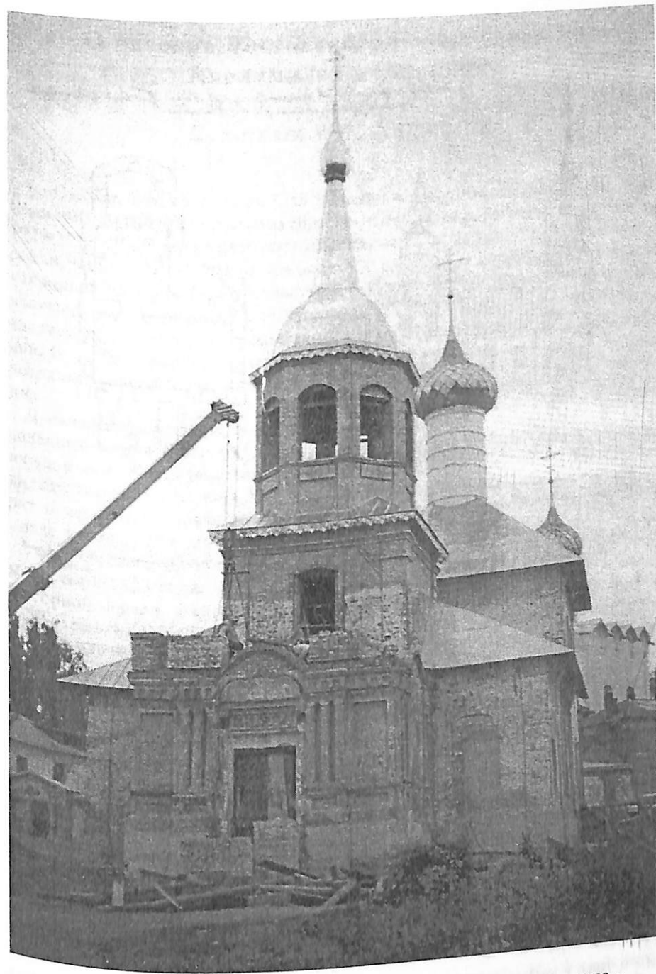
Ил. 8. Вид с юго-запада на Никольскую церковь на Подозерье. Фото 24 июля 2002 г.