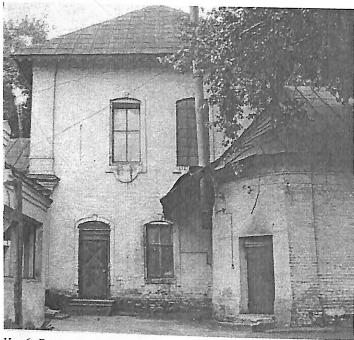
Ил. 6. Вид с севера на собственно Никольскую церковь на Подозерье и ее придел. Фото 1978 г.