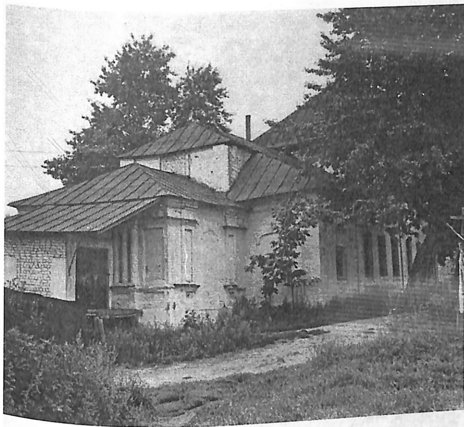
Ил. 5. Вид с юго-запада на церковь Никольскую на Подозерье. Фото 1978 г.