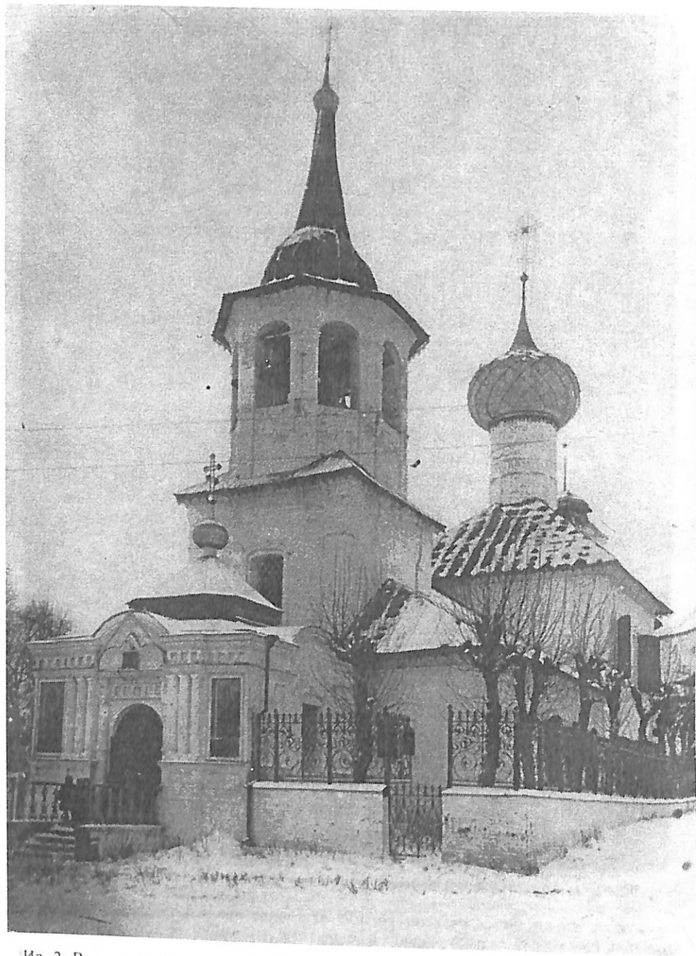
Ил. 2. Вид с юго-запада на церковь Никольскую на Подозерье (1745-1751). Фото 1920-х годов.