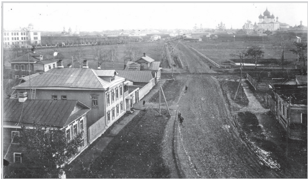
Вид на центр города Ростова с утраченной колокольни Введенской церкви, стоявшей в начале улицы Февральской. Фото конца 1920-х годов.