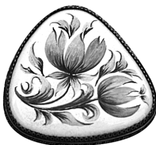
Ил. 18. Брошь «Два цветка». З.М. Зенкова. Научно-исследовательский институт художественной промышленности, конец 1950-х. Экспонировалась на Всероссийском смотре-выставке изделий народных художественных промыслов и промысловой кооперации РСФСР в Москве в 1960 году.