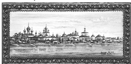
Ил. 16. Коробочка туалетная «Ростовский Кремль». Фрагмент.