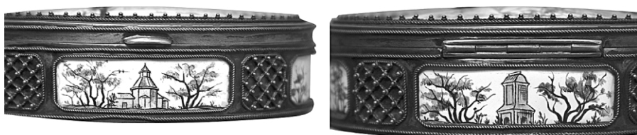
Ил. 14. Коробочка туалетная «Коломенское». Фрагмент.