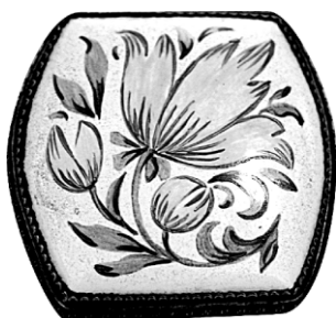
Ил. 17. Брошь «Жёлтый цветок». З.М. Зенкова. Научно-исследовательский институт художественной промышленности, 1960. Экспонировалась на Всероссийском смотре-выставке изделий народных художественных промыслов и промысловой кооперации РСФСР в Москве в 1960 году.