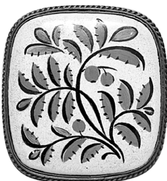
Ил. 21. Брошь «Рябинка». М.А.Тоне. Научно-исследовательский институт художественной промышленности, конец 1950-х. Экспонировалась на Всероссийском смотре-выставке изделий народных художественных промыслов и промышленной кооперации РСФСР в Москве в 1960 году.