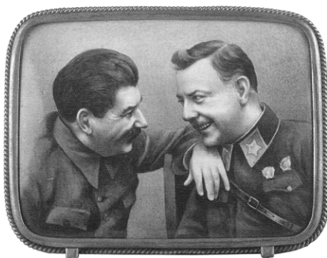
Ил. 3. Настольный портрет «т. И.В. Сталин и т. К.Е. Ворошилов». А.А. Назаров. Артель «Возрождение», 1936. Экспонировался на Всемирной художественно-промышленной выставке в Париже в 1937 году.