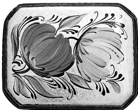
Ил. 20. Брошь «Два цветка». М.А.Тоне. Научно-исследовательский институт художественной промышленности, конец 1950-х. Экспонировалась на Всероссийском смотре-выставке изделий народных художественных промыслов и промышленной кооперации РСФСР в Москве в 1960 году.