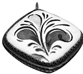
Ил. 22. Брошь и серьги с цветочной росписью. М.А.Тоне. Научно-исследовательский институт художественной промышленности, конец 1950-х. Экспонировались на Всероссийском смотре-выставке изделий народных художественных промыслов и промышленной кооперации РСФСР в Москве в 1960 году.