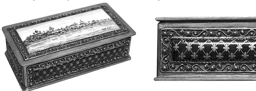
Ил. 15. Коробочка туалетная «Ростовский Кремль». А.М. Кокин. Артель «Ростовская финифть», артель «Красносельский ювелир», 1956. Экспонировалась на Выставке народно-прикладного и декоративного искусства в Москве в 1957 году и на Всемирной художественно-промышленной выставке в Брюсселе в 1958 году.