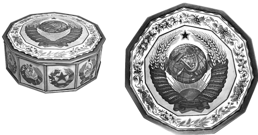
Ил. 6. Ларец «Гербы союзных республик». Н.А. Карасёв. Артель «Возрождение», 1938. Экспонировался на Международной художественно-промышленной выставке в Нью-Йорке в 1939 году.