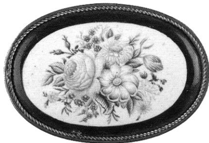
Ил. 5. Брошь с цветочной росписью. Неизвестный мастер (Е.Д. Евдокимов (?)) Артель «Возрождение», 1930-е.