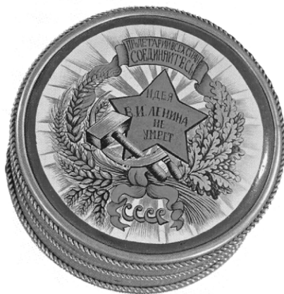
Ил. 1. Шкатулки. Н. И. Дубков. Учебно-показательная финифтяная школа, 1925. Экспонировались на Всемирной художественно-промышленной выставке в Париже в 1925 году.