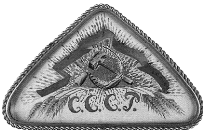
Ил. 2. Брошь. Неизвестный мастер. Учебно-показательная финифтяная школа, 1925. Экспонировалась на Всемирной художественно-промышленной выставке в Париже в 1925 году.