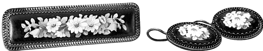
Ил. 23. Брошь и пара серег «Цветы». И. И. Солдатов, В. В. Солдатова Фабрика «Ростовская финифть», 1960. Экспонировались на Всероссийском смотре-выставке изделий народных художественных промыслов и промышленной кооперации РСФСР в Москве в 1960 году.