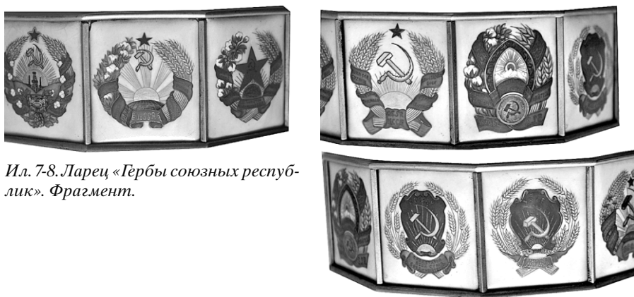
Ил. 7-8. Ларец «Гербы союзных республик». Фрагмент.