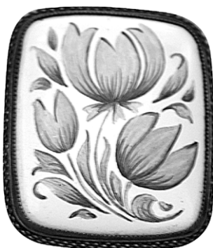
Ил. 19. Брошь «Три цветка». З.М. Зенкова. Научно-исследовательский институт художественной промышленности, конец 1950-х. Экспонировалась на Всероссийском смотре-выставке изделий народных художественных промыслов и промышленной кооперации РСФСР в Москве в 1960 году.