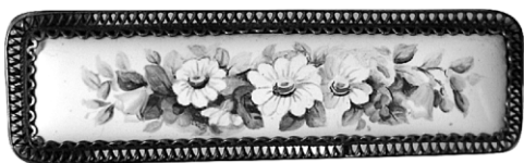
Ил. 24. Брошь и пара серег «Цветы». И. И. Солдатов, В. В. Солдатова Фабрика «Ростовская финифть», 1960. Экспонировались на Всероссийском смотре-выставке изделий народных художественных промыслов и промышленной кооперации РСФСР в Москве в 1960 году.