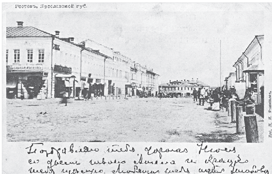
Ил. 2. Магазин «Колониальные товары» А. Д. Иванова. Открытка изд. Н. И. Фингоеева