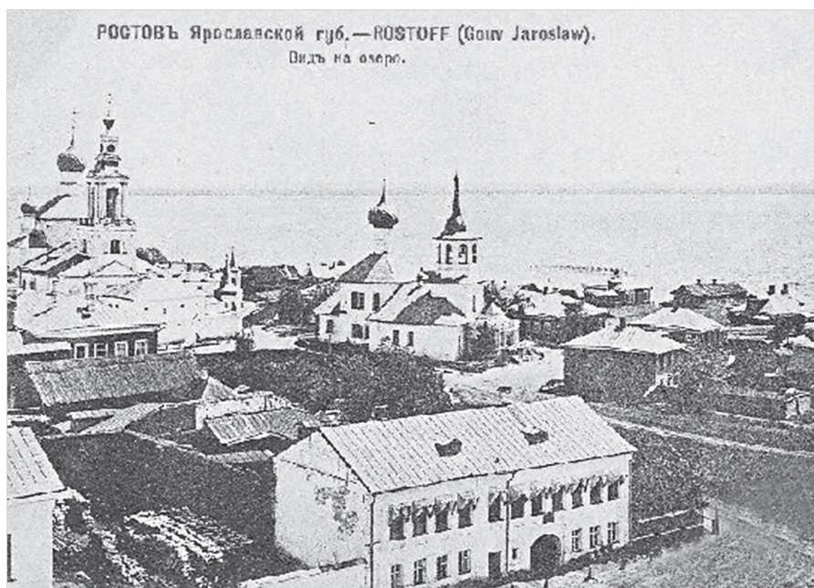
Ил. 3. Дом А. Д. Иванова. Открытка изд. Д. А. Иванова. Начало XX в.