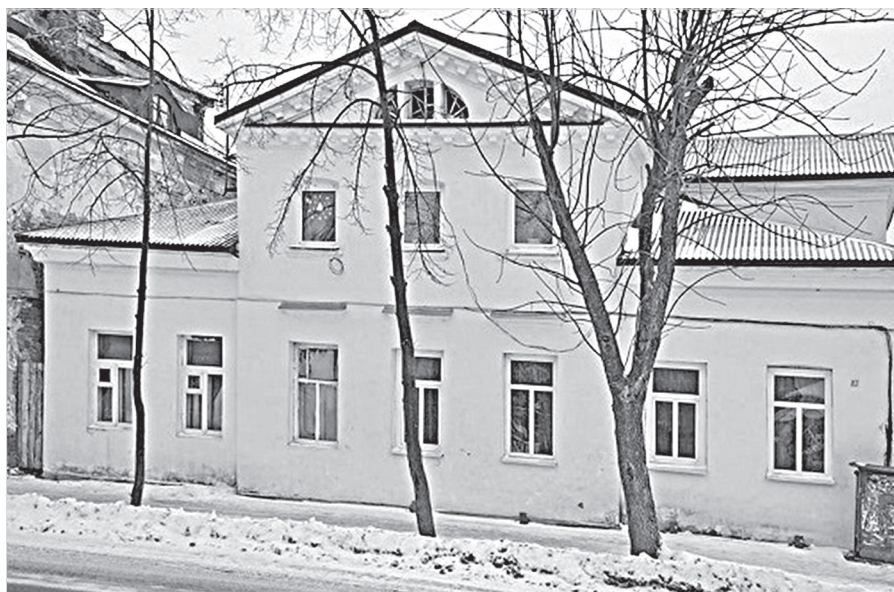
Ил. 9. Дом, в котором жила семья Н. А. Иванова (современный адрес: Ленинская улица, 17). Фотография В. А. Иванова, 2017