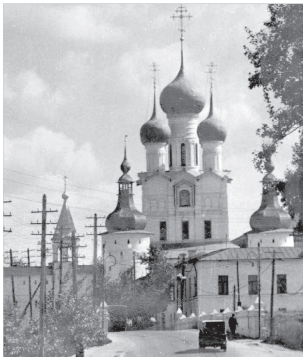
Ил. 9. Н. Ф. Суслов. Вид на каменный мост с западной стороны. 1962 г. ГМЗРК. ФТ-344/18