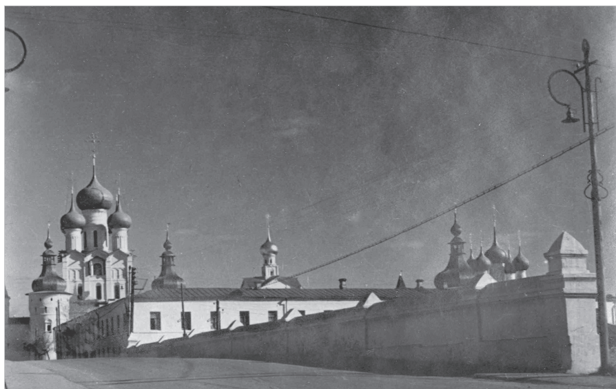
Ил. 8. Н. Ф. Суслов. Вид на каменный мост с западной стороны. 1960 г. ГМЗРК. ФТ-344/5