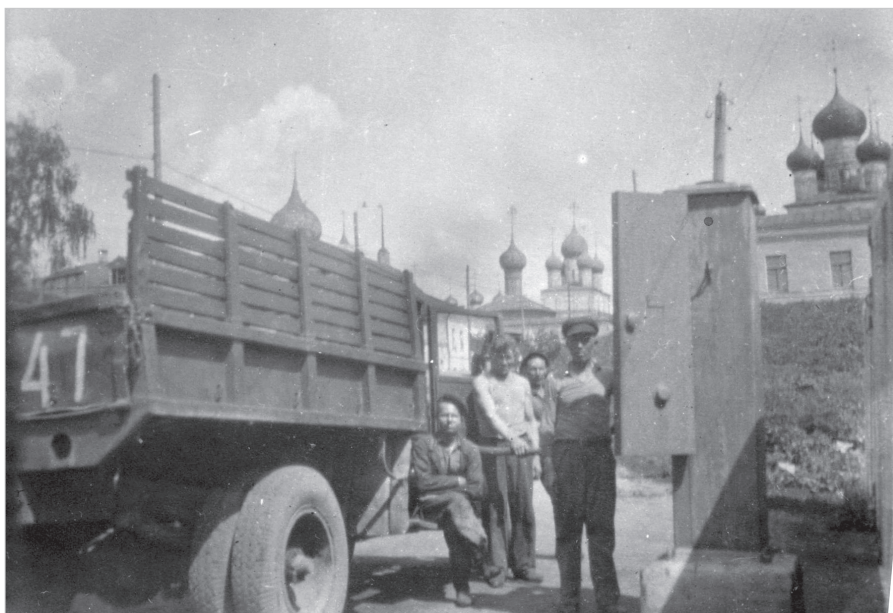
Ил. 4. Автозаправочная станция к югу от моста. Начало 1950-х гг.