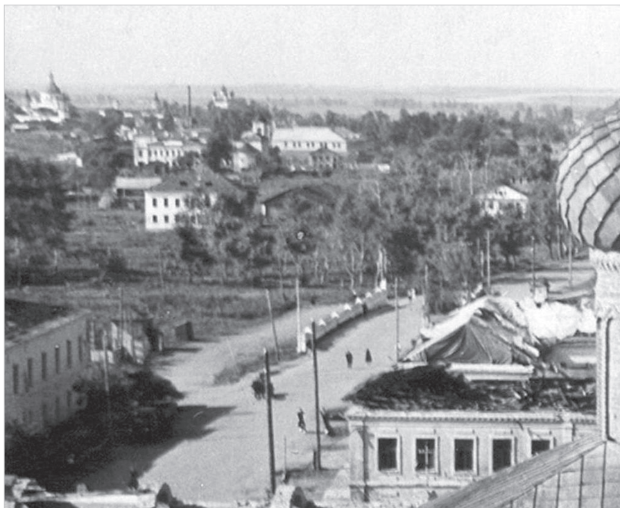
Ил. 5. Вид на каменный мост с северо-восточной стороны (фрагмент). 1953. ГМЗРК. ФТ-398/23