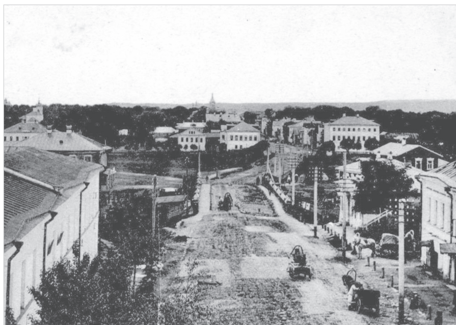
Ил. 1. Вид на каменный мост с восточной стороны (фрагмент). 1 четверть XX в. ГМЗРК. Фт-5723