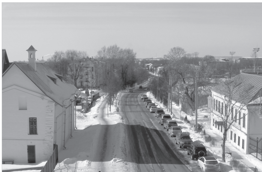
Ил. 12. Л. В. Печкина. Современный вид улицы Каменный мост. Март 2021