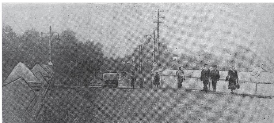
Ил. 6. На каменном мосту. Фотография из статьи «Сделаем Ростов красивым и благоустроенным» (Путь Ленина, 1957 г. 30 июня. Вып. 78)