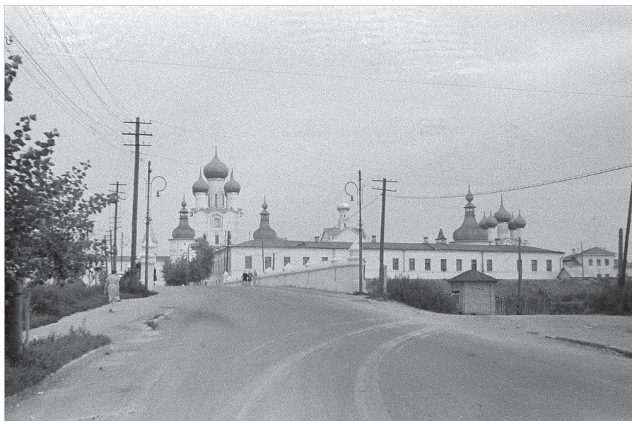
Ил. 7. В. С. Грачев. Вид на каменный мост с западной стороны. 1958–59 гг.