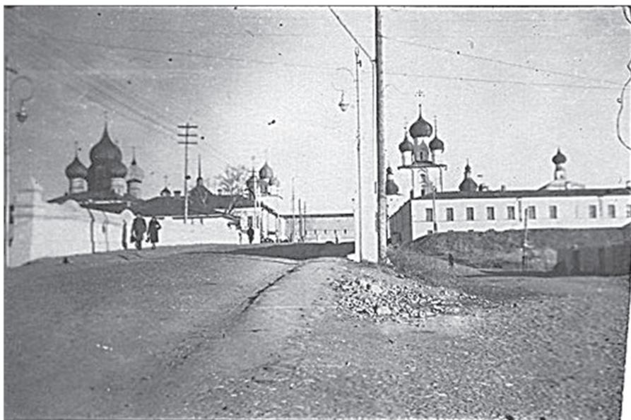
Ил. 3. Вид на каменный мост с западной стороны. 2 четверть XX в. Фотография из статьи Н. Ф. Черезовой «Как я ходила в детский сад в Ростове в послевоенные 1947–48 гг.» / Цикл «О Ростове и о себе» к 1150-летию Ростова // Ростовский вестник. 2011. 4 августа. Вып. 56