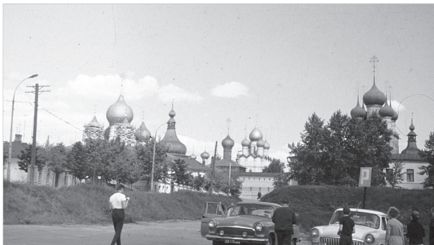
Ил. 11. Насыпь на месте уничтоженного каменного моста. 1971–1972 гг.