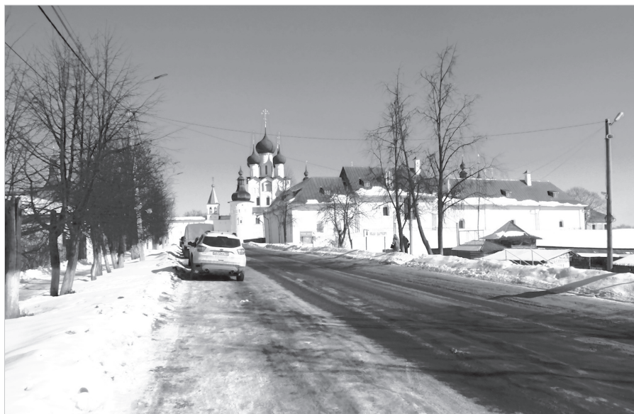
Ил. 13. Л. В. Печкина. Современный вид улицы Каменный мост. Март 2021