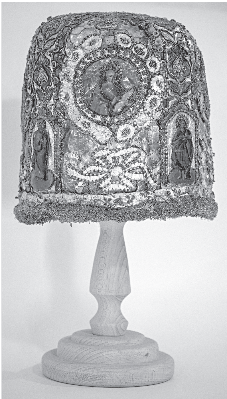
Ил. 3. Митра. 1790-е гг. ГМЗРК