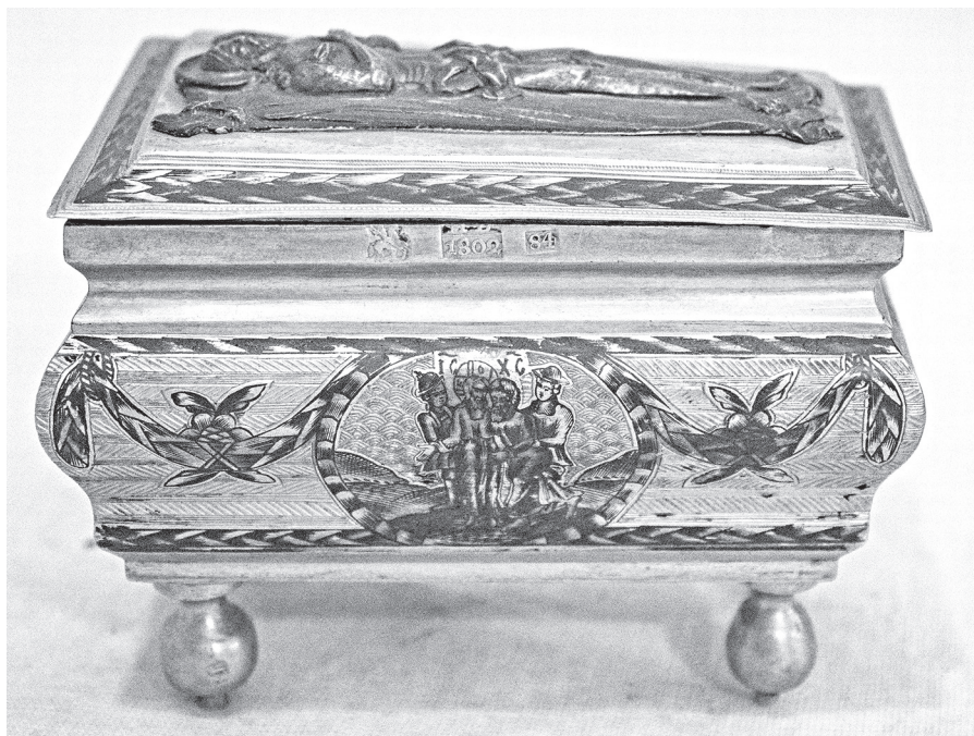
Ил. 2. Гробничка от дарохранительницы. 1802 г. ГМЗРК