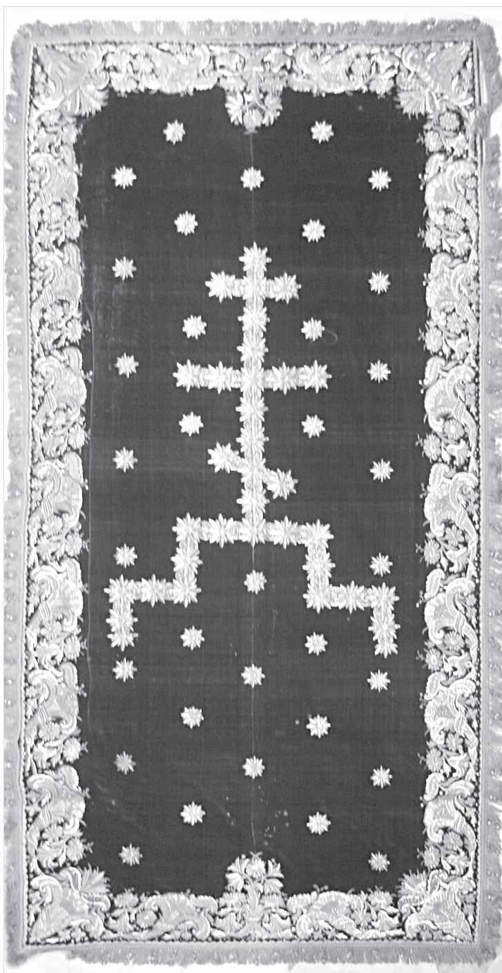
Ил. 4. Покров. Начало XIX в. ГМЗРК