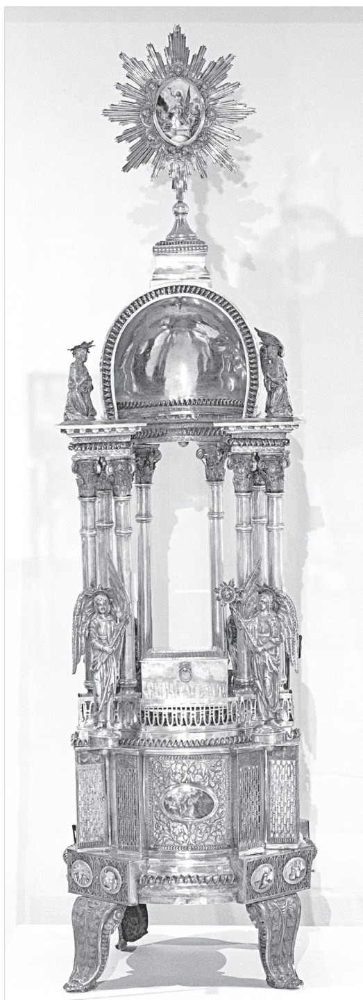
Ил. 1. Дарохранительница с сиянием. 1802 г. ГМЗРК