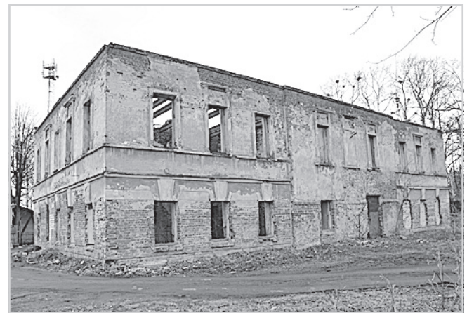
Фото 2012 г.

В 1909 — 1910 гг. в данном сооружении располагалось «Городское полицейское управление». Между прочим, одноэтажное здание тюрьмы, стоящее во дворе бывших уездных присутственных мест сохранилось. И что любопытно, некоторые люди, которые в нем теперь живут, знают о его первоначальном тюремном назначении.