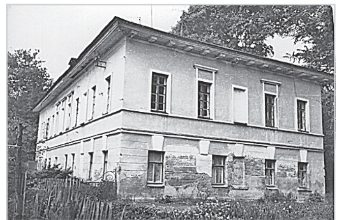
Фото 1990 г.