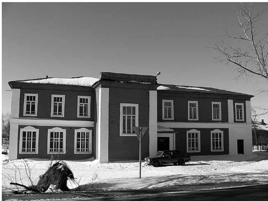
Ил. 3. Здание Сулостской школы 24 февраля 2008 г., вид с востока.