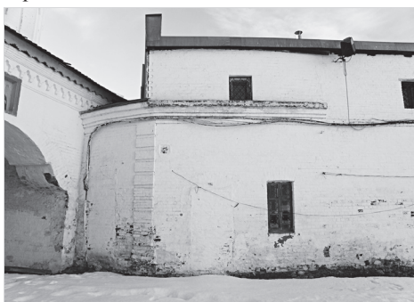
Ил. 12. Юго-восточная стена сторожки (1754 г.). Вид со стороны Соборного двора. Фото 2022 г.