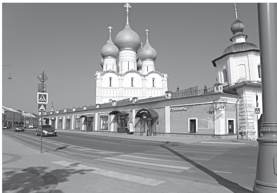
Ил. 9. Торговое здание № 8 на Соборной площади в Ростове. 1903 г. Фото 2021 г.