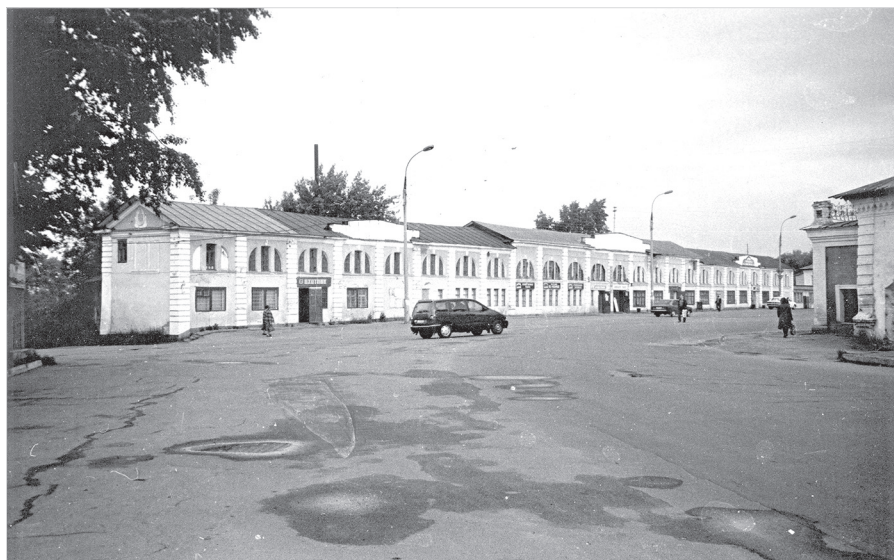
Ил. 14. Торговое здание № 5 на Соборной площади Ростова. Фото начала 2000-х гг.