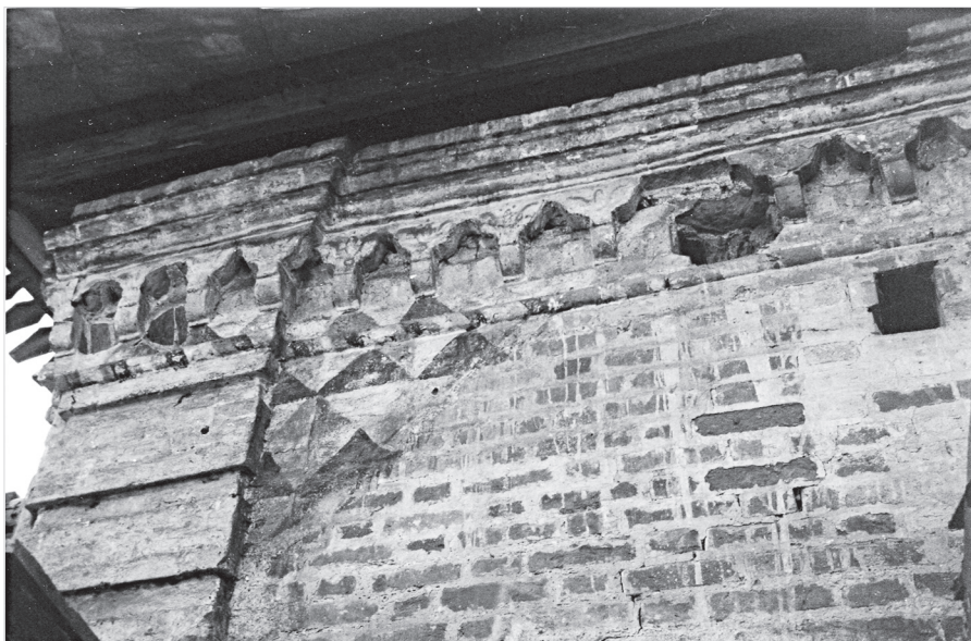
Ил. 3. Фрагмент близкой к первоначальной окраски Святых ворот Соборного двора Ростовского кремля.