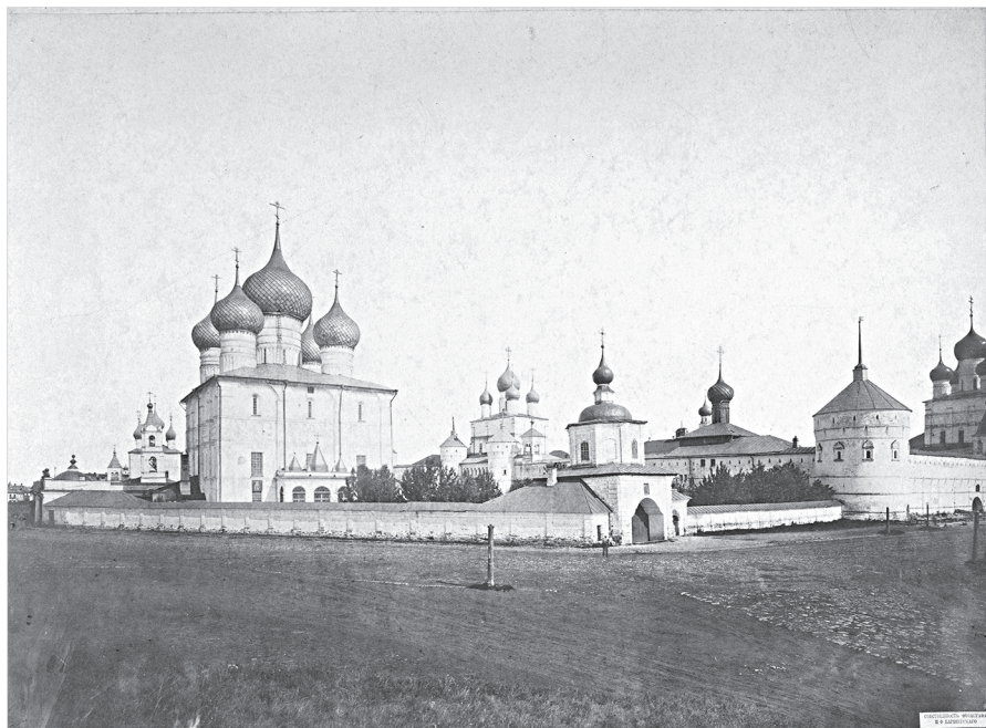
Ил. 1. Вид с северо-запада на Ростовский кремль. Фото И. Ф. Барщевского 1880-х гг. На переднем плане – Святые ворота, северо-западная и западная стены ограды Успенского собора