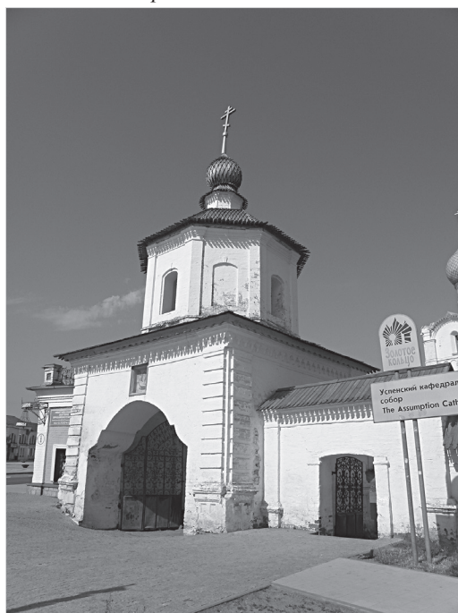
Ил. 2. Святые ворота Соборного двора Ростовского кремля. Фото 2021 г.