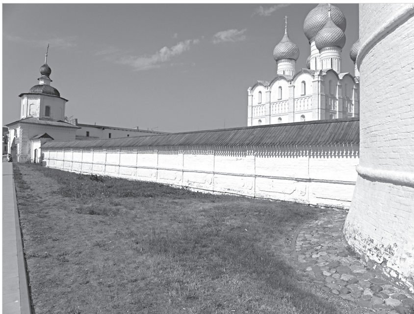
Ил. 7. Вид с юго-запада на западную стену ограды ростовского Успенского собора. Фото 2021 г.