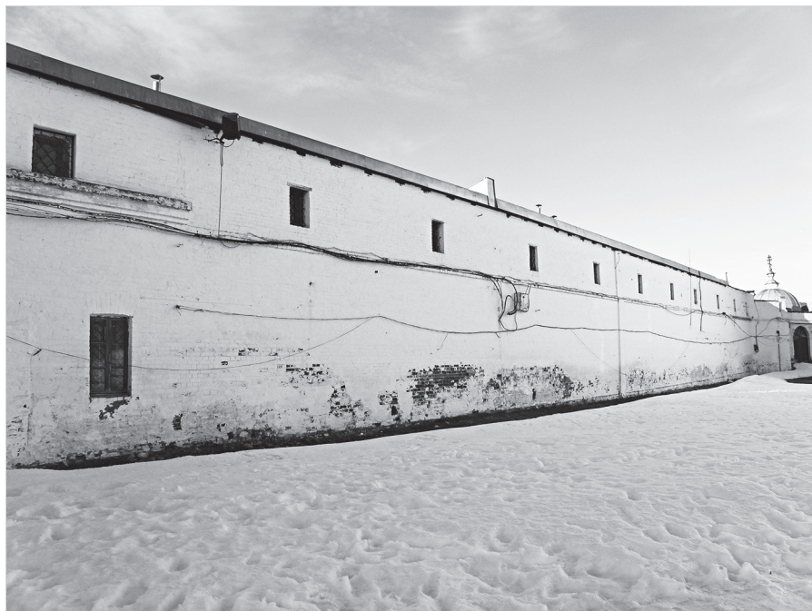
Ил. 13. Вид на юго-восточную стену корпуса каменных лавок (1903) со стороны Соборного двора. Фото 2022 г.