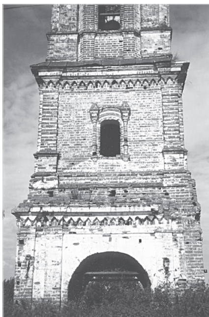
Ил. 6. Колокольня (между 1753 и 1763 гг.) Преображенской церкви в селе Никольском в Горах близ Ростова. Фрагмент. Фото 2004 г.