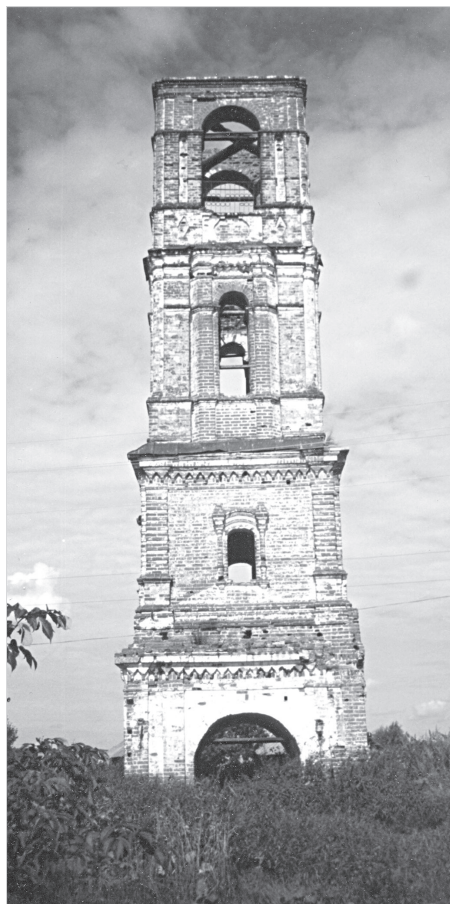
Ил. 5. Колокольня (между 1753 и 1763 гг.) Преображенской церкви в селе Никольском в Горах близ Ростова. Фото 2004 г.