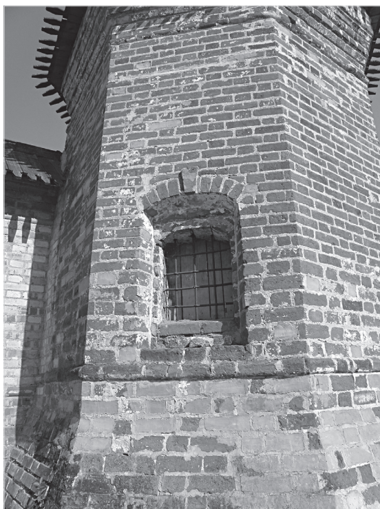
Ил. 4. Окно юго-западной угловой башни Митрополичьего сада Ростовского кремля. Середина XVIII в. Фото 2021 г.