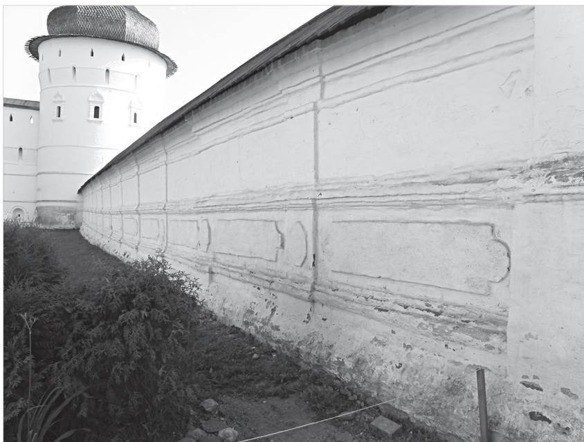
Ил. 8. Вид с северо-востока со стороны Соборного двора на западную стену ограды ростовского Успенского собора. Фото 2021 г.