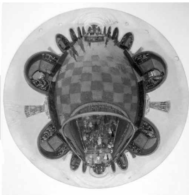
Ил. 5. Кищенков Л. И. Метро. Площадь Революции. 1960–1970-е гг. Картон, масло. 55x55. ГМЗРК. Ж-111