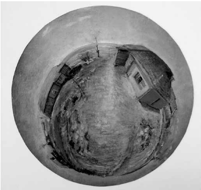
Ил. 4. Кищенко Л. И. Сельский пейзаж. 1960-е гг. (?) Картон, холст, масло. 24,5x24,5. ГМЗРК. Ж-92