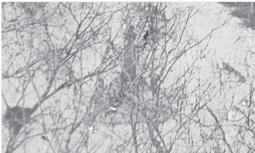
Ил. 8. Базарная площадь Поречья-Рыбного со 2-го яруса Никитской колокольни. Фрагмент. Бюст Александру II. 1914