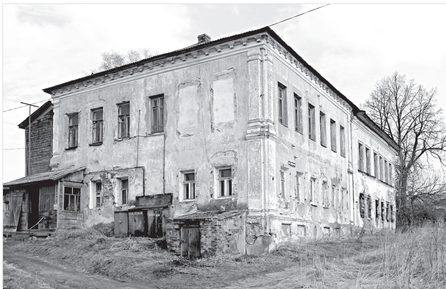
Ил. 1. Дом Костылевых в Поречье-Рыбном. 2013