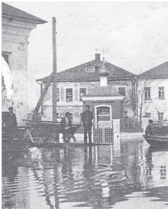
Ил. 4. Весеннее наводнение в Поречье-Рыбном. Фрагмент. Часовня св. благоверного князя Александра Невского. Апрель 1914