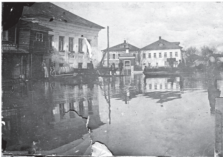
Ил. 3. Весеннее наводнение в Поречье-Рыбном. Апрель 1914