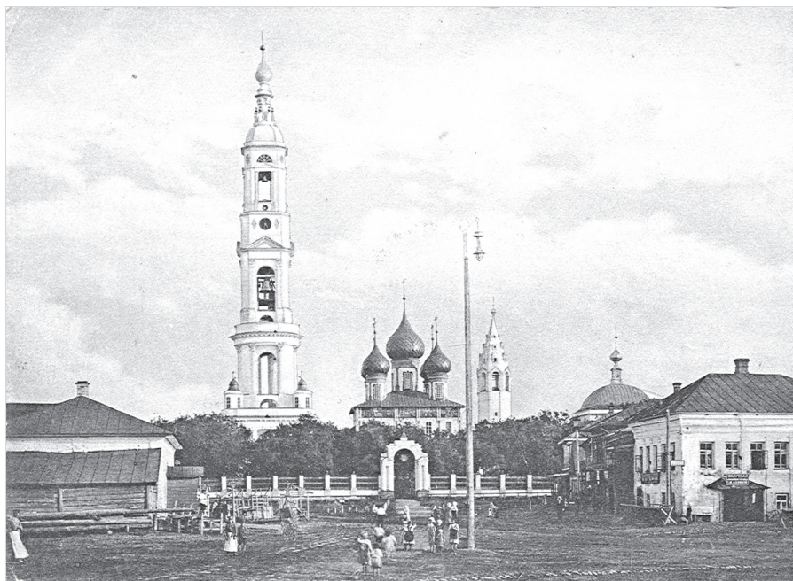
Ил. 5. Окрестности Ростова Великого. Село Поречье. Почтовая карточка. Издание Д. А. Иванова. 1914