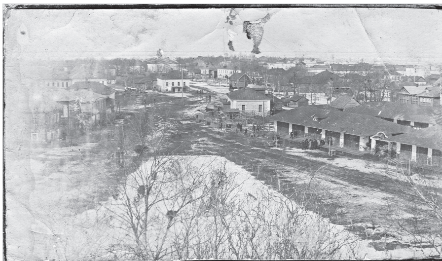
Ил. 7. Базарная площадь Поречья-Рыбного со 2-го яруса Никитской колокольни. Сквер и бюст Александру II. 1914