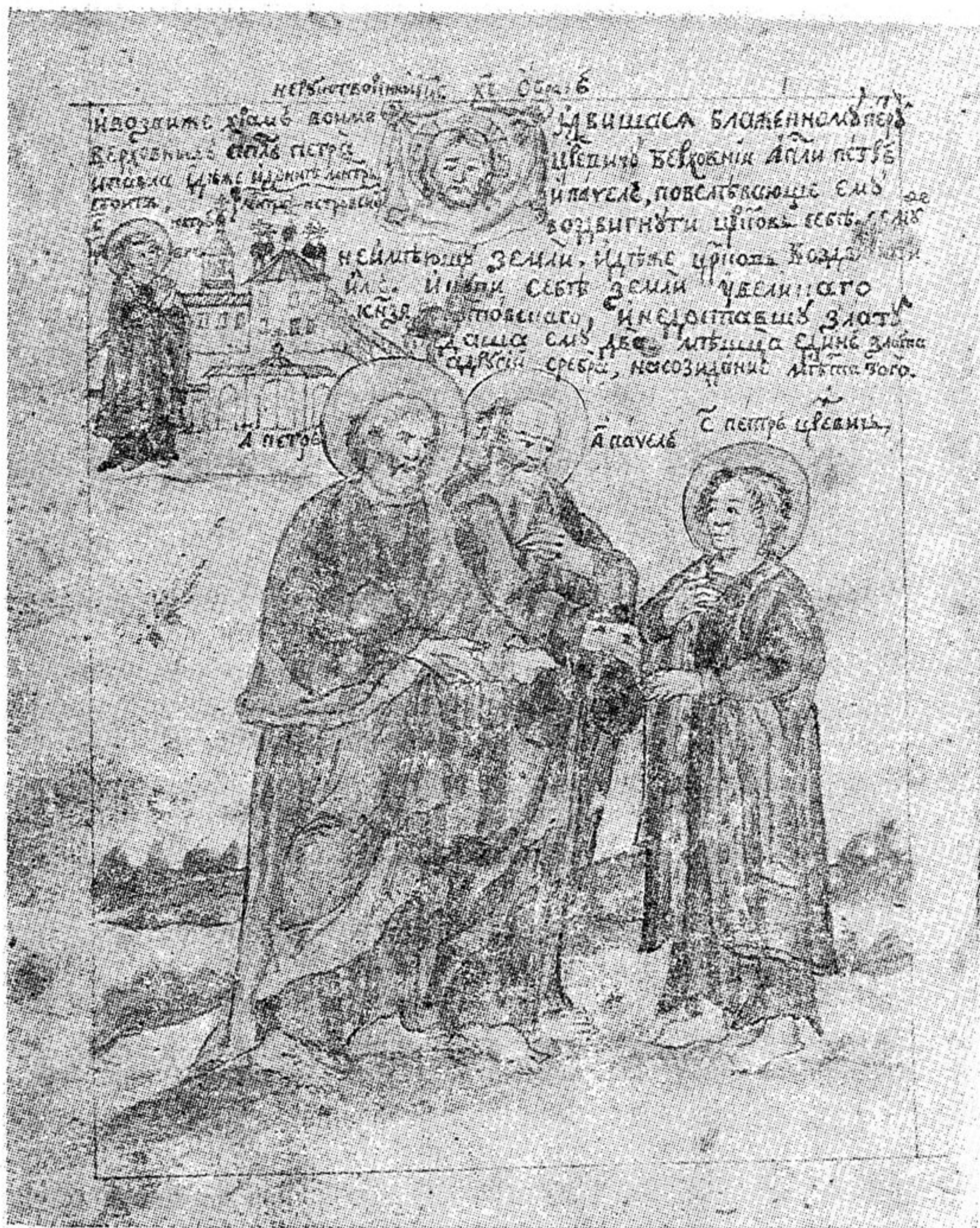
Рис. 1. «Ростовский патерик», 1760-е гг. Миниатюра «Явление апостолов Петра и Павла Петру царевичу» с изображением Петровского монастыря.

представляет Опись Петровского монастыря 1748 г. колокольню и помещения теплой трапезной церкви: «При тех святых церквах колокольня каменная шатровая на ней глава обит черепицею крест и чеши железные... Под тою колокольнею и