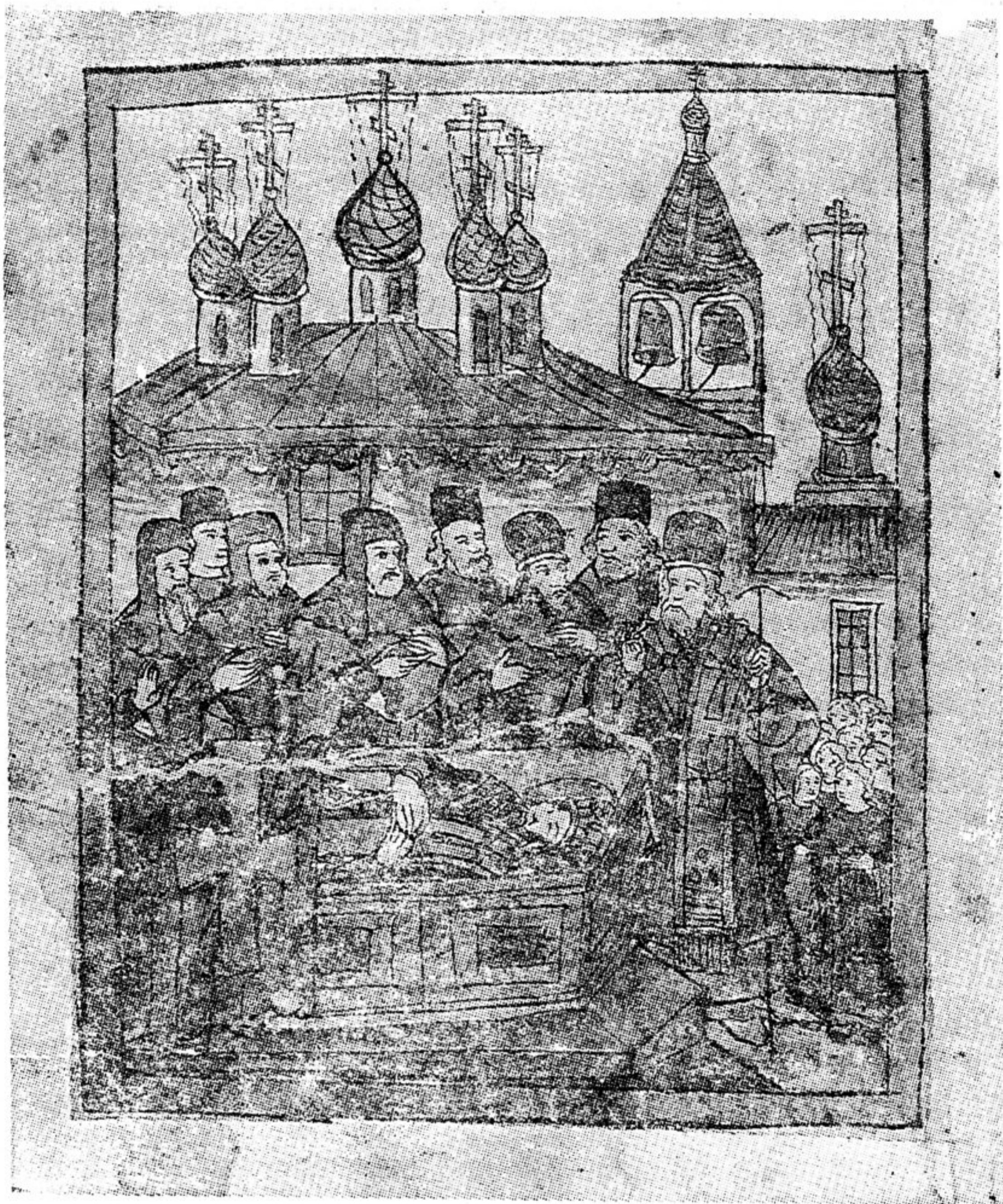
Рис. 4. «Ростовский патерик», 1760-е гг. Миниатюра «Обретение мощей св. Димитрия Ростовского в Троицком соборе Яковлевского монастыря».

Судя по публикуемым рисункам, колокольня располагалась около северо-западного угла Троицкого собора, соединяясь в нижней своей части с приделом св. Иакова (первоначально Зачатьевский).