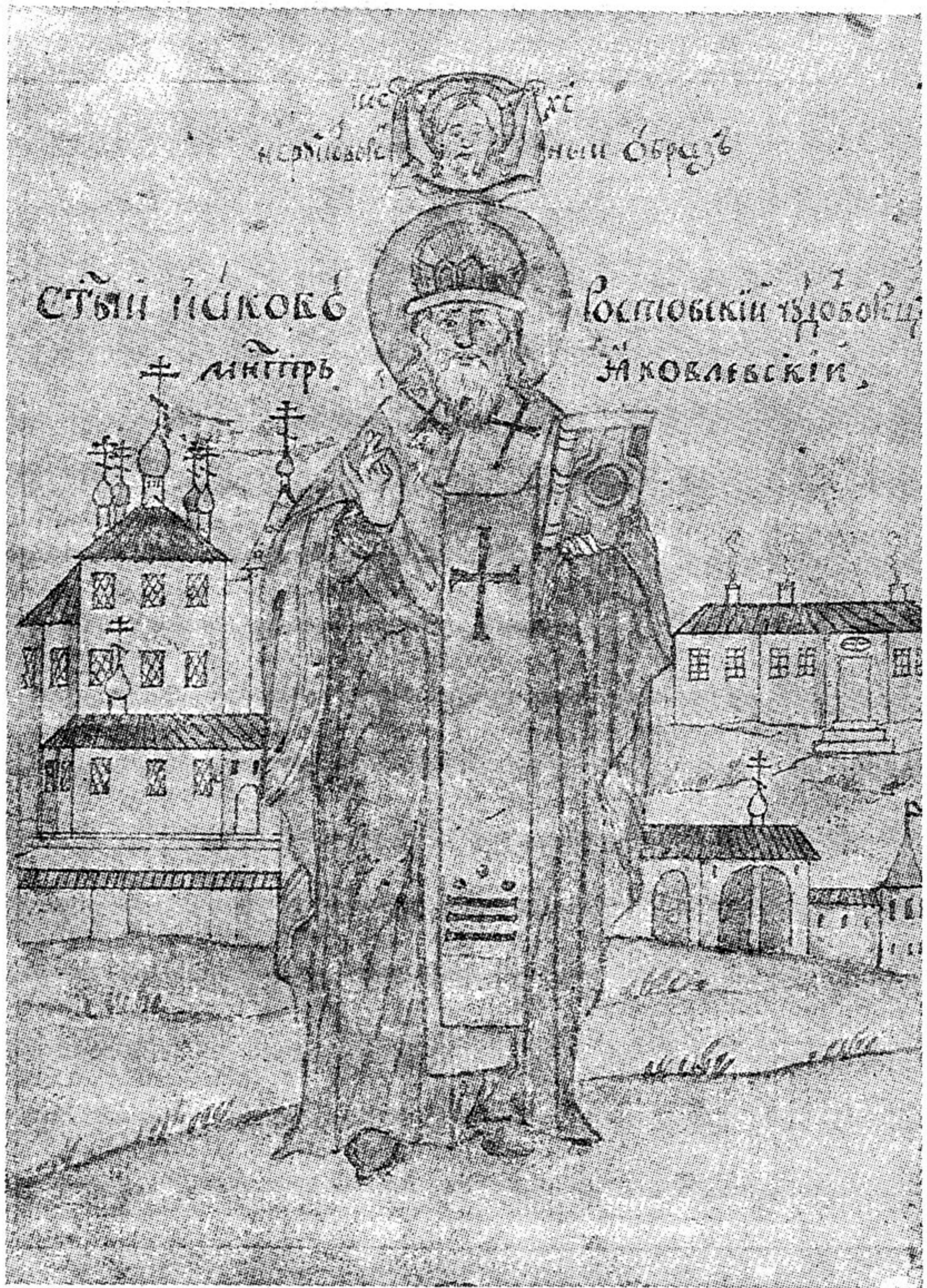
Рис. 2. «Ростовский патерик», 1760-е гг. Миниатюра «Св. Иаков Ростовский». На втором плане изображение Яковлевского монастыря.