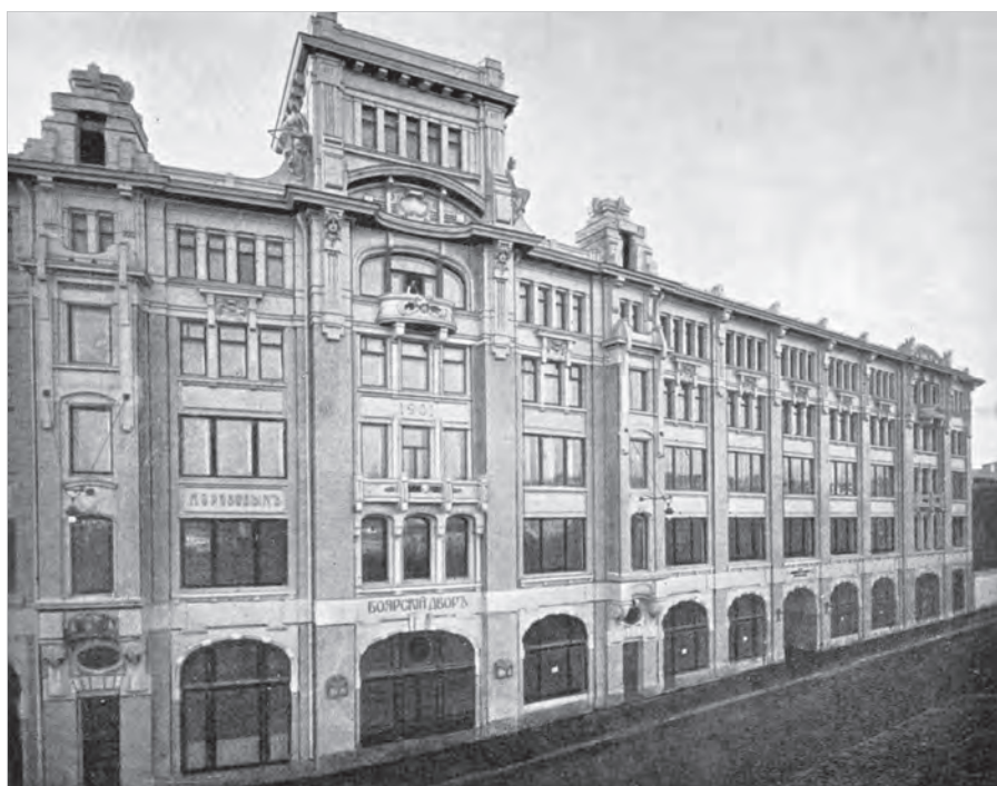
Ил. 4. Гостиница «Боярский двор». Москва. Фото. Начало XX в.