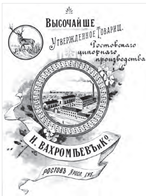
Ил. 7. Товарищество «И. Вахромеев и К о ». Бланк для писем, фрагмент. Конец XIX в. ГАЯО