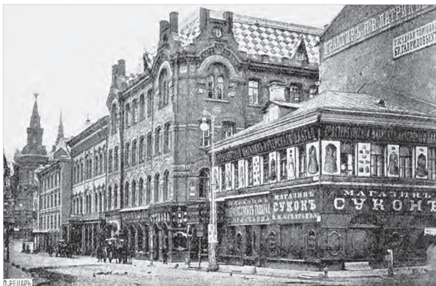
Ил. 3. Гостиница «Лоскутная». Москва. Фото. 1880-е гг.