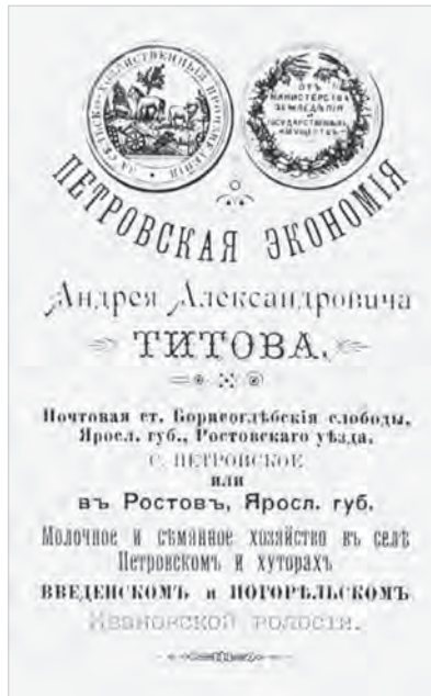
Ил. 5. Петровская экономия Ан. Ал. Титова. Бланк для писем, фрагмент. 1890-е гг.