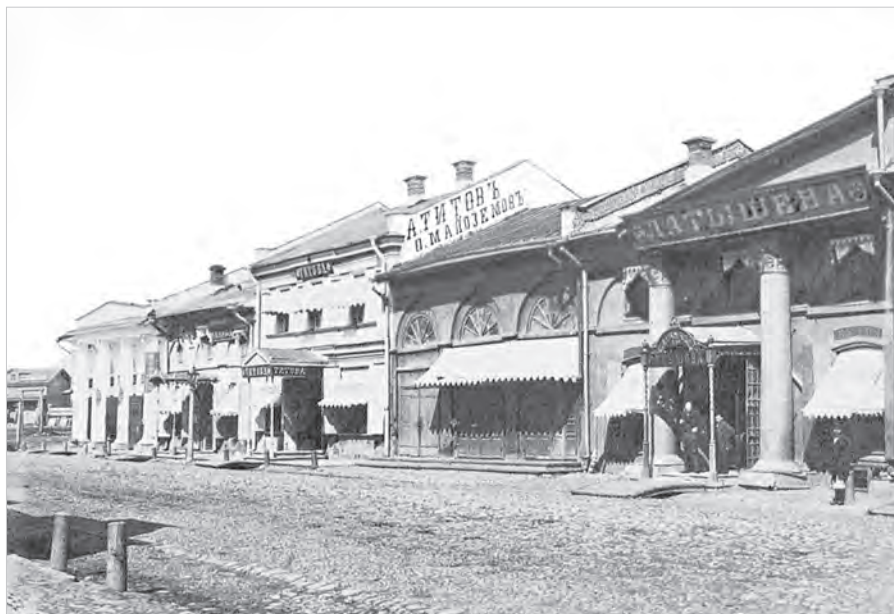
Ил. 10. Магазин Торгового дома «А. Титов и Ф. Малоземов». Ростов. Фото. Конец XIX в. ГМЗРК