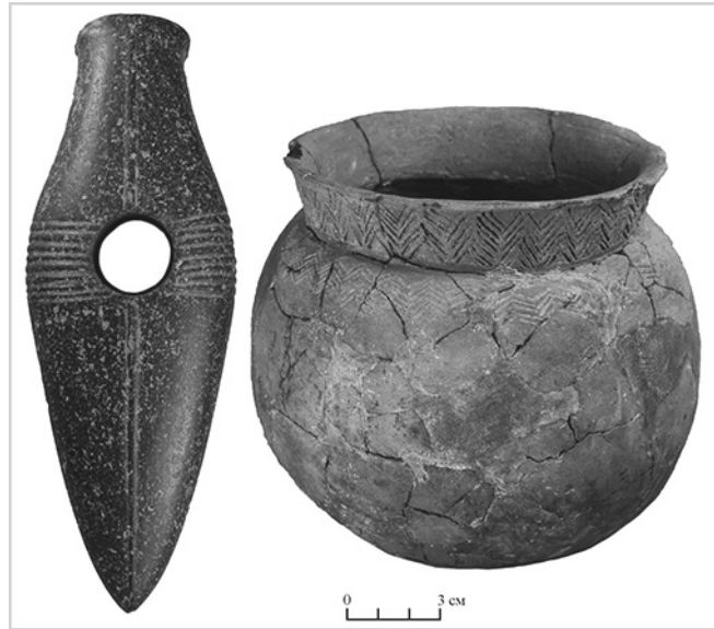
Боевой топор и сосуд фатьяновской культуры, представленные в исторической экспозиции музея. Подробная информация о них опубликована в блоге «Ростовская земля. История и культура» http://rostland.blogspot.ru/