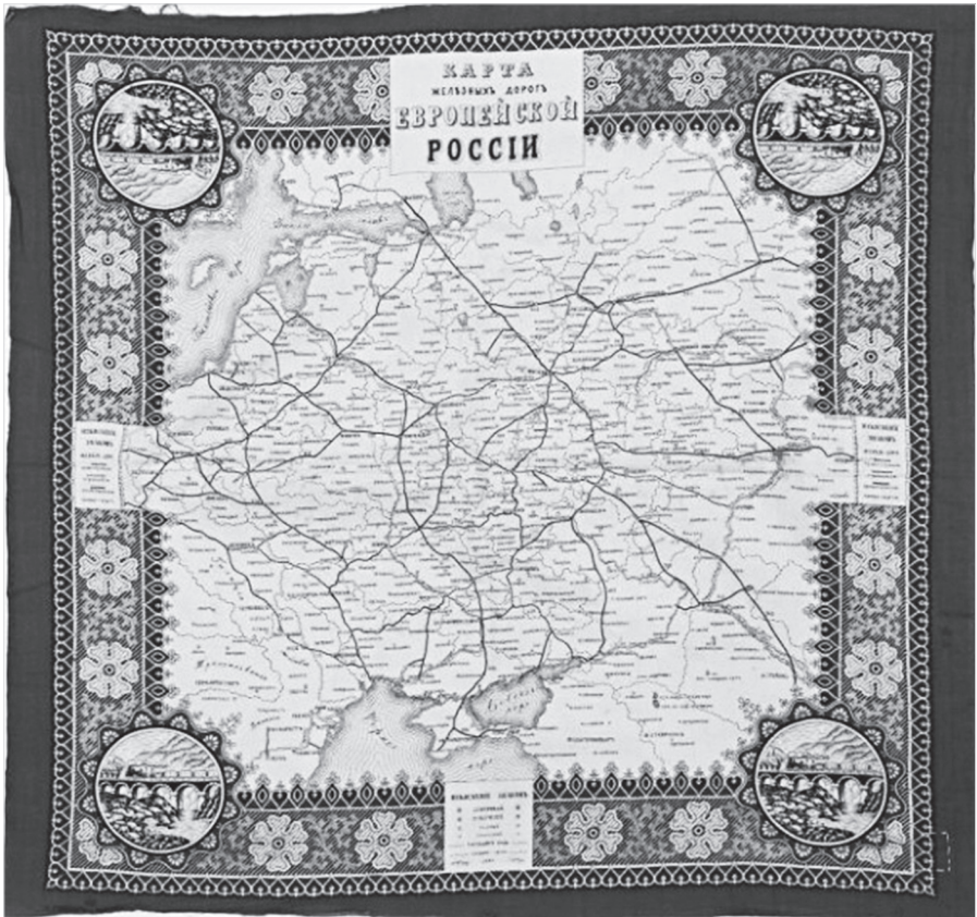
Ил. 10. Платок с изображением карты железных дорог Европейской России. ГМЗРК