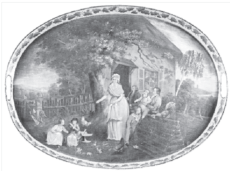
Ил. 3. Чайный поднос середины – второй половины XVIII в. Нижний Тагил.