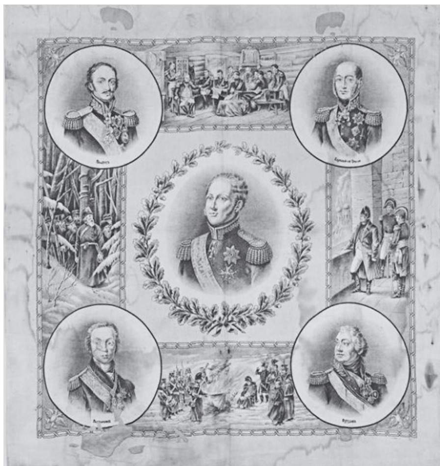
Ил. 7. Платок к 100-летию юбилею Отечественной войны 1812 г. (первый). ГМЗРК