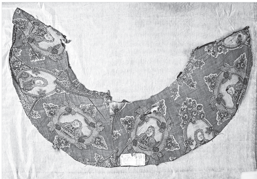
Ил. 1. Фрагмент ситцевой подкладки мехового воротника с портретами сподвижников Петра I – Франца Яковлевича Лефорта и князя Дмитрия Федоровича Ромодановского. ГМЗРК