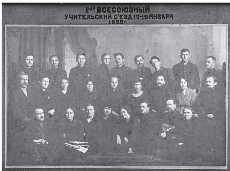
Ил. 13. Групповая фотография ярославских делегатов учительского съезда вместе с Л. Д. Троцким (в центре заднего ряда). 1925 г.