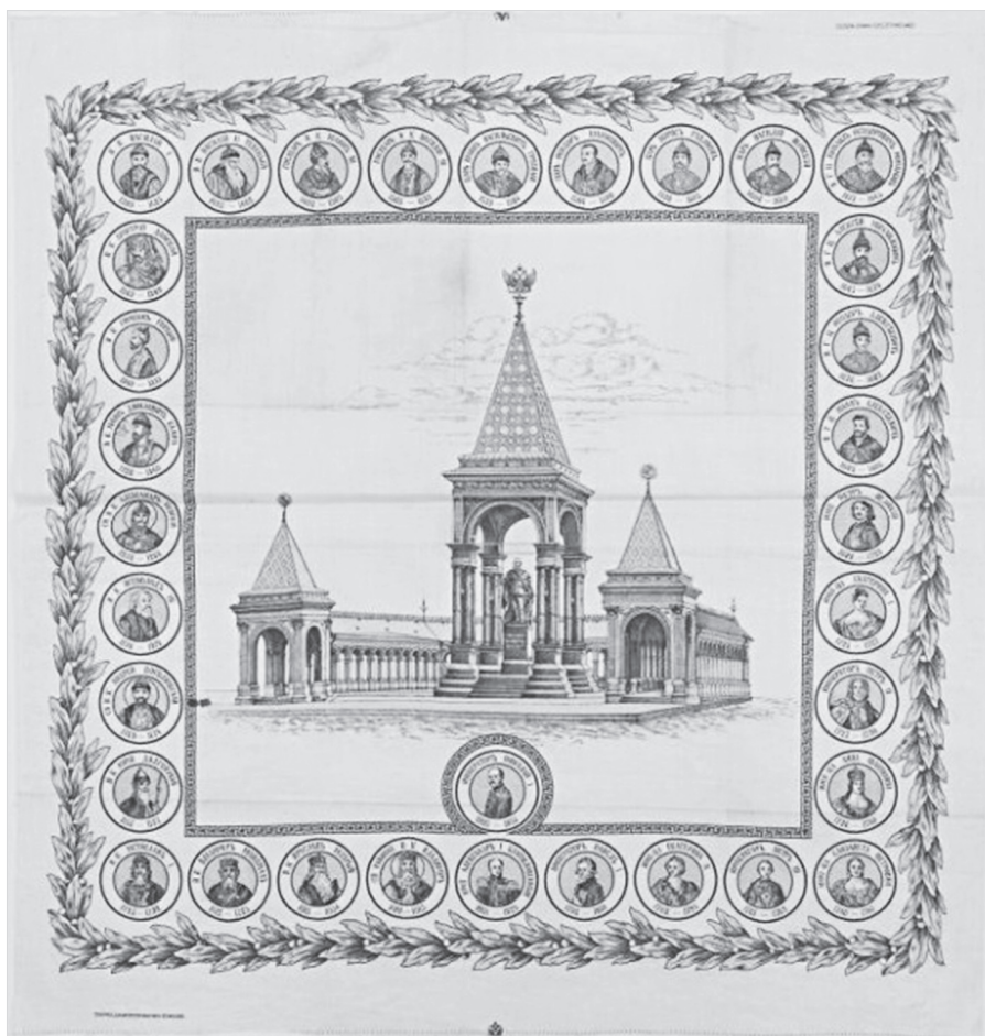
Ил. 9. Платок с изображением ныне утраченного памятника Александру II в Московском Кремле, заложенный 14 мая 1893 г. и официально открытый 16 августа 1898 года. ГМЗРК