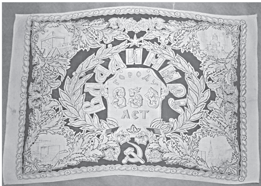
Ил. 16. Фрагмент ткани с сюжетом «850 лет г. Владимиру». 1958 г. ГМЗРК