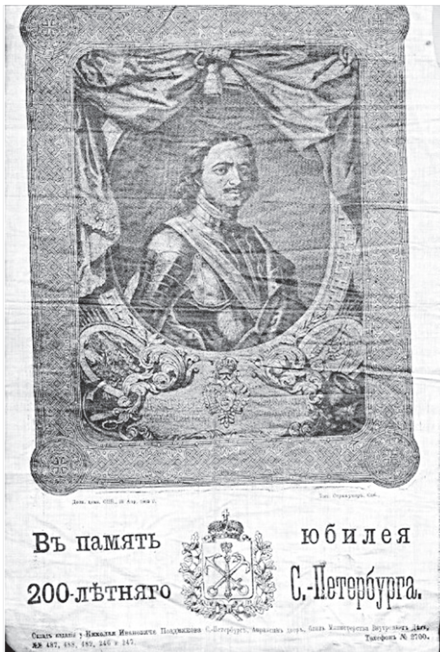
Ил. 4. Тканевый сувенир к 200-летию юбилею Петербурга — портрет Петра I. ГМЗРК