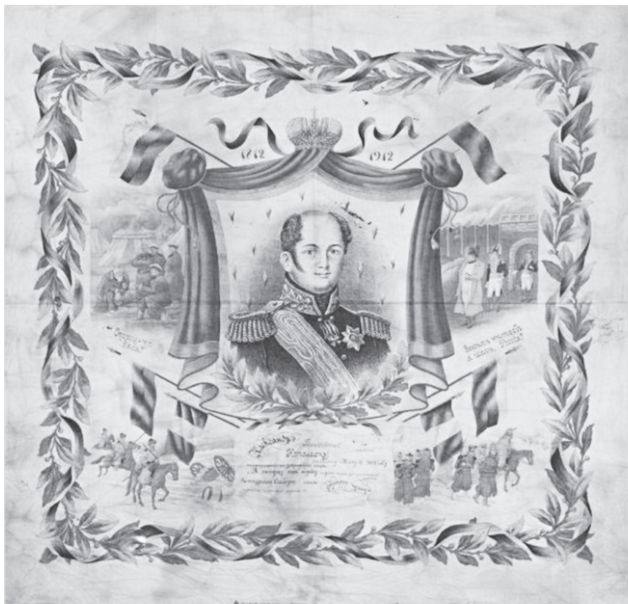
Ил. 8. Платок к 100-летию юбилею Отечественной войны 1812 г. (второй). ГМЗРК