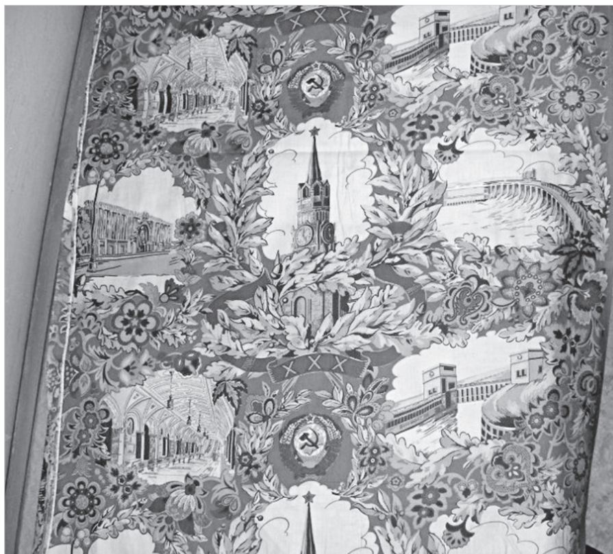
Ил. 14. Отрез ситца выпуска 1947 г. ГМЗРК