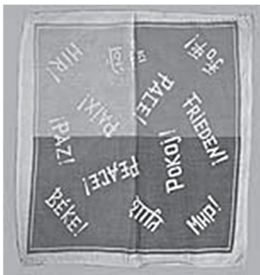
Ил. 15. Платок, выпущенный к VI Всемирному фестивалю молодежи и студентов. 1957 г. Москва. ГМЗРК