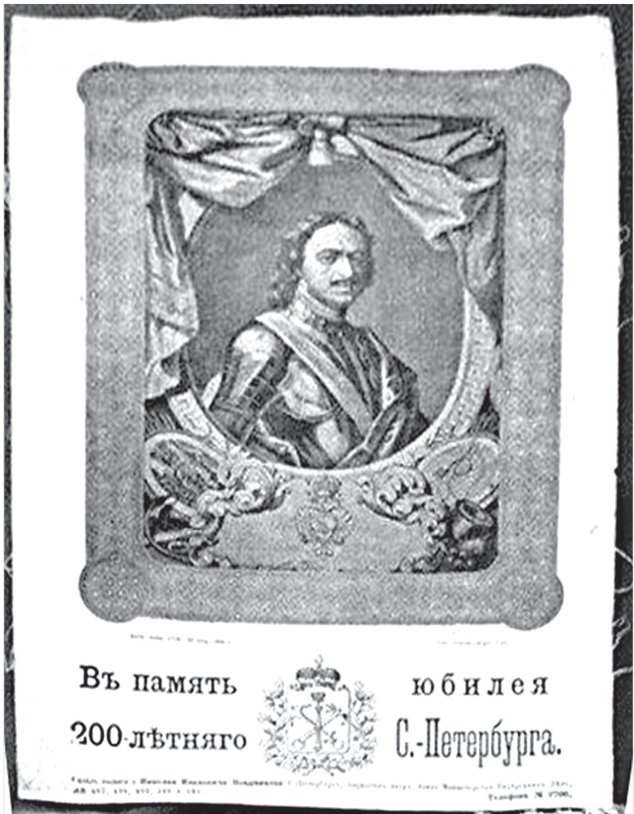
Ил. 6. Аналог тканевого сувенира, но черного цвета из музея Петергофа