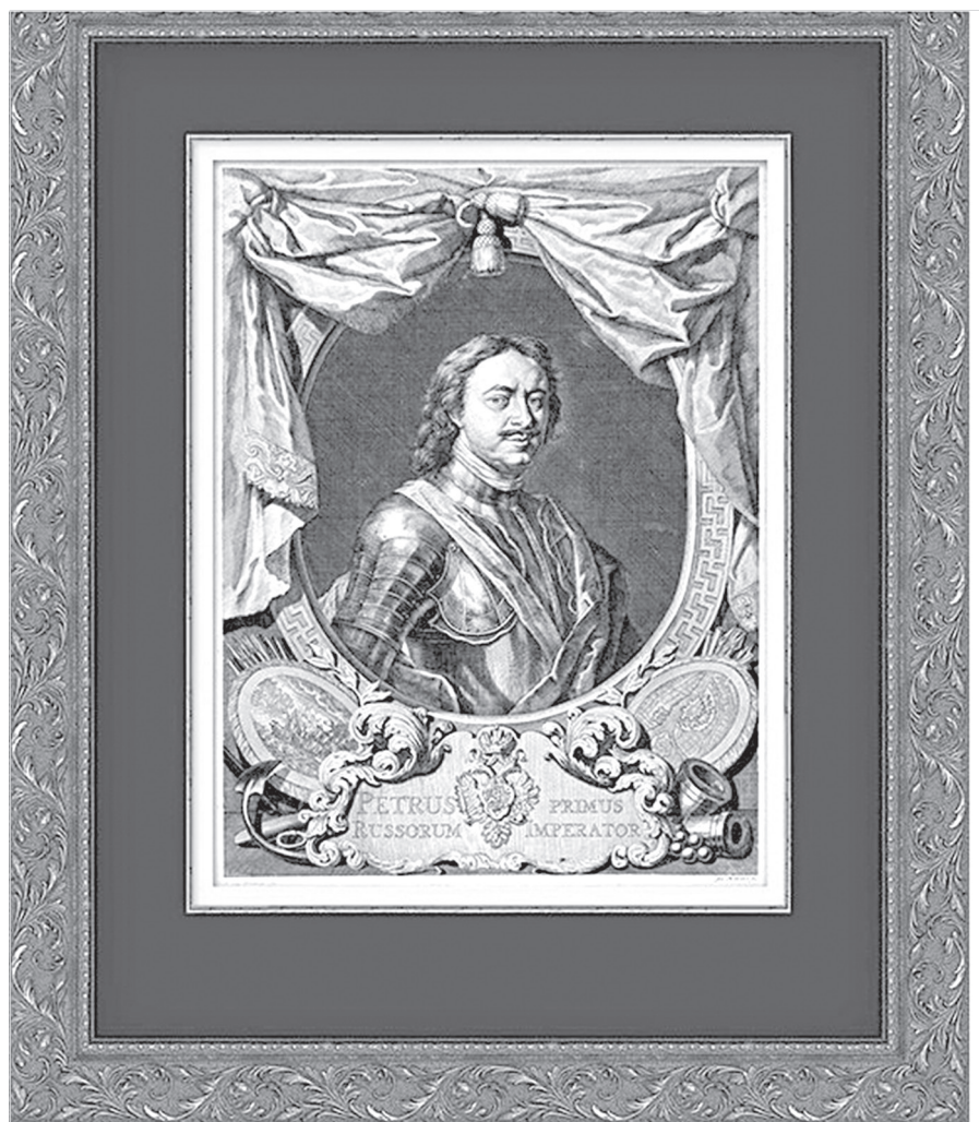
Ил. 5. Оригинал К. Моора 1725 г.