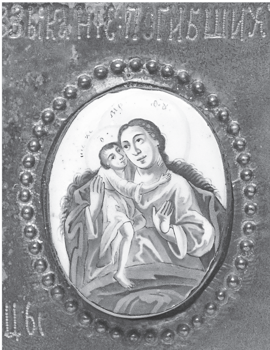
Ил. 8. Взыскание погибших. Дробница иконы «Избранные лики Богоматери с Распятием Христовым и Ростовскими чудотворцами». Конец XVIII в.