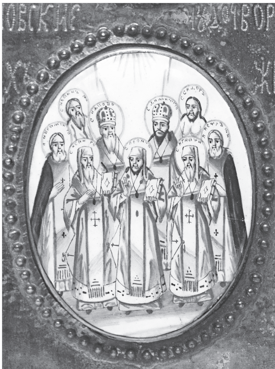
Ил. 6. Ростовские чудотворцы. Дробница иконы «Избранные лики Богоматери с Распятием Христовым и Ростовскими чудотворцами». Конец XVIII в.