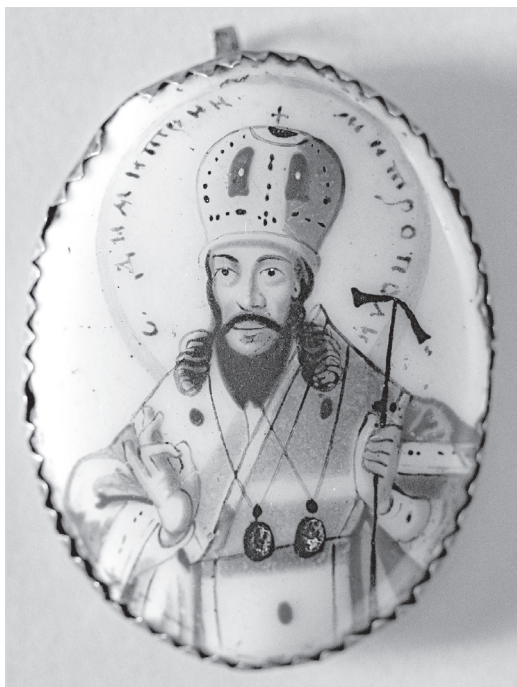
Ил. 9. Образок «Святитель Димитрий Ростовский». Около 1794 г. ГМЗРК. Ф-1617