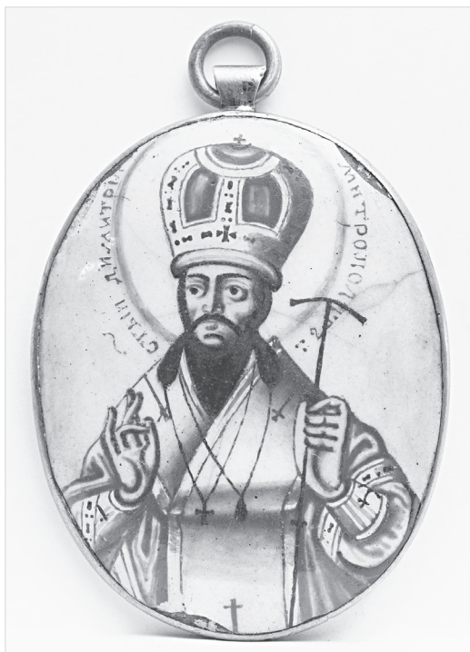
Ил. 10. Образок «Святитель Димитрий Ростовский». Конец XVIII в. Медь, эмаль, живопись по эмали; латунь, серебрение (?) 7,7×5,2 (с кольцом). Коллекция Л. И. Вольфсона