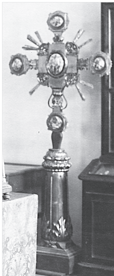
Ил. 2. Запрестольный крест 1793 г. из Ростовского кафедрального Успенского со- бора. Фрагмент фотографии 1927 г. ГМЗРК. ФТ-1803