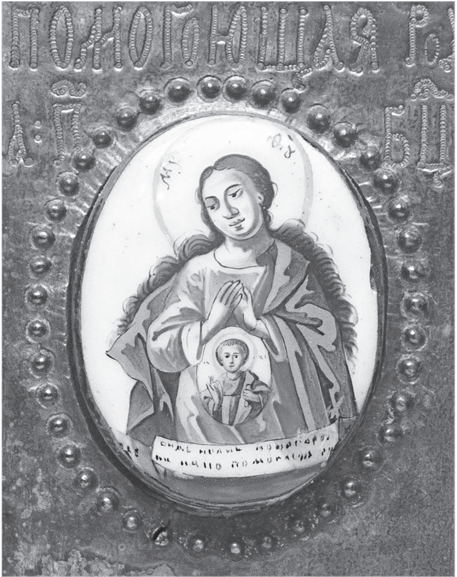
Ил. 7. Богоматерь, помогающая в родах. Дробница иконы «Избранные лики Богоматери с Распятием Христовым и Ростовскими чудотворцами». Конец XVIII в.