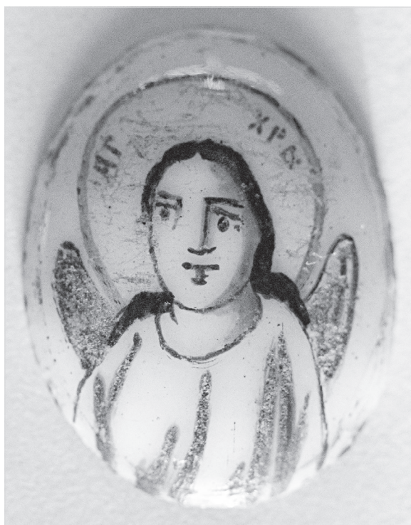
Ил. 12. Образок «Ангел Хранитель». Конец XVIII в. ГМЗРК. Ф-1738