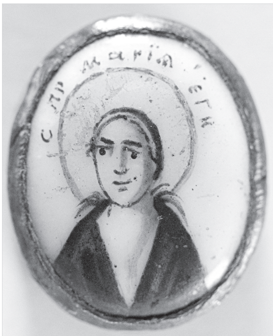
Ил. 13. Преподобная Мария Египетская. Конец XVIII в. ГМЗРК. Ф-1743