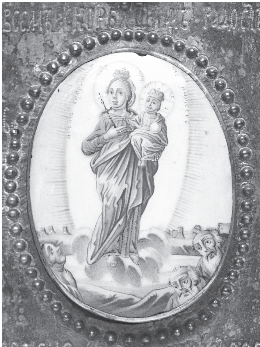
Ил. 4. Богородица Всех скорбящих радости. Дробница иконы «Избранные лики Богородицы с Распятием Христовым и Ростовскими чудотворцами». Конец XVIII в.