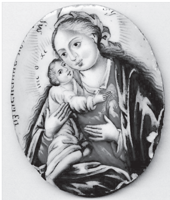
Ил. 11. «Богоматерь Взыскание погибших». Конец XVIII в. ГМЗРК. Ф-1606