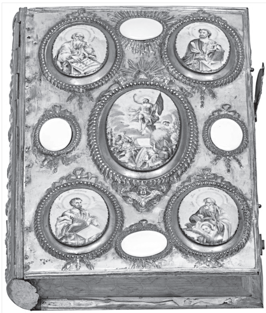
Ил. 14. А. И. Всевятский. Оклад Евангелия. ГМЗРК. Инв. № М-3066