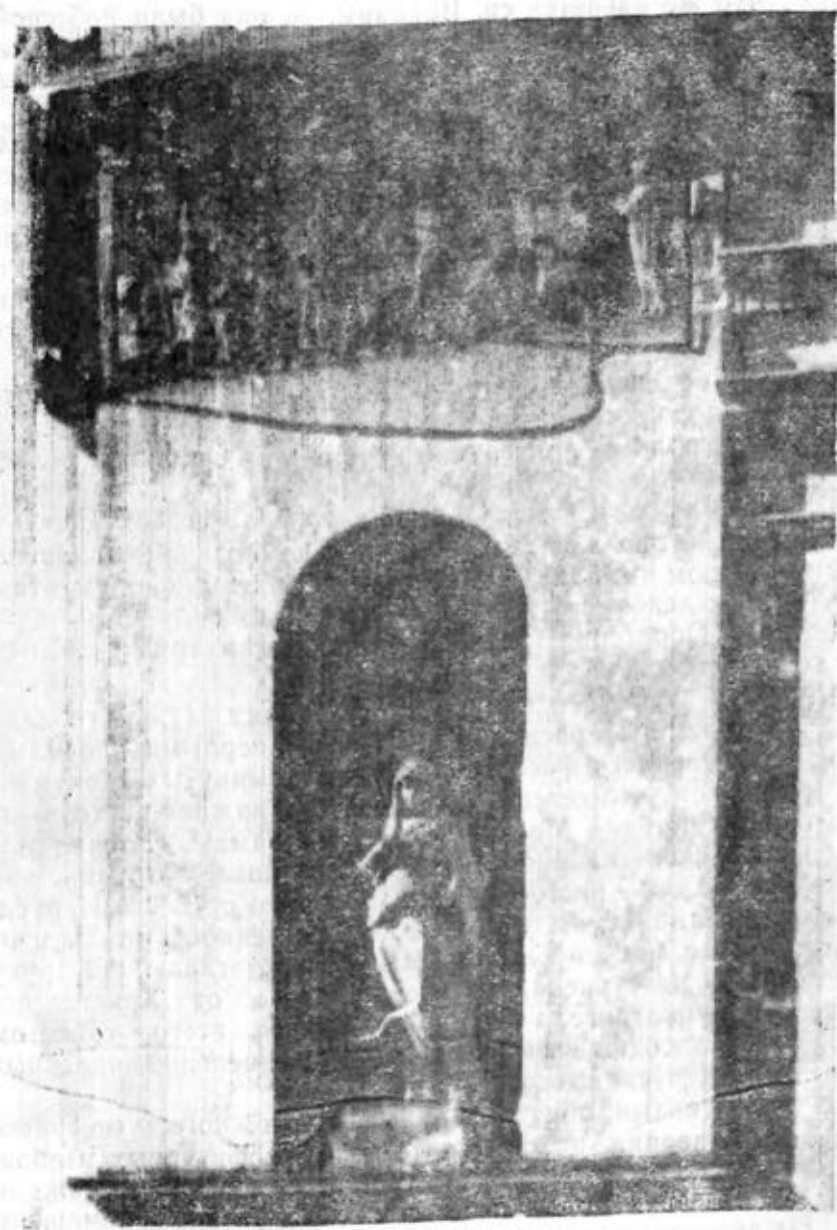
Рис. 3. Статуя св. мученицы в нише южного фасада Димитриевского храма. Выше рельеф «Поклонение волхвов»