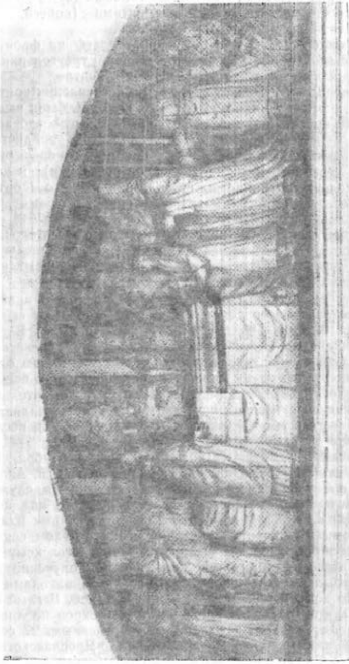
Рис. 5. «Обрежение мощей св. Дмитрия». Рельеф тимпана северного портика Дмитриевского храма Спасо-Яковлевского монастыря. 1799—1801 гг.