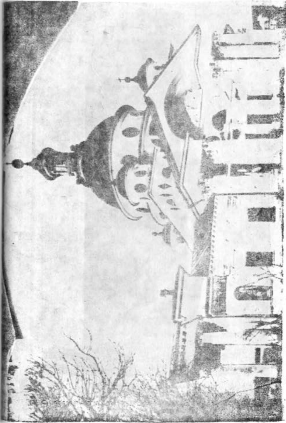
Рис. 1. Дмитриевский храм Спасо-Яковлевского монастыря. 1795—1801 гг. Южный фасад