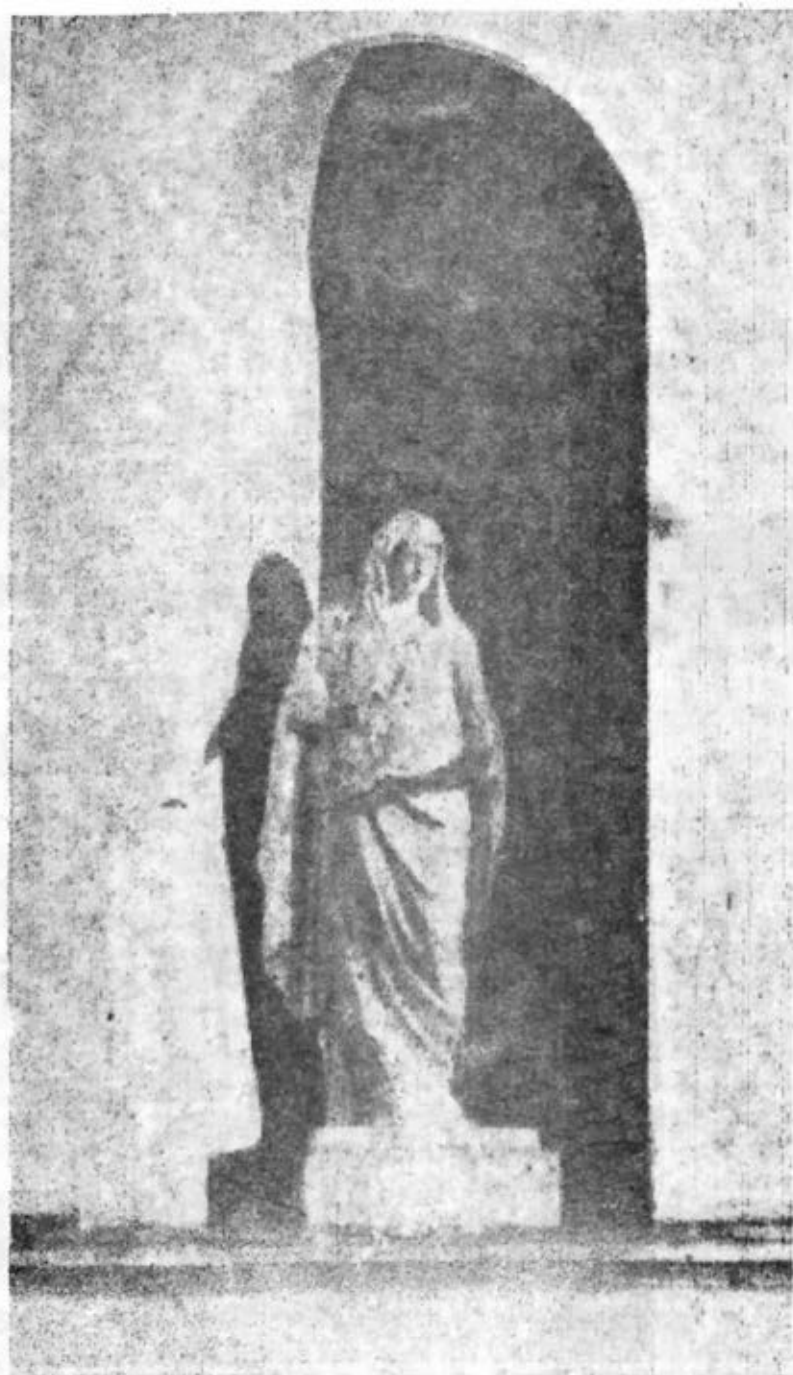
Рис. 2. Статуя св. мученицы в нише северного фасада Димитриевского храма