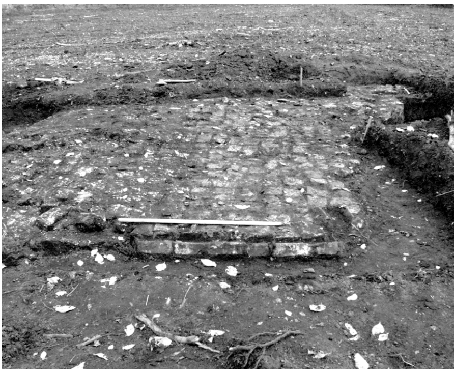
Ил. 4. Общий вид мощеной площадки в центре исследованного участка..