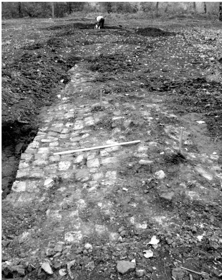
Ил. 2. Участок мощеной дороги в западной части участка застройки.