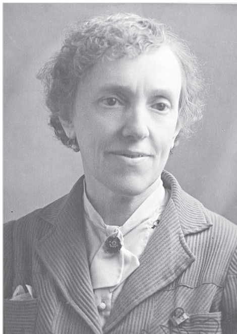
Ил. 6. Е. А. Бекман-Шербина. Москва, июль 1944 г. Из собрания Российского национального музея музыки (Ф. 492. № 1320)