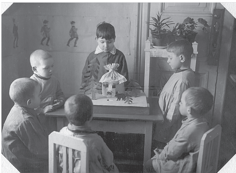
Свободные занятия. Макет сказки «Теремок».