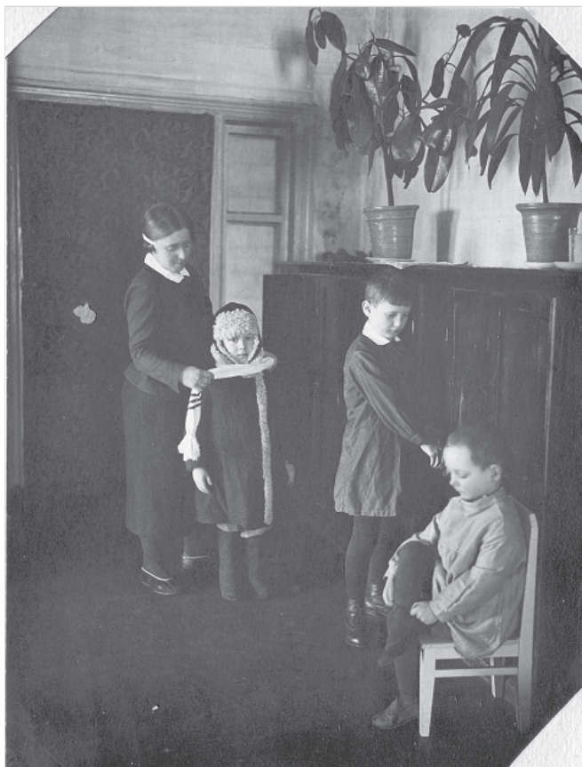
Приход детей в д/с.