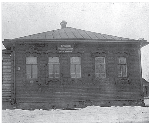
Д/сад в 1935 г.