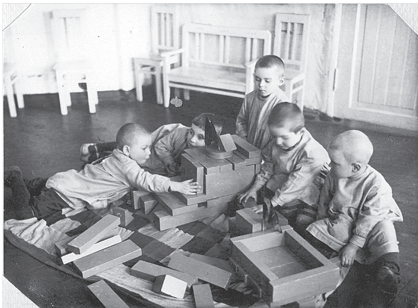
Свободные занятия. Игры младшей группы.