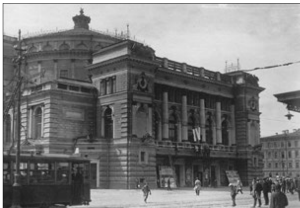
Государственный академический театр оперы и балета им. С. М. Кирова. 1930-е