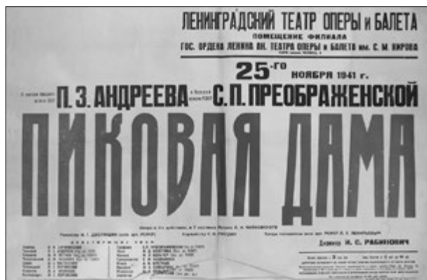
Афиша Кировского театра. 1941

нического оркестра (banda) Кировского театра, первоначально — на партии корнета.