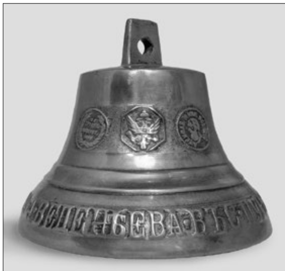
Колокольчик Ф. А. Веденева

кусство», шестигранное клеймо с гербом Российской империи и реверс медали, изображены рядом на одной стороне колокола.