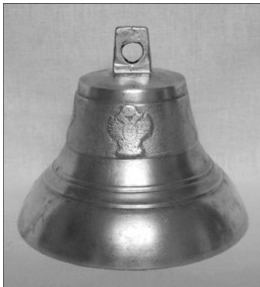
Колокольчик с изображением на тулове медали Гран-при Всемирной выставки в Турине—Риме 1911 г.