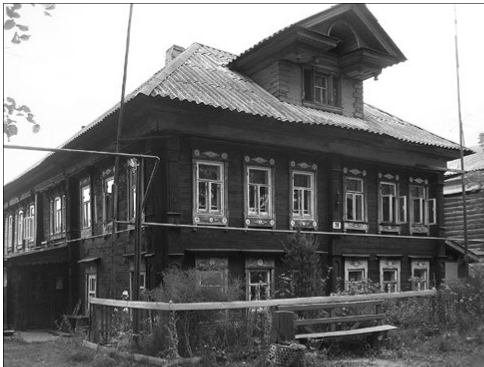
Дом Веденевых в с. Пурех. 2011

ством заведует сам владелец завода. Завод размещен в деревянном здании, вырабатывает в год 100 пудов бубенчиков и колокольчиков на 3000 руб. Работников 8, в том числе, 4 взрослых и 4 малолетних до 15 лет. Зарботная плата в месяц у мальчиков 2–3 руб., у взрослых 10–12 рублей. Продолжительность рабочего дня 13 часов. В год потребляется 20 пуд. олова и 100 пуд. меди. Станков два, горнов один. Завод работает круглый год. Сбыт товаров в Москве, Нижегородской ярмарке, Туле 23 .