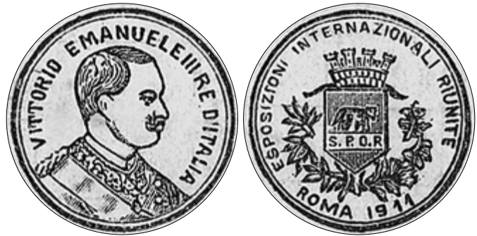
Увеличенный знак Гран-при и золотая медаль Всемирной выставки в Турине—Риме 1911 г. на рекламе завода П. Г. Чернигина. На аверсе изображен итальянский король с надписью по кругу: «VITTORIO EMANUELE III RE D'ITALIA» («Виктор Эмануил III король Италии»), на реверсе герб Рима и надпись по кругу: «ESPOSIZIONI INTERNAZIONALI RIUNITE | ROMA 1911» («Международная выставка, посвященная объединению Италии. Рим 1911»)

Нижегородские колокольчики, по всей видимости, были представлены на выставке в составе земской экспозиции, поэтому их изготовитель не указан в обзорах выставки.