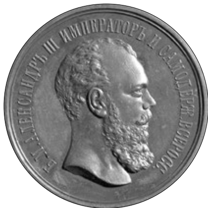
Медаль Министерства финансов «За трудолюбие и искусство».

На аверсе портрет императора Александра III, обращенный вправо, и надпись по кругу: «Б.М.АЛЕКСАНДРЪ III ИМПЕРАТОРЪ И САМОДЕРЖ.ВСЕРОСС.».