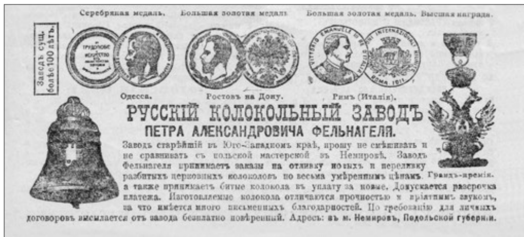
Реклама завода П. А. Фельнагеля