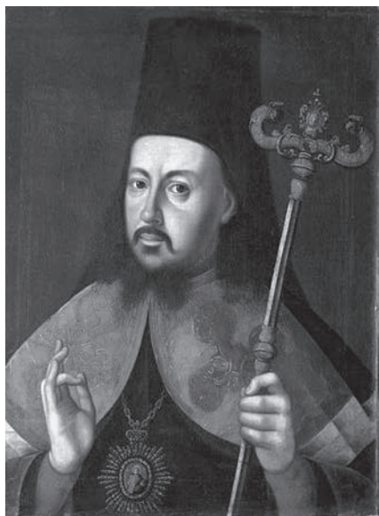
Ил. 3. Лужников Н. С. Портрет архиепископа Ростовского и Ярославского Арсения (Верещагина). 1786. Холст, масло. ГМЗРК. Ж-121