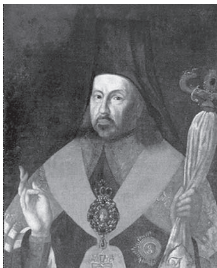
Ил. 8. Неизвестный художник. Портрет архиепископа Арсения (Верещагина). Конец XVIII в. Холст, масло. ЯГИАХМЗ