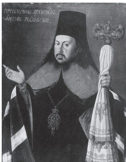
Ил. 5. Лужников Н.С. Портрет архиепископа Ростовского и Ярославского Арсения (Верещагина). 1785. Холст, масло. ТОКГ. Ж-824