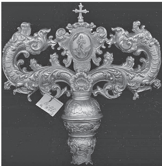
Ил. 9. Навершие жезла. XVIII в. Серебро, литые, канфарение, позолота, эмаль. ГМЗРК. Дм-515