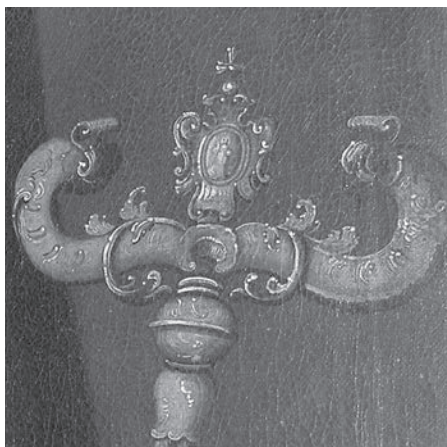
Ил. 4. Лужников Н. С. Портрет архиепископа Ростовского и Ярославского Арсения (Верещагина). 1786. Холст, масло. ГМЗРК. Ж-121. Фрагмент