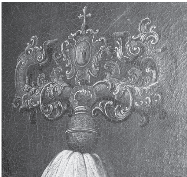
Ил. 10. Неизвестный художник. Портрет архиепископа Ростовского и Ярославского Самуила (Миславского). Конец XVIII в. Холст, масло. ГМЗРК. Ж-277. Фрагмент