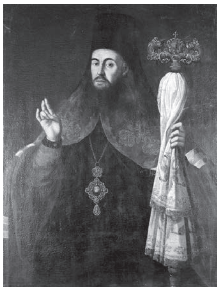
Ил. 1. Неизвестный художник. Портрет архиепископа Ростовского и Ярославского Самуила (Миславского). Конец XVIII в. Холст, масло. ГМЗРК. Ж-277