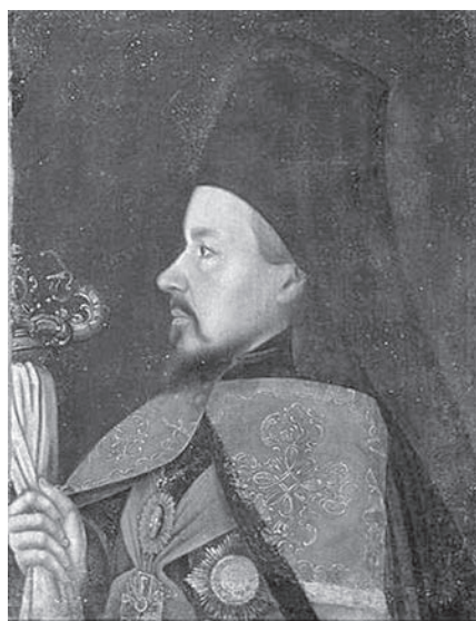
Ил. 6. Горячев Н.М. Портрет архиепископа Ростовского и Ярославского Арсения (Верещагина). 1797. Холст, масло. ТОКГ. Ж-890