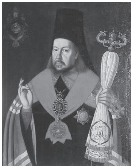
Ил. 7. Неизвестный художник. Портрет архиепископа Арсения (Верещагина). 1798. Холст, масло. РГИАХМЗ