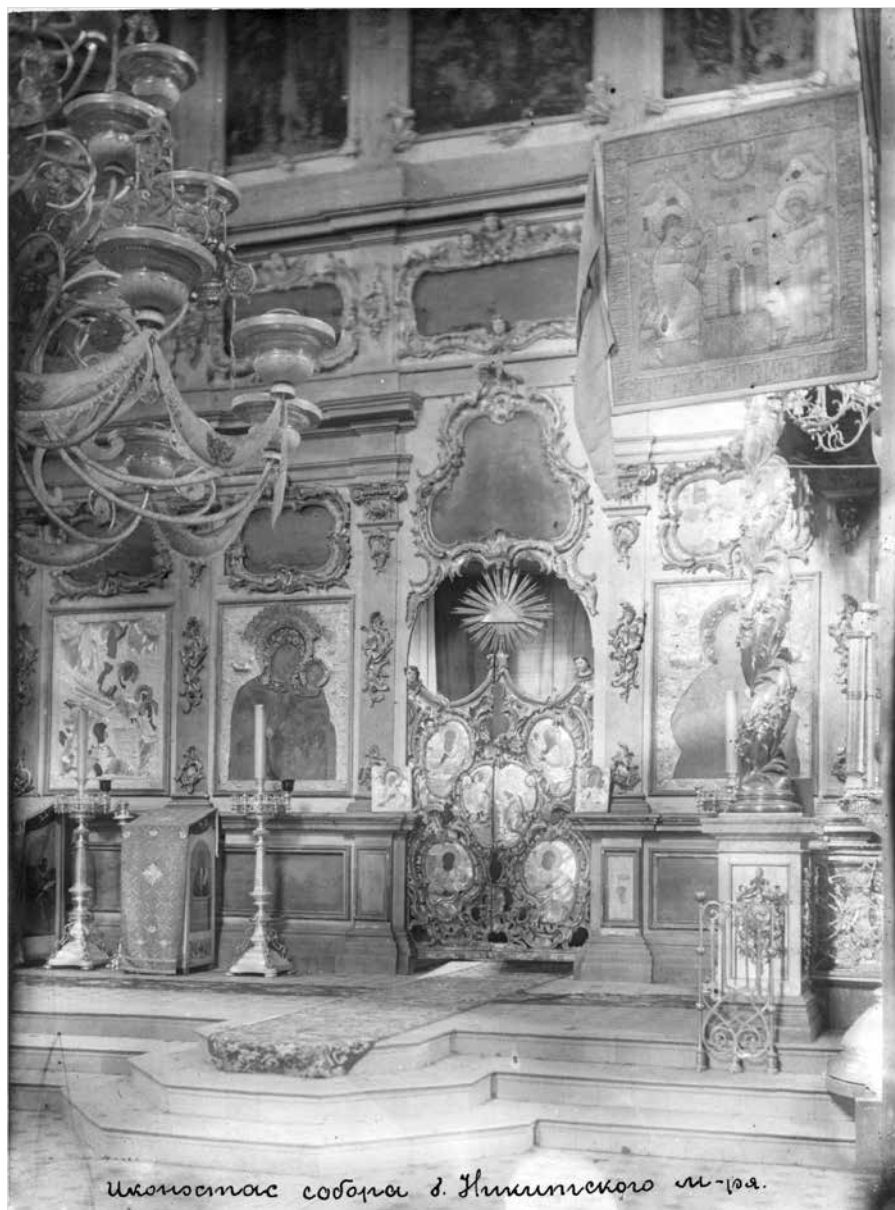
Ил. 3. Иконостас Никитского собора Переславского Никитского монастыря. Фото конца XIX – начала XX в.