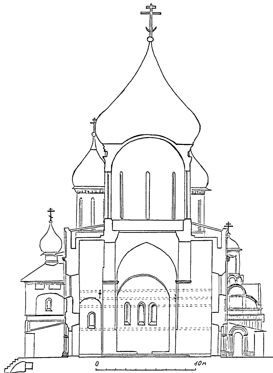
Ил. 2. Поперечный разрез Никитского собора Переславского Никитского монастыря. Пунктирными линиями представлена схематическая реконструкция первоначального иконостаса 1564 г., выполненная А.Г. Мельником по данным натурных исследований