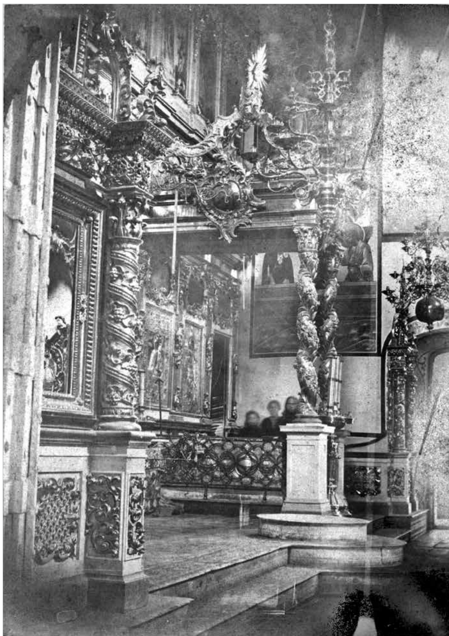
Ил. 4. Иконостас Никитского собора Переславского Никитского монастыря и гробница св. Никиты Столпника Переславского. Фото 1930 г. ? Переславль-Залесский государственный историко-архитектурный и художественный музей-заповедник