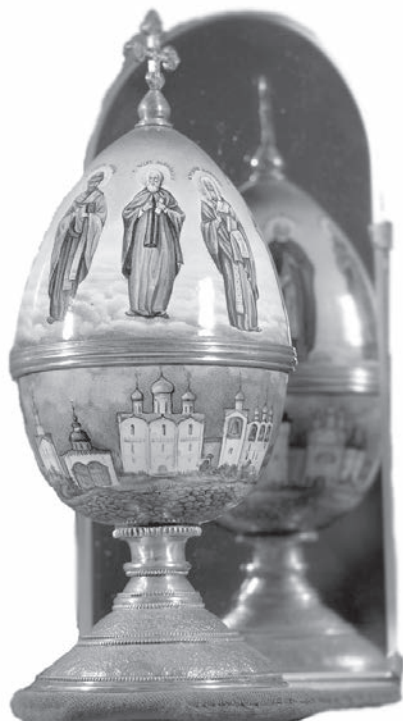
Ил. 1. Л.Д. Самонова Пасхальное яйцо «Ростовские чудотворцы». 2000. Ювелир Н.Н. Мишин