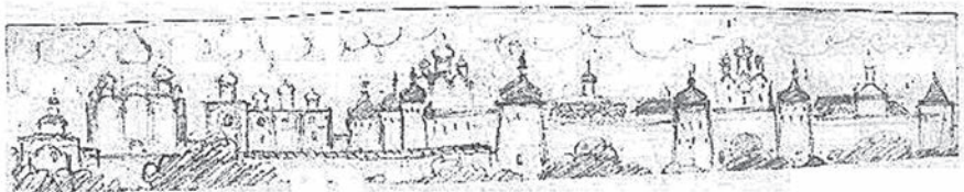
Ил. 2. Л.Д. Самонова. Эскиз к пасхальному яйцу «Ростовские чудотворцы». 1997.