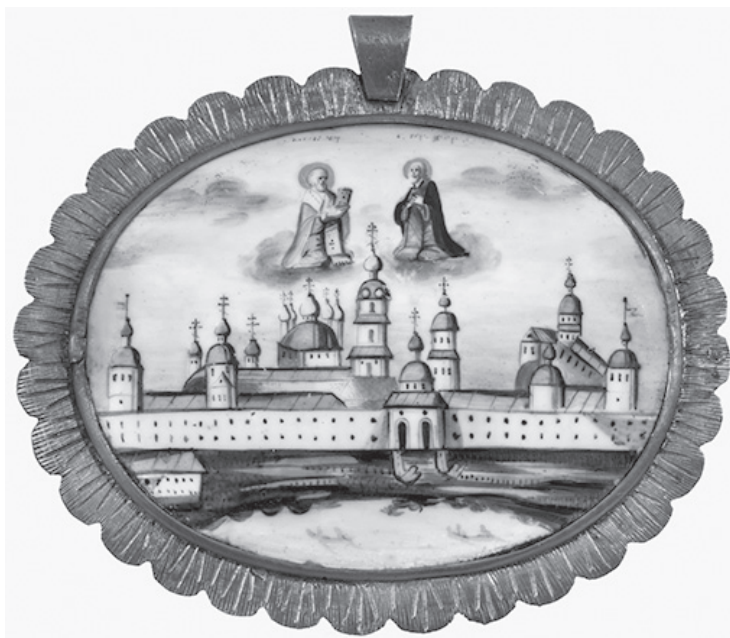
Ил. 1. Вид Николо-Бабаевского монастыря со святыми Николаем Чудотворцем и Сергием Радонежским. ГМЗРК. Инв. Ф-1608