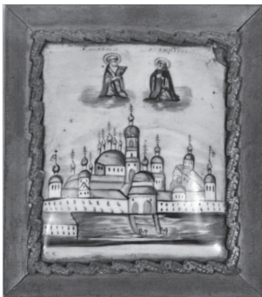
Ил. 2. Вид Николо-Бабаевского монастыря со святыми Николаем Чудотворцем и Сергием Радонежским. Тихвинский историко-художественный и мемориальный музей. № по ГИК (КП) ТМ КП-1606