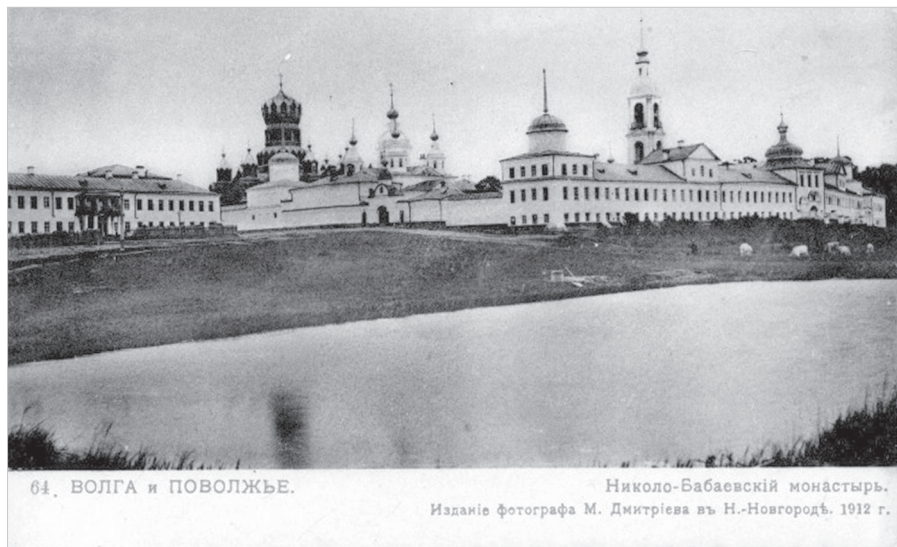
Ил. 6. Открытка, изд. М. Дмитриева, 1912 г. Волга и Поволжье. Николо-Бабаевский монастырь. ГМЗРК. ФТ-4188