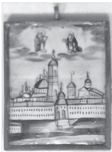
Ил. 3. Вид Николо-Бабаевского монастыря со святыми Николаем Чудотворцем и Сергием Радонежским. Череповецкое музейное объединение. № по ГИК (КП) ЧерМО-1306/25