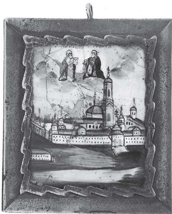
Ил. 5. Вид Николо-Бабаевского монастыря [со святыми Николаем Чудотворцем и Сергием Радонежским]. Фото из: Тысяча лет русского паломничества: каталог выставки. М., 2009. С. 324 (кат. 951)