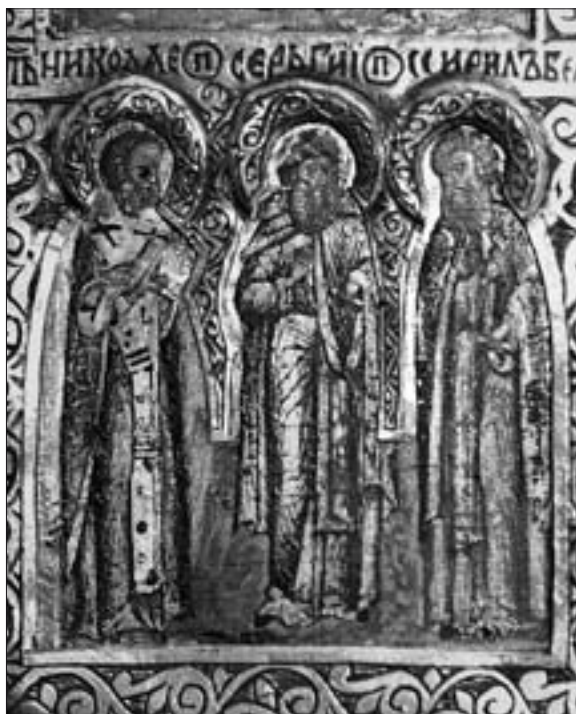
Ил. 11. Изображение Сергия Радонежского на четырехконечном кресте. Начало XVII в. (КБМЗ)

В Кирилло-Белозерском музее имеется другой более массивный и несколько других пропорций четырехконечный крест, украшенный серебряным чеканным окладом, выполненный по образцу креста рассмотренного выше, но на столетие позже — в начале XVII в. (КБМЗ) (ил. 10). В нижней его части — в центре иконописные изображения преп. Сергия Радонежского, а по сторонам — Николая Чудотворца и Кирилла Белозерского (ил. 11). Преп. Сергий здесь изображен со свитком,верху на окладе гравирована надпись: «П[РЕПОДОБНЫЙ] СЕРГИИ». Именующие надписи вырезаны также и над другими изображениями святых.