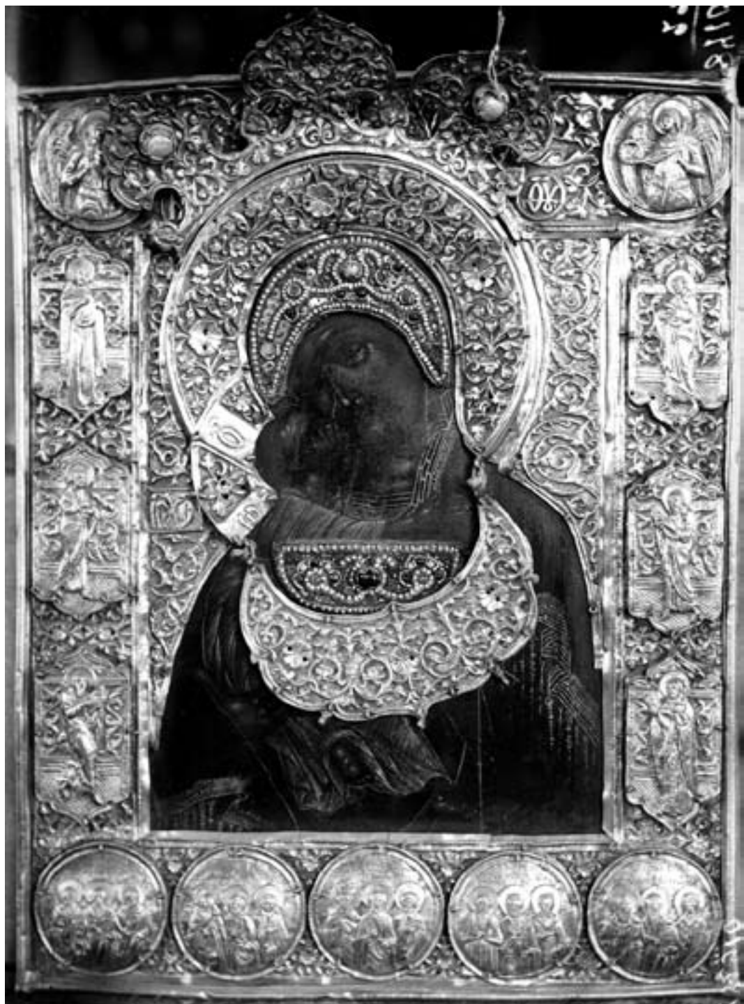
Ил. 14. Икона «Богоматерь Владимирская» в серебряном окладе. Архивная фотография