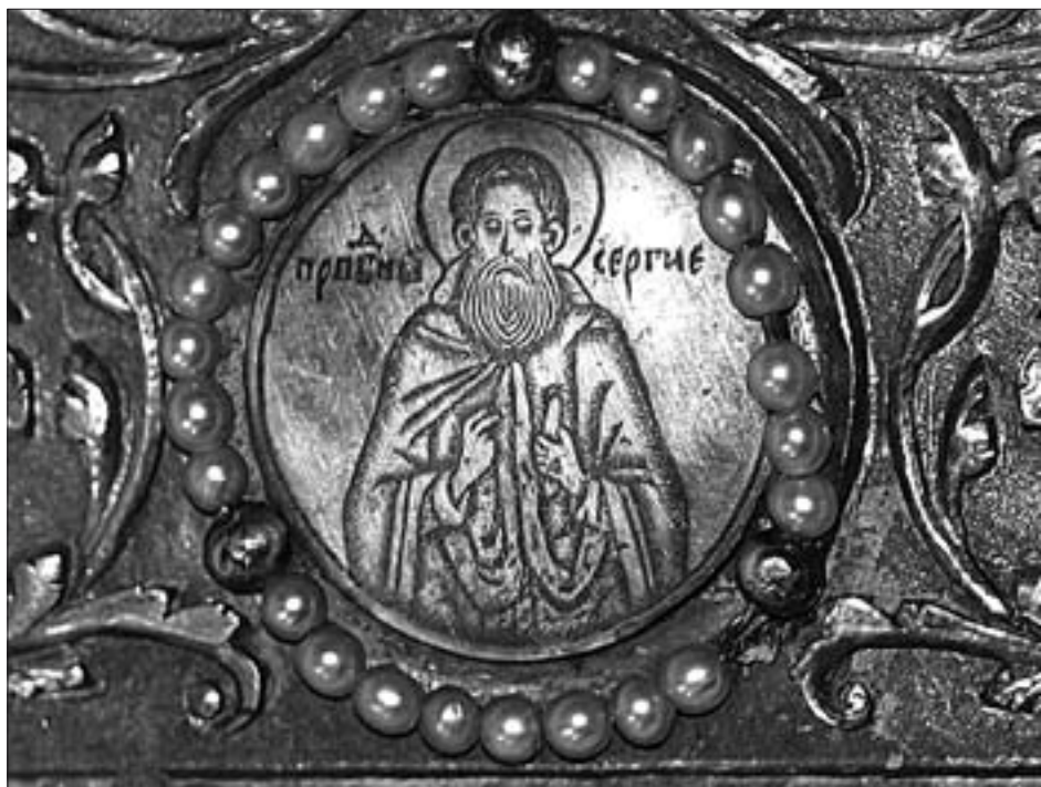
Ил. 8. Изображение Сергия Радонежского на окладе Евангелия из ростовского Успенского собора (РГБ)

На окладе из Российской библиотеки св. Сергий изображен в мантии, без свитка, с остроконечной бородой и с круглым выбритым на голове гуменцом (тонзурой) — знаком пострижения в «чин иноческий» (ил. 7). Правая кисть его руки сложена в двуперстие, а левая обращена ладонью к зрителю. Круглый венец святого вверху выходит за пределы круглой рамки, вырезанной из двух линий и обрамляющей изображение преподобного. Обильное наложение черни местами скрывает тонкий резной рисунок и штриховку. На круглой дробнице, крепящейся внизу в центре на верхней крышке Евангелия, по сторонам поясного изображения святого гравировано: «ПР(Д)БН СЕРГИЕ».