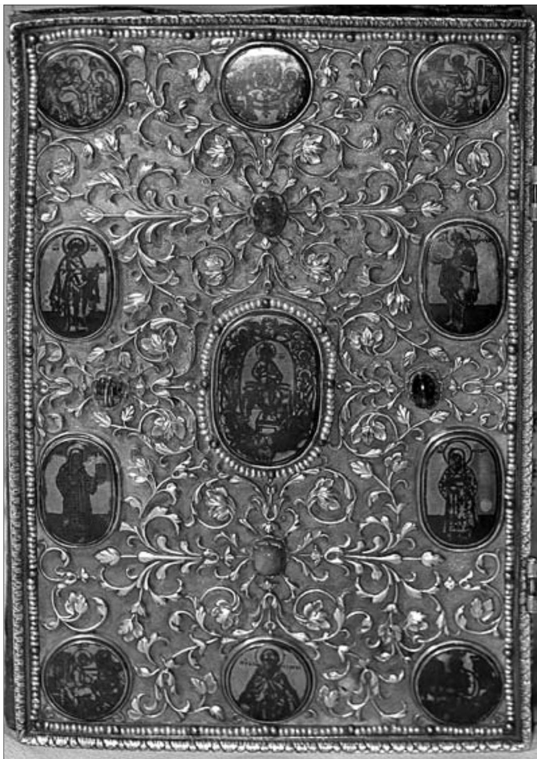
Ил. 5. Серебряный оклад Евангелия из Троице-Сергиева монастыря. Вторая четверть XVI в. (РГБ)