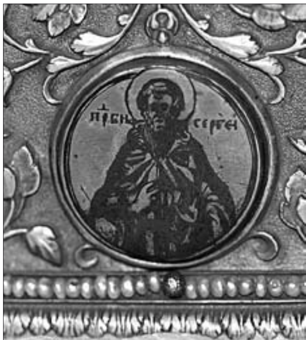
Ил. 7. Изображение Сергия Радонежского на окладе Евангелия из Троице-Сергиева монастыря (РГБ)