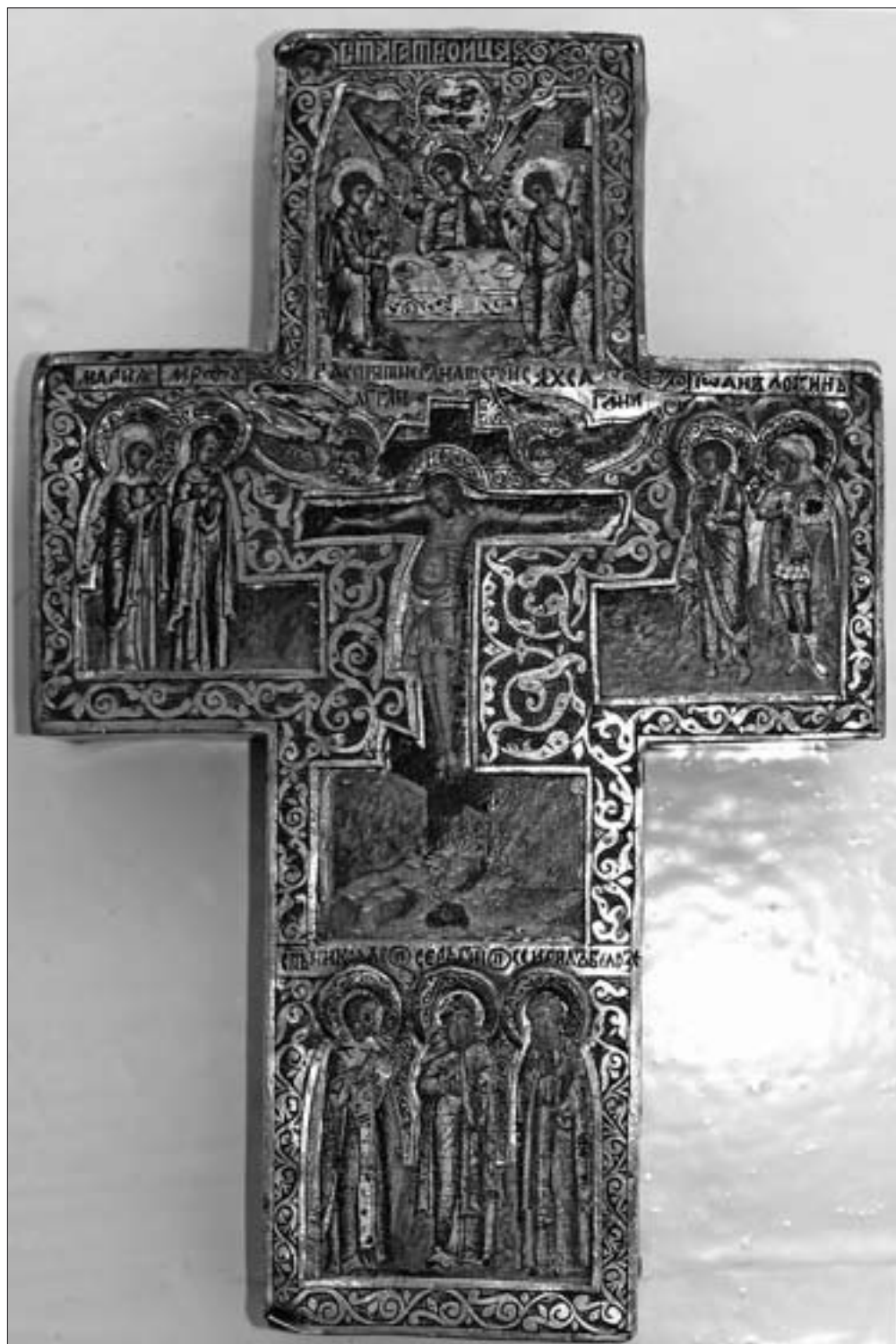
Ил. 10. Крест четырехконечный в серебряном окладе. Начало XVII в. (КБМЗ)