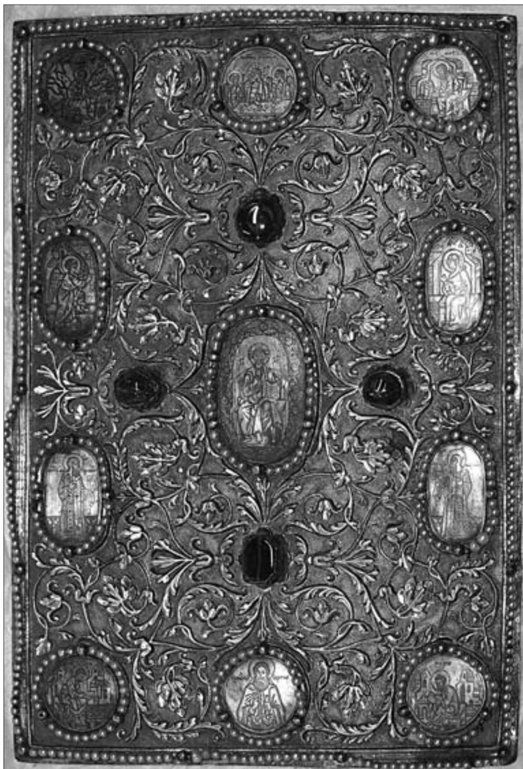
Ил. 6. Серебряный оклад Евангелия из ростовского Успенского собора. Вторая четверть XVI в. Москва (ГМРК)