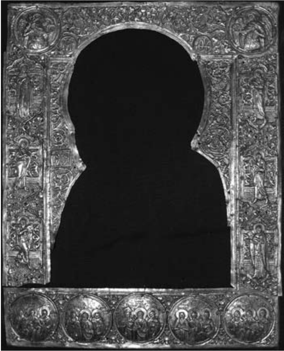
Ил. 13. Общий вид серебряного оклада иконы «Богоматерь Владимирская» (АМНИ)

нитых людей Строгановых и имеются в собрании Сольвычегодского музея.