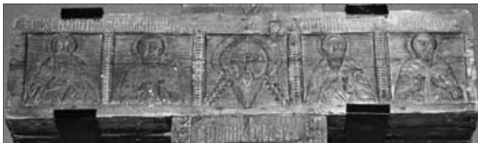
Ил. 2. Резные изображения святых на верхней перекладине поклонного креста Саввы Вишерского (НГМ)

правило, ставились на возвышенности и обкладывались камнями, олицетворяя Голгофский крест. Они всегда были ориентированы на восток и на протяжении нескольких столетий часто встречались на обширной территории России, являясь обычной частью пейзажа.