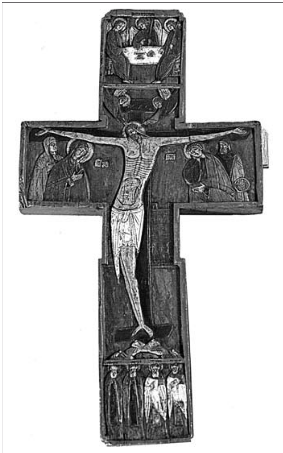
Ил. 9. Крест четырехконечный из Кирилло-Белозерского монастыря. Начало XVI в. (КБМЗ)