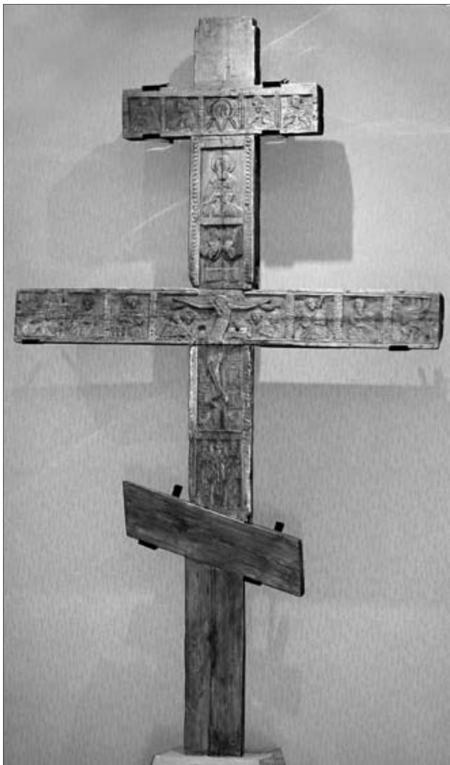
Ил. 1. Поклонный деревянный крест Саввы Вишерского. Новгород. Деревянная основа — 1417 г. Резные изображения и надписи — конец XV — начало XVI вв. (НГМ)