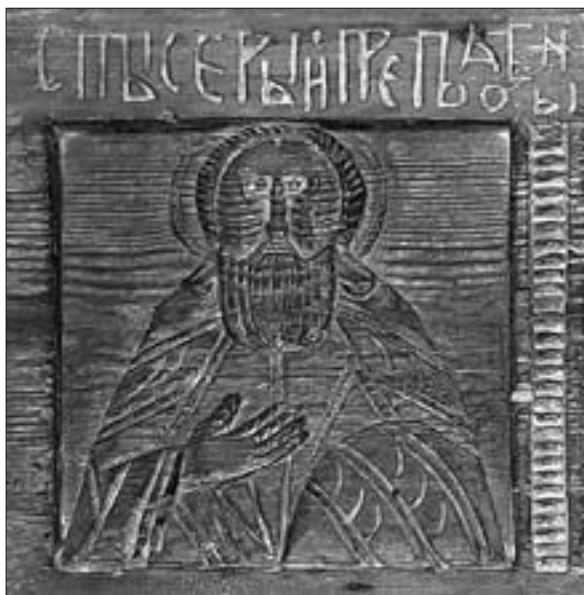
Ил. 3. Резное изображение Сергия Радонежского на деревянном кресте Саввы Вишерского (НГМ)

Однако в Великом Новгороде уже в 30-е гг. XVI в., а возможно, и ранее было установлено почитание преп. Сергия Радонежского. В 1530-е гг. в новгородском Сплавском монастыре (Симеоновском Сплавском («На плаве», на Ивангородской дороге) имела трапезная церковь во имя Сергия Радонежского, которая впервые упоминается в Поженных книгах 1535/1536 гг.: «Монастырские Симеона Богоприимца и Сергия