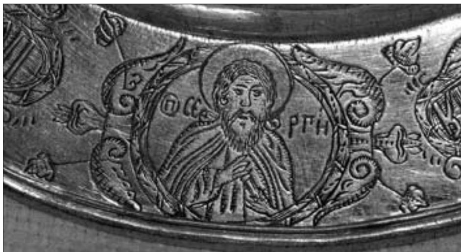
Ил. 16. Фрагмент серебряной дорной тарели 1694 г. из Спасо-Преображенского Пыскорского монастыря (ПермГХГ)

По борту тарели крестообразно расположены в картушах изображения преподобных соловецких чудотворцев Зосимы и Савватия, а также — Саваофа. На дне тарели гравировано изображение «Богоматерь Знамение». Ранее это произведение серебряного дела предположительно датировалось XVII в. 42