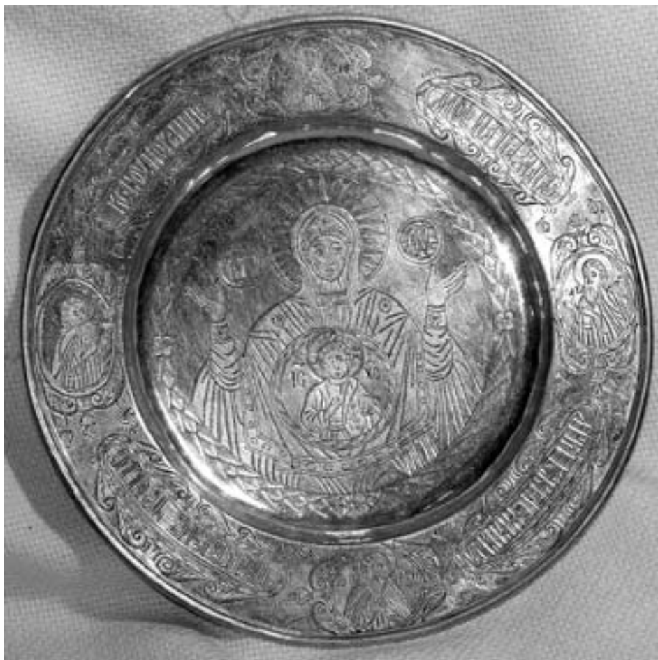
Ил. 15. Общий вид серебряной дорной тарели 1694 г. из Спасо-Преображенского Пыскорского монастыря (ПермГХГ)

Серебряные дорные тарели с изображениями святых по борту встречаются крайне редко. К подобным предметам, например, относится поясное изображение преп. Сергия со свитком, гравированное в центре внизу по борту серебряной дорной тарели, происходящей из Спасо-Преображенского Пыскорского монастыря (ПермГХГ, инв. № 23) 41 (ил. 15). По сторонам изображения святого, помещенного в овальную рамку-картуш, вырезана надпись: «П[РЕПОДОБНЫЙ] СЕРГИ» (ил. 16).