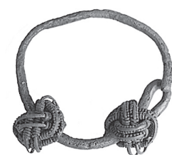
Рис. Височное кольцо из кургана № 6 у с. Любилки, XI–XII вв.

Н.Г. Самойлович отметила, что предметы, найденные в кургане № 6, датируются широко (с X по XIII в.) и не могут служить хронологическими признаками. Но среди них выделяется кольцо с двумя бронзовыми плетёными (узелковыми) бусинами. Аналогичные найдены в курганном могильнике г. Суздаль (XI - середина XII вв.), курганах второй половины XI–XII вв. «земли вятичей», в двух курганах XI в. могильника у д. Избрижье в Тверском регионе. М.В. Седова привела и другие случаи находок подобных колец: Новгород (первая четверть XI в.), курган с монетой XI в. в Курской губернии. Таким образом, оснований для отнесения курганного могильника у с. Любилки к XIII–XIV вв. нет. Вблизи поселений второй половины XIII–XIV вв. в бассейне р. Вори в Подмосковье курганы отсутствуют. Сложно представить, что в 26 км от Ростова - старейшего центра христианизации Северо-Восточной Руси - в XIII–XIV вв. проживало население, сохранявшее курганный обряд погребения.