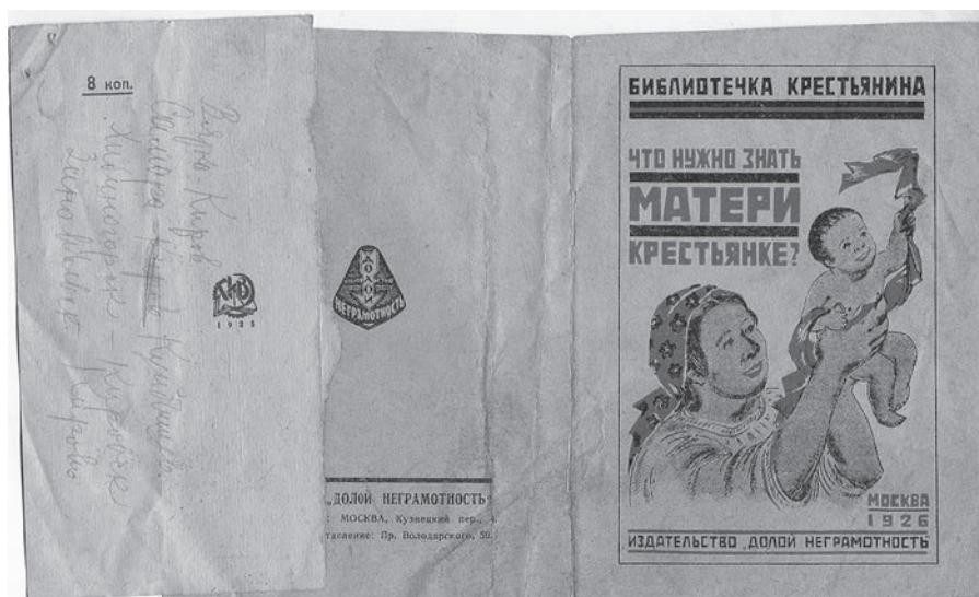
Ил. 2. Обложка кн.: Что нужно знать матери крестьянке?