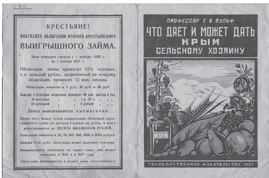
Ил. 5. Обложка книги: Профессор Е. В. Вульф. Что дает и может дать Крым сельскому хозяину