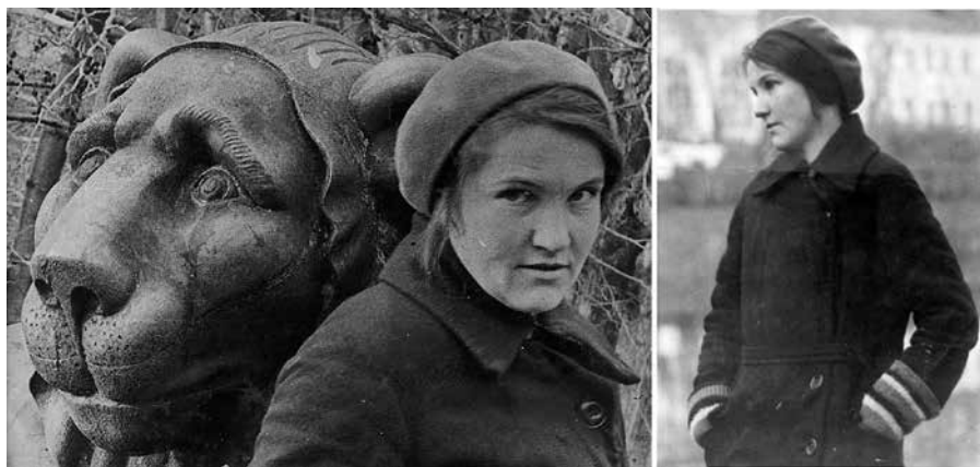
Ил. 6. В. А. Смылова. Москва, усадьба Кузьминки. Фото И. Сосфенова, 1929 г.