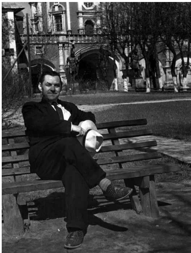
Ил. 5. В. Н. Иванов. Музей архитектуры. Донской монастырь.