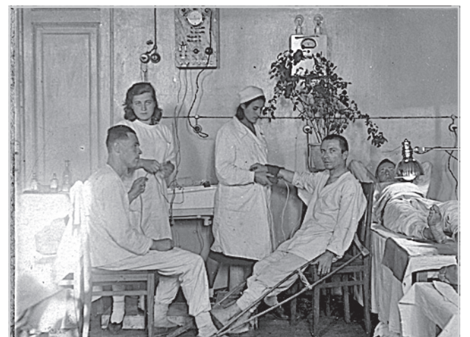
Детский антивоенный митинг на площади около Ростовского кремля; раненные в палатах Ростовского госпиталя.