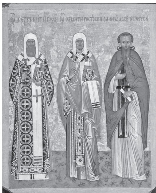
Ил. 8. Икона Петра митрополита, Леонтия Ростовского и Феодосия Печерского. Конец XV в. Государственная Третьяковская галерея