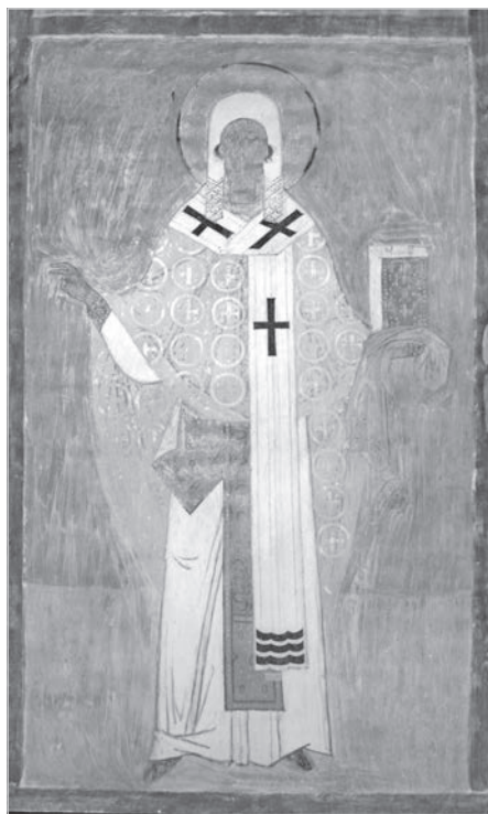
Ил. 1. Леонтий Ростовский. Фрагмент настенной росписи собора Рождества Богородицы Ферапонтова монастыря. 1502 г.