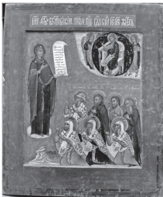
Ил. 7. Икона Богоматери Боголюбской в молении ростовских святых. Конец XVI – начало XVII в. Государственный Русский музей