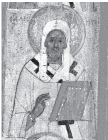
Ил. 2. Леонтий Ростовский. Фрагмент иконы Богоматери Одигитрии с избранными святыми. Конец XV в. Ярославский художественный музей