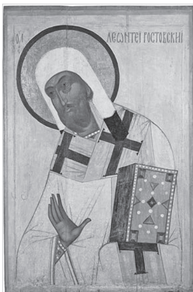
Ил. 4. Леонтий Ростовский. Икона из деисусного чина иконостаса церкви Димитрия Солунского села Поникарова близ Ростова. Начало XVI в. Государственный музей-заповедник «Ростовский кремль»