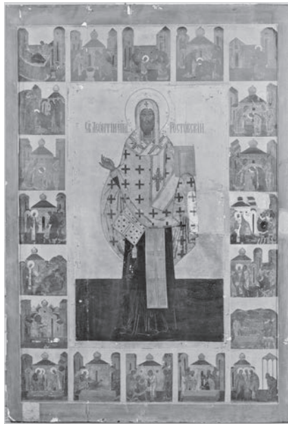
Ил. 5. Икона Леонтия Ростовского в житии. Вторая половина XVI в. Под записью. Вологодский государственный историко-архитектурный и художественный музей-заповедник