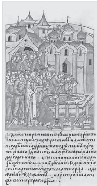
Ил. 6. Установка по велению князя Андрея Боголюбского раки с мощами св. Леонтия в ростовском Успенском соборе и устройство при ней великих свечей. Фрагмент житийного цикла Леонтия Ростовского в Лицевом летописном своде. 60–70-е гг. XVI в.