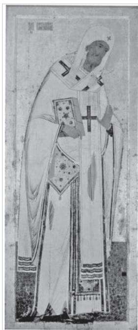
Ил. 3. Леонтий Ростовский. Икона из деисусного чина иконостаса Успенского собора Кирилло-Белозерского монастыря. Около 1497 г. Кирилло-Белозерский историко-архитектурный и художественный музей-заповедник