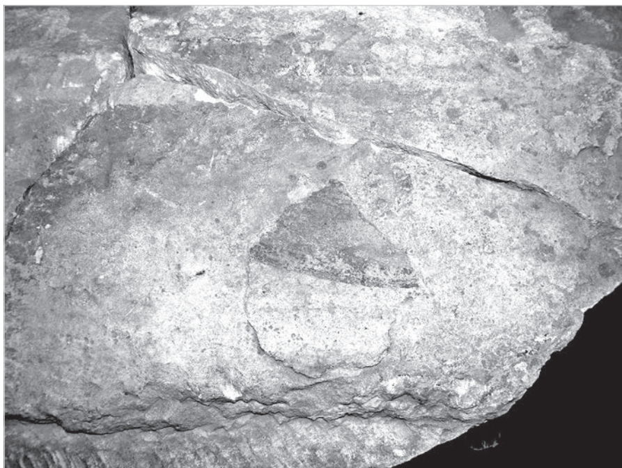
Ил. 11. Фрагмент нимба Леонтия Ростовского. Фреска на крышке раки для мощей этого святого. Между 1160-ми гг. и XVI в. Государственный музей-заповедник «Ростовский кремль»