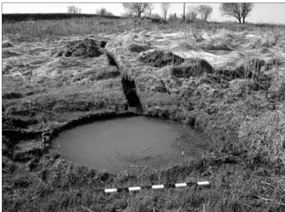
Ил. 2. Производственная зона солеваренного промысла: 1 — отходы солеваренного промысла; 2 — колодец, 2008