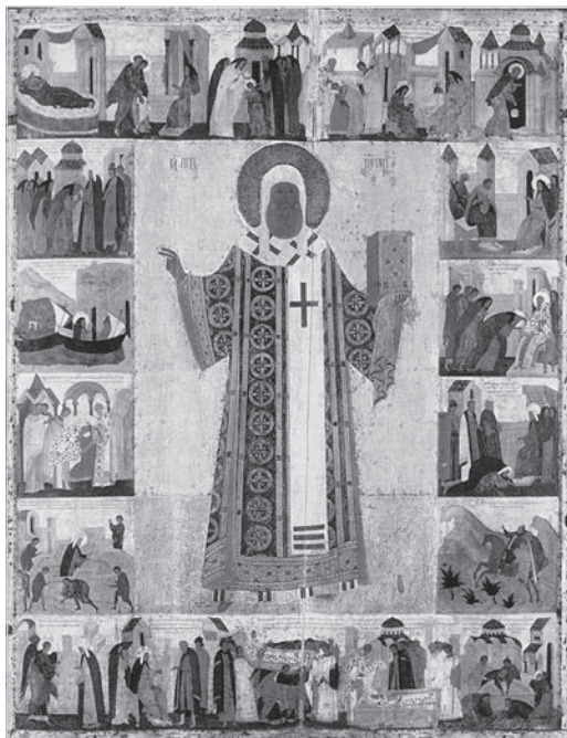
Ил. 5. Икона Петра митрополита в житии. Конец XV в. Государственный историко-культурный музей-заповедник «Московский Кремль»