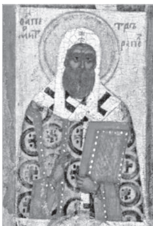
Ил. 1. Петр митрополит. Фрагмент иконы Богоматери Одигитрии с избранными святыми. Конец XV в. Ярославский художественный музей