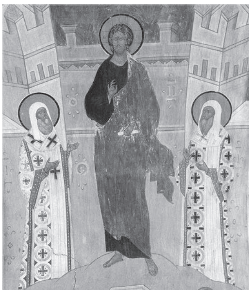
Ил. 6. Иисус Христос в молитве митрополитов Петра и Алексея. Фрагмент настенной росписи собора Рождества Богородицы Ферапонтова монастыря. 1502 г.