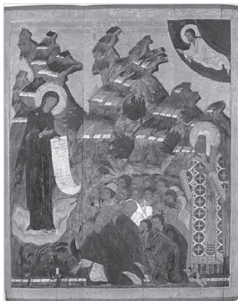
Ил. 7. Икона Богоматери Боголюбской в молении народа и Петра митрополита. XVI в. Вологодский государственный историко-архитектурный и художественный музей-заповедник