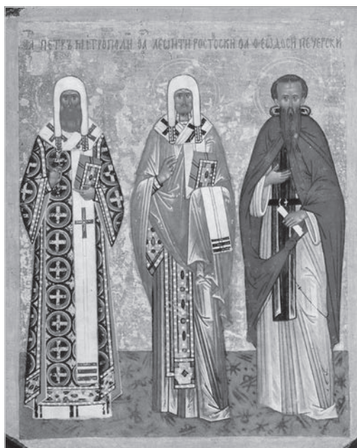
Ил. 8. Икона Петра митрополита, Леонтия Ростовского и Феодосия Печерского. Конец XV в. Государственная Третьяковская галерея