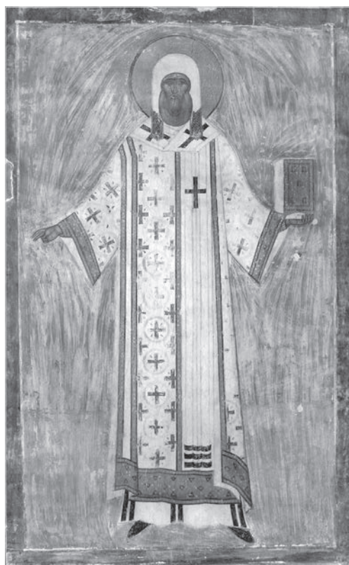
Ил. 2. Петр митрополит. Фрагмент настенной росписи собора Рождества Богородицы Феропонтова монастыря. 1502 г.