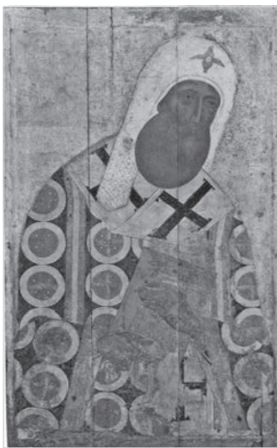
Ил. 3. Икона Петра митрополита из деисусного чина. Последняя четверть XV в. Государственная Третьяковская галерея