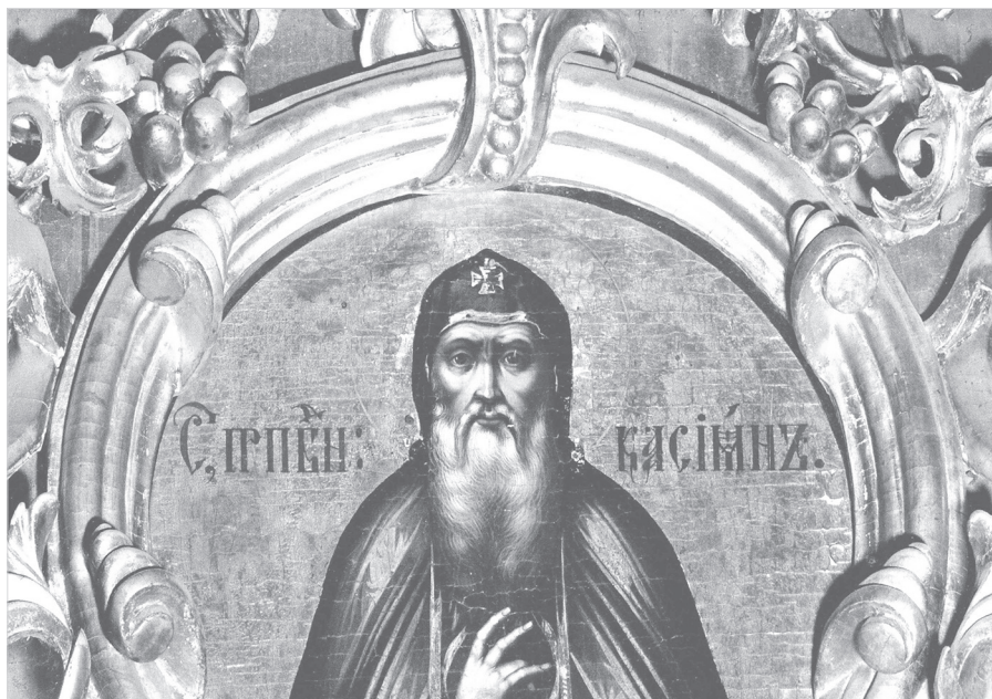
Ил. 1. Преподобный Кассиан Учемский. Образ из иконостаса Спасо-Преображенского собора Углича