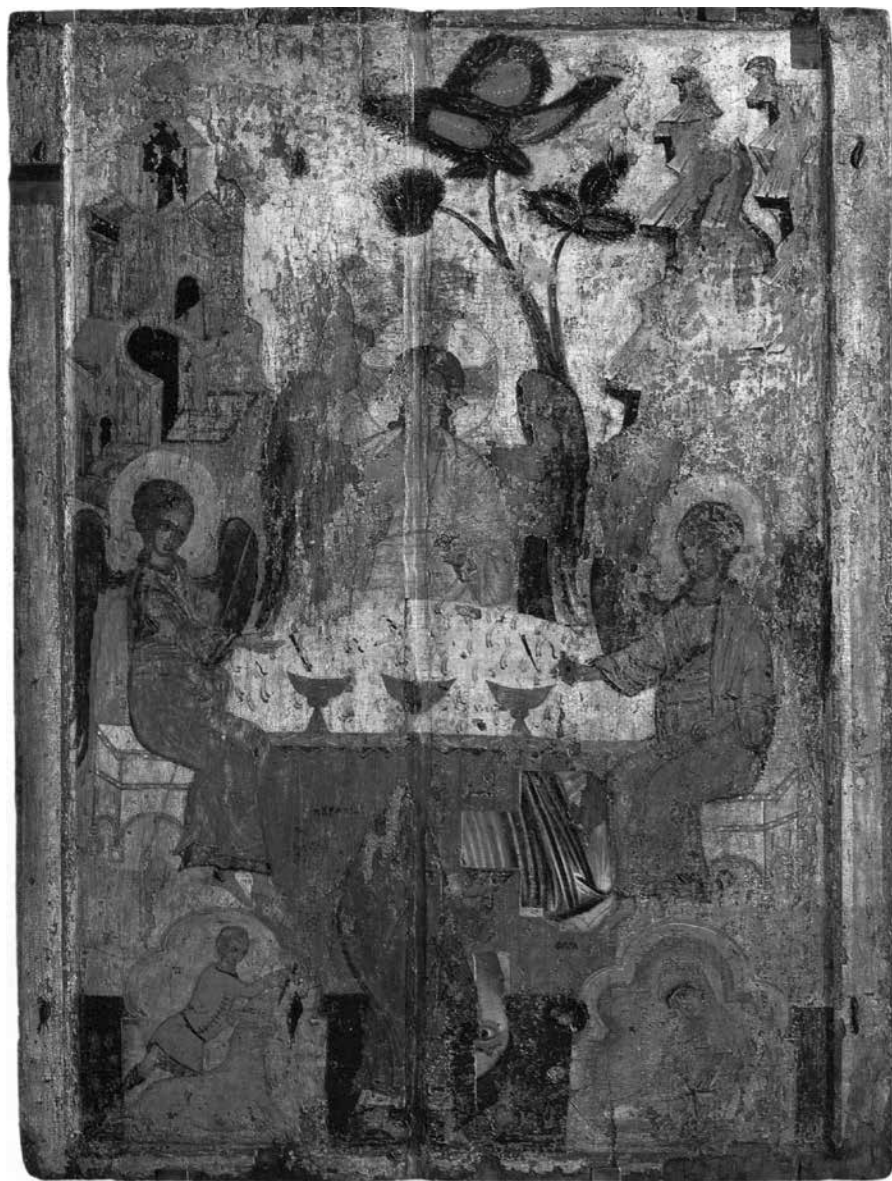
Ил. 10. Икона «Троица ветхозаветная». ГТГ