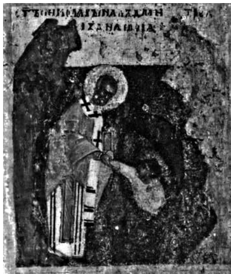
Ил. 5. Клеймо иконы «Никола Чудотворец, Леонтий и Игнатий Ростовские с житием Николы». ГТГ