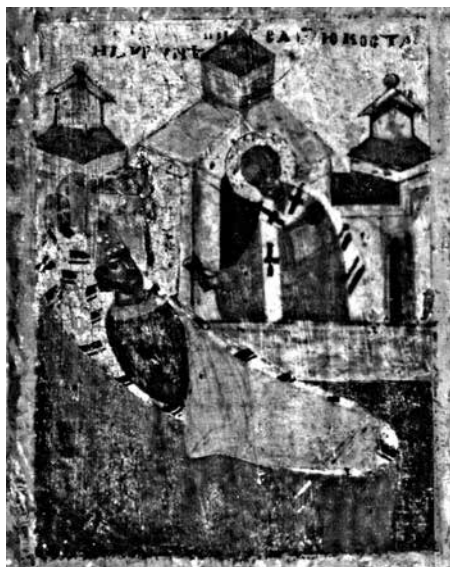
Ил. 3. Клеймо иконы «Никола Чудотворец, Леонтий и Игнатий Ростовские с житием Николы». ГТГ