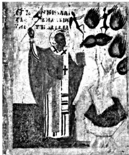
Ил. 7. Клеймо иконы «Никола Чудотворец, Леонтий и Игнатий Ростовские с житием Николы». ГТГ