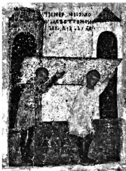
Ил. 9. Клеймо иконы «Никола Чудотворец, Леонтий и Игнатий Ростовские с житием Николы». ГТГ