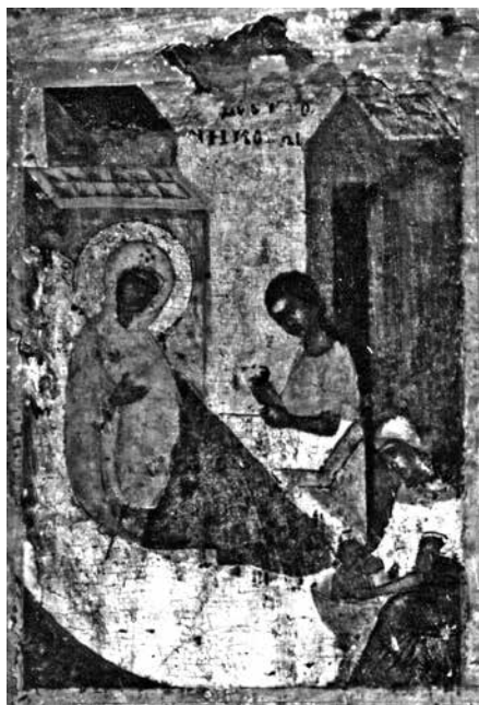
Ил. 2. Клеймо иконы «Никола Чудотворец, Леонтий и Игнатий Ростовские с житием Николы». ГТГ