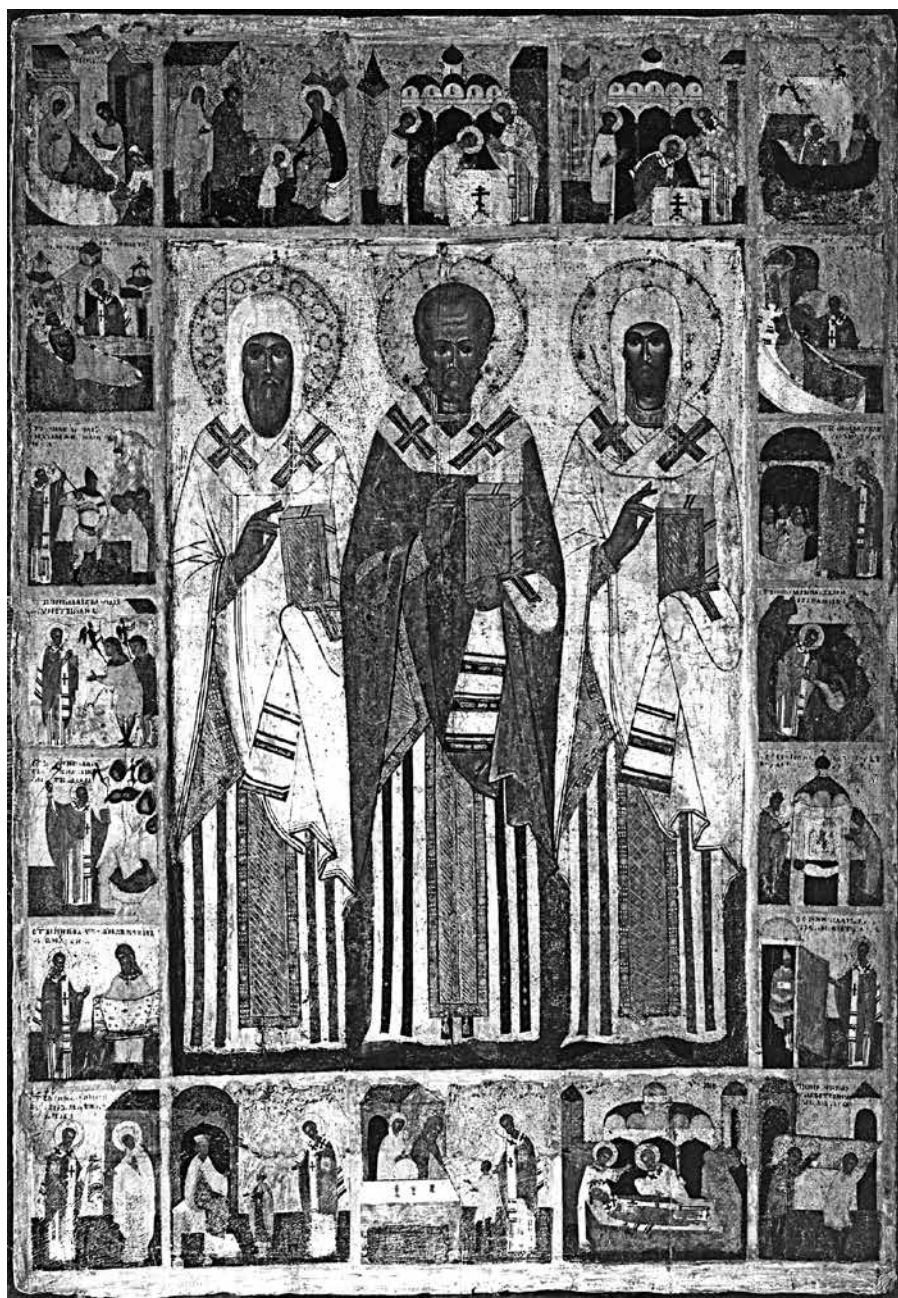
Ил. 1. Икона «Никола Чудотворец, Леонтий и Игнатий Ростовские с житием Николы». ГТГ