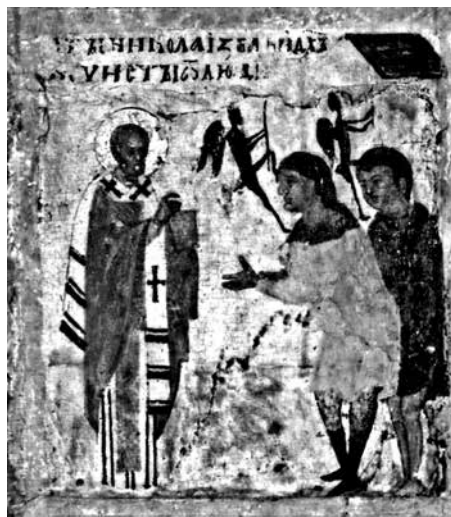
Ил. 6. Клеймо иконы «Никола Чудотворец, Леонтий и Игнатий Ростовские с житием Николы». ГТГ