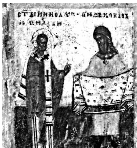
Ил. 8. Клеймо иконы «Никола Чудотворец, Леонтий и Игнатий Ростовские с житием Николы». ГТГ