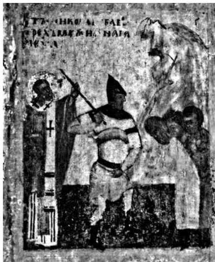
Ил. 4. Клеймо иконы «Никола Чудотворец, Леонтий и Игнатий Ростовские с житием Николы». ГТГ