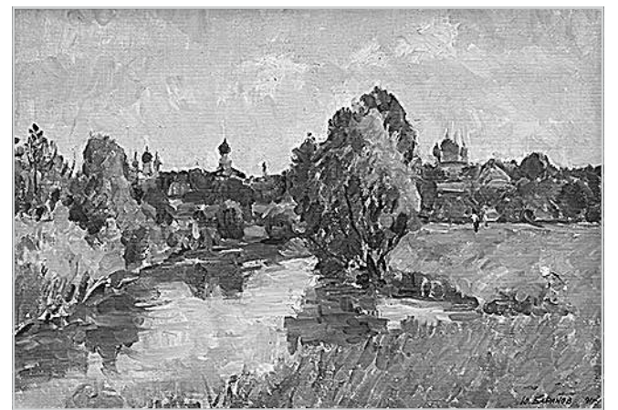
Ил. 5. Борисоглеб. Холст, масло. 1991