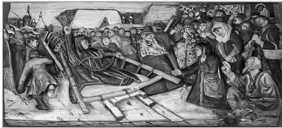
Ил. 2. Алексей Пичугин. Панно «Боярыня Морозова». 1977