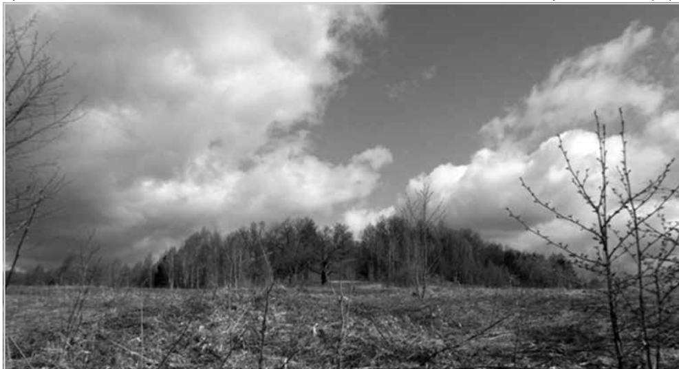
Ил. 1. Вид на Акуловское городище.