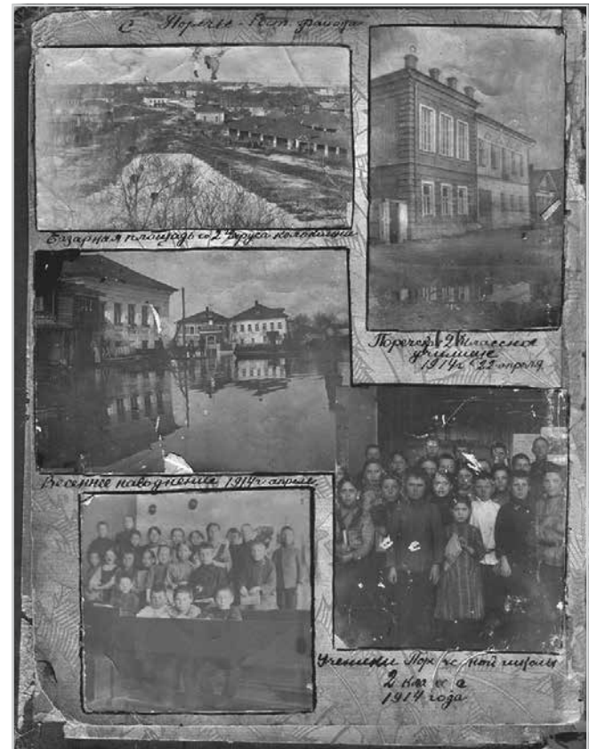
Ил. 3. Страница альбома Н.А. Бычкова с фотографиями видов и событий села Поречья