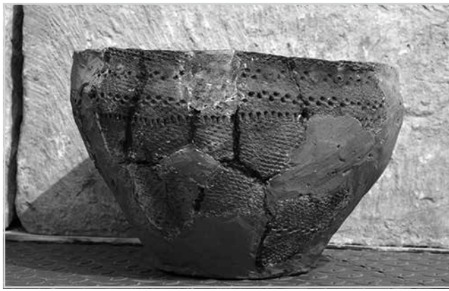
Ил. 2. Лепной сосуд дьяковской культуры в собрании ГМЗРК. Конец I тысячелетия до н.э. – начало I тысячелетия н.э.

О характере укреплений Акуловского городища мы, к сожалению, судить не можем. Причина этого в очень слабой изученности данного памятника. Несколько поколений археологов, посещавших древнюю крепость, ограничивались лишь сбором подъемного материала (немногочисленных находок,