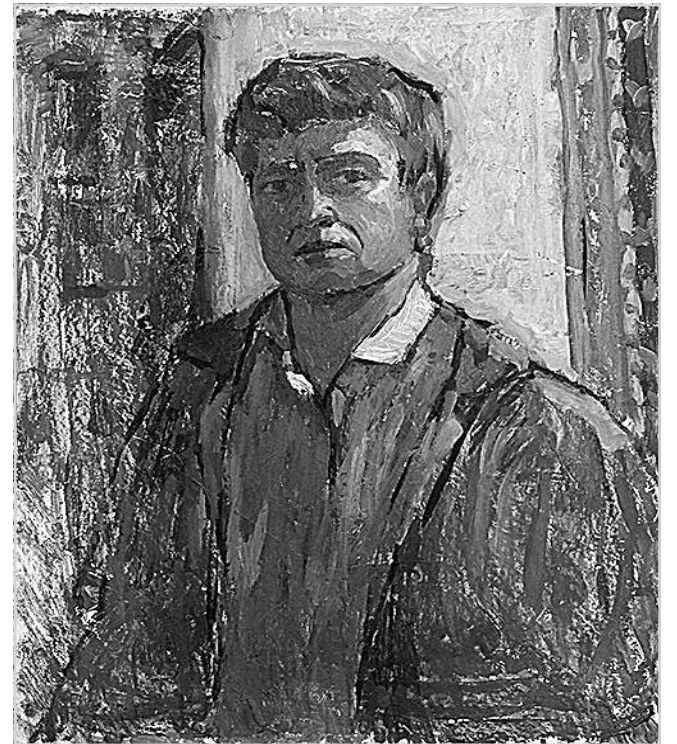
Ил. 4. Автопортрет. Картон, масло. 1980-е