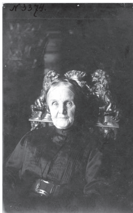
Ил. 12. П. С. Уварова. 1916 г.