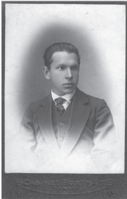
Ил. 2. Портрет Владимира Жадина. 1914 г.