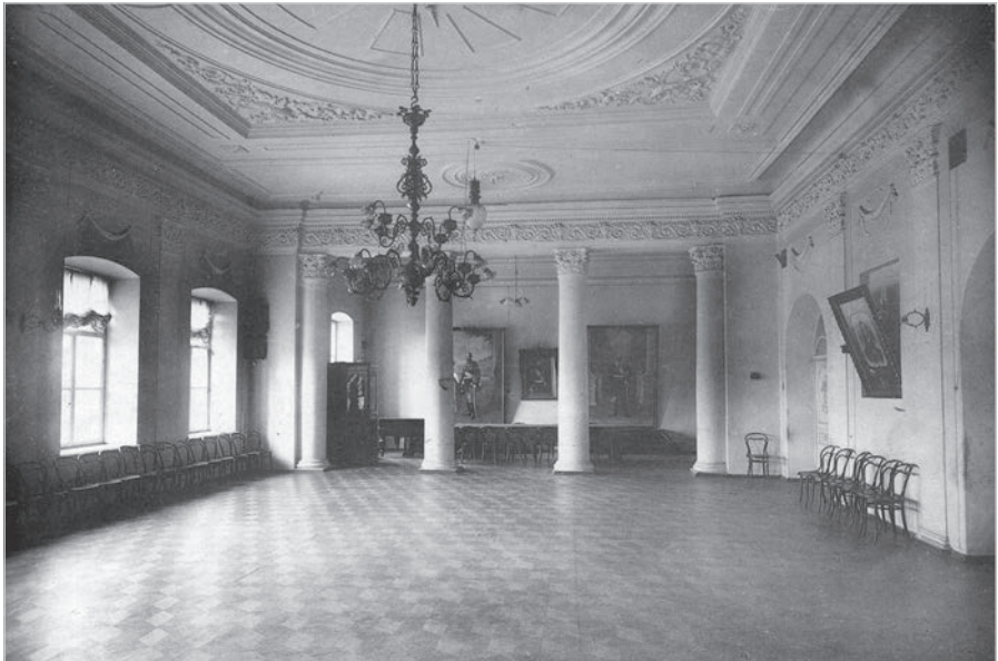
Ил. 9. Вид парадного зала реального училища. Муром, 1880-е гг.