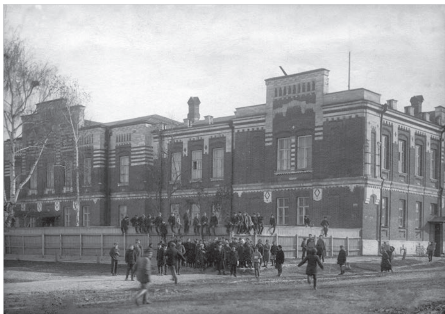
Ил. 4. Неизвестный фотограф. Вид на здание реального училища. Муром. 1915–1917 гг.