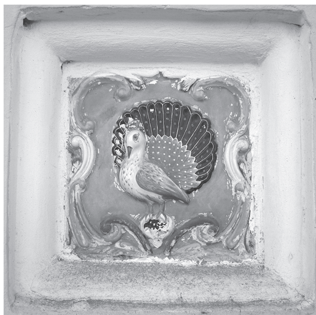
Ил. 3. Рисунок на одной из изразцовых ширинок, который украшал здание земской амбулатории и аптеки, а сегодня — главный корпус Ростовской ЦРБ. 30 апреля 2014 г.