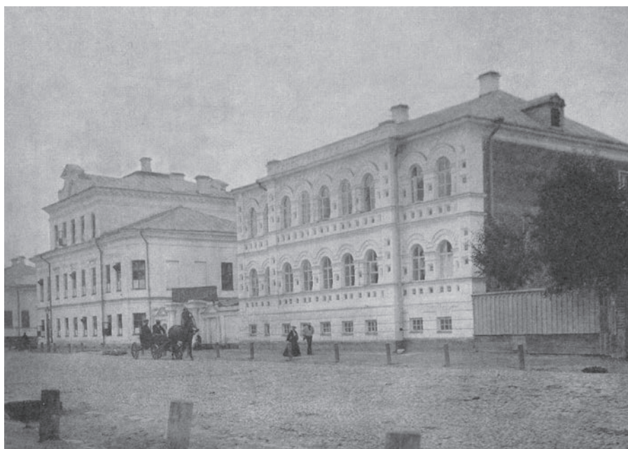
Ил. 2. На переднем плане здание амбулатории и аптеки, вид с юго-востока. Фото нач. XX в. (Крестьянинова Е. И., Никитина Г. А. Граждане Ростова: история ростовского купечества XVII — начала XX века. Генеалогия и судьбы ростовских купеческих родов. Мемуары, дневники, письма. Ростов, 2009. С. 97)