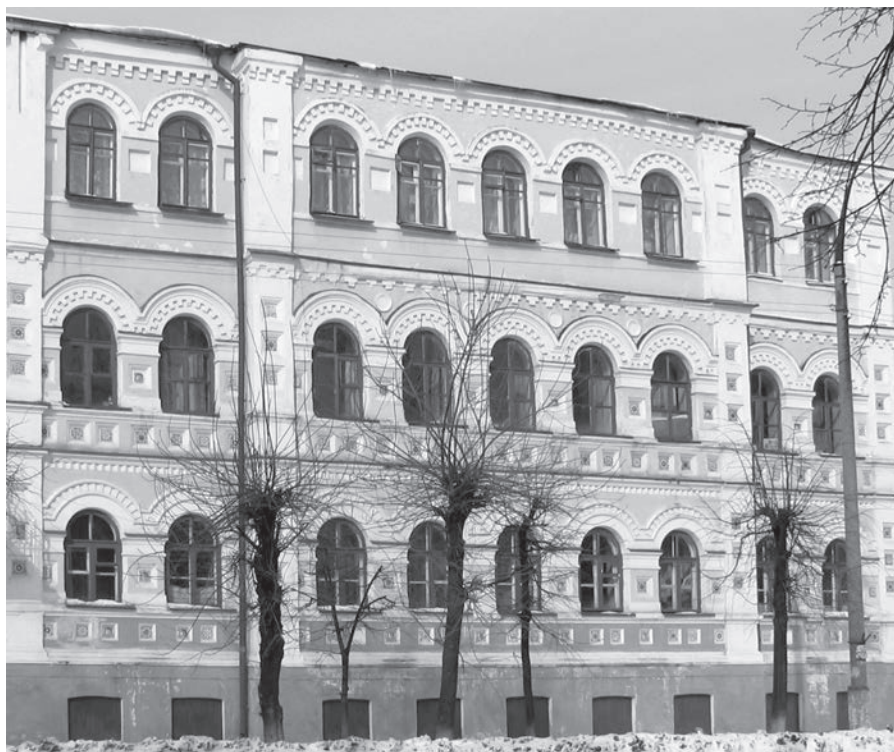
Ил. 3. Здание бывшей земской амбулатории и аптеки, вид с юга. Фото К.А. Степанова, 12 марта 2005 г.