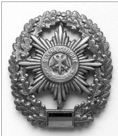
Эмблема фельдъегерской службы ФРГ

в царствование короля Фридриха II. Эта эмблема сохранилась до наших дней, как геральдический символ фельдъегерской службы ФРГ.