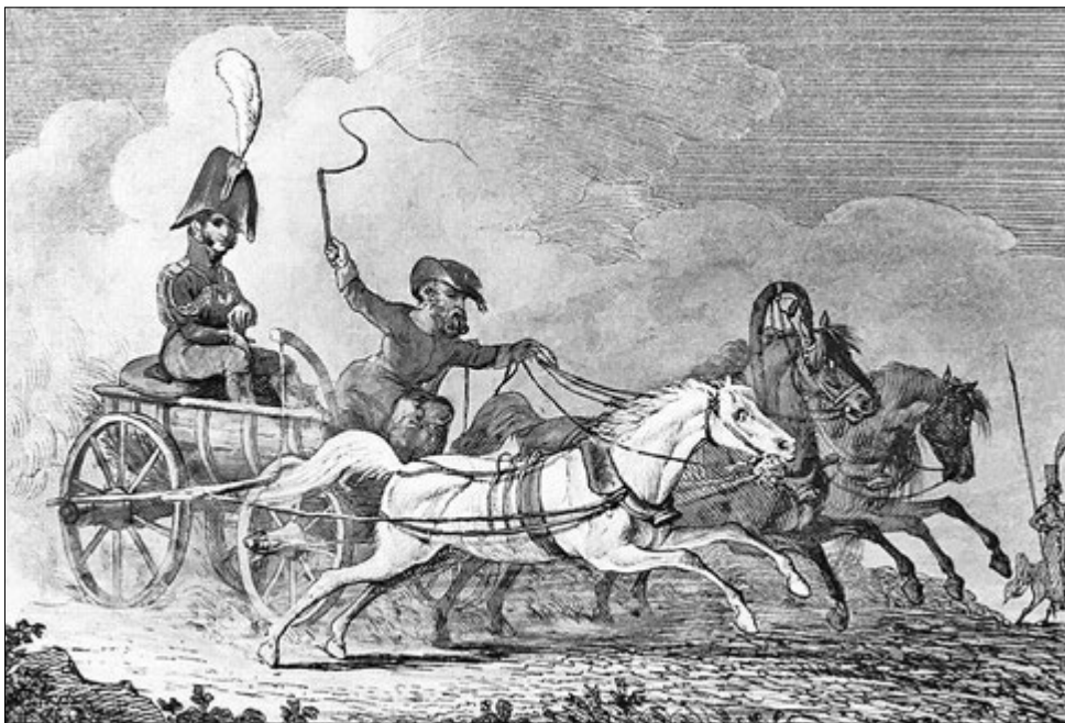
Фельдъегерь времен Александра I. Акварель неизвестного художника

егерская тележка, что объясняется началом царствования императора Александра I — новая тележка еще не разработана.