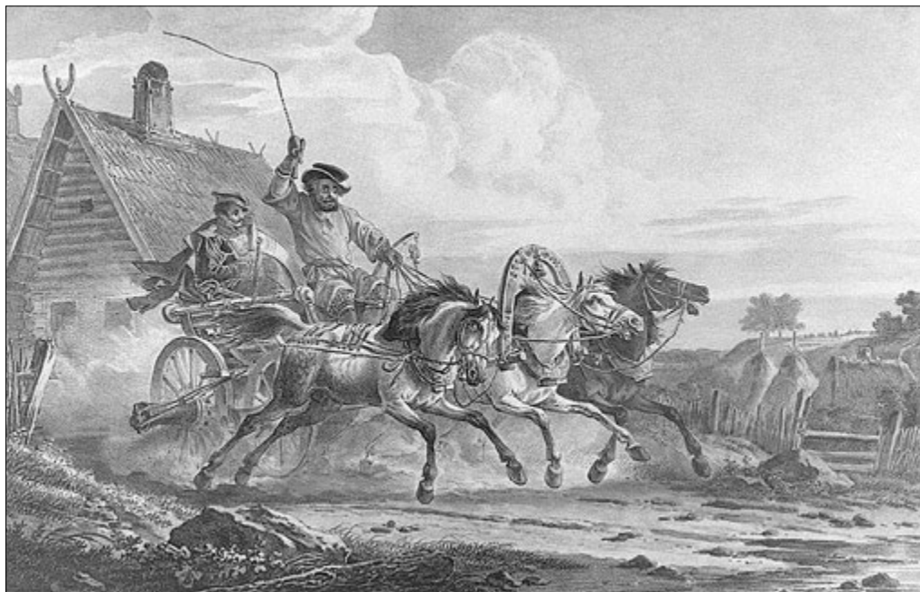
Фельдъегерская тройка на картине А. О. Орловского «Быстрая тройка»

с упряжью, которые имелись на почтовых станциях. Механизм замены троек и возниц на перегонах и порядок оплаты прогонов для фельдъегерей был общим с другими ведомствами, отличаясь лишь в преимущественном праве для увеличения скорости езды. На картине А. О. Орловского изображена специальная фельдъегерская тележка и ямщик со своей традиционной ямщицкой тройкой.