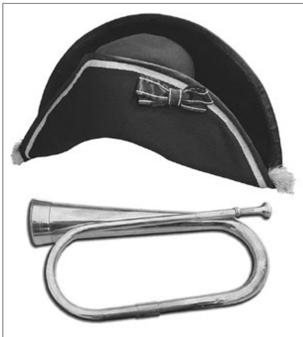
Шляпа офицерская 1796–1801 гг. (реконструкция) и пехотный рожок конца XVIII в.

Можно приветствовать тот факт, что коллекционеры, не имеющие специального образования и опыта научной работы, осуществляют исследования в сфере своих увлечений. Но, к сожалению, рассмотренная в данной публикации попытка такого исследования с претензией на научную новизну в кампаналогии оказалась крайне неудачной. Версия специальных «фельдъегерских» и «военно-курьерских» колокольчиков, заказываемых то ли государственными ведомствами, то ли в порядке частной инициа-