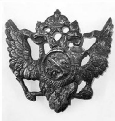
Посеребренный двуглавый орел, полагавшийся курьерам Военного ведомства. Упразднен при Екатерине II