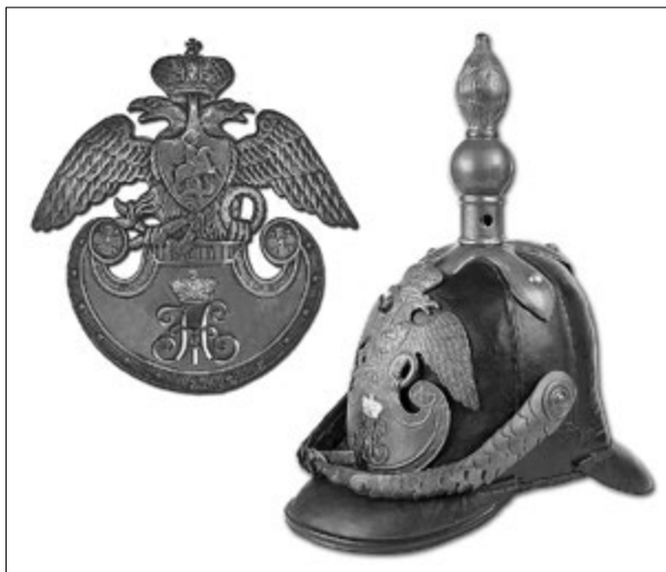
Каска образца 1845 г. и касочный герб чинов Фельдъегерского корпуса

кольчики), с помощью которого они подавали сигналы при приближении к почтовым станциям, городским заставам, императорским резиденциям или поместьям государственных вельмож. Также с помощью сигналов рожка озвучивалось требование встречному транспорту уступить дорогу.