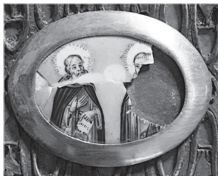
Ил. 9. Г. А. Гвоздарев (?). Преподобные (Иоанн Милостивый?) и Петр царевич (Ордынский). Дробница. Медная пластина, эмаль, живопись по эмали. 3,5×4,6 (овал)