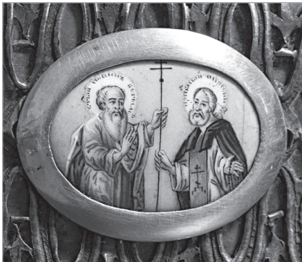
Ил. 12. Г. А. Гвоздарев (?). Св. Иоанн Богослов и прп. Авраамий. Конец XVIII в. Дробница. Медная пластина, эмаль, живопись по эмали. 3,5×4,6 (овал)