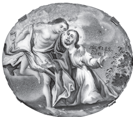
Ил. 14. А. И. Всевяцкий. Моление о чаше. 1790-е гг. Дробница с потира. ГМЗРК. Ф-2295