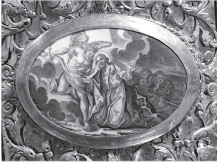
Ил. 3. А. Г. Мощанский. Моление о чаше. 1802 г. Дробница. Медная пластина, эмаль, живопись по эмали. 5,5×7,8 (овал)