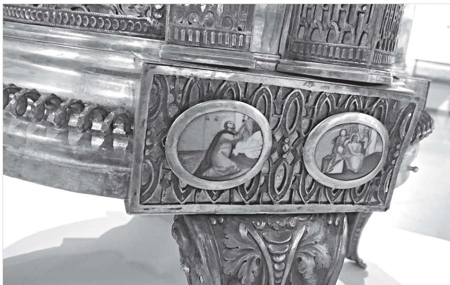
Ил. 8. Неизвестный художник. Моление о чаше. Увенчание терновым венцом. Конец XVIII в. Дробница. Медная пластина, эмаль, живопись по эмали. 3,5×4,6 (овал)