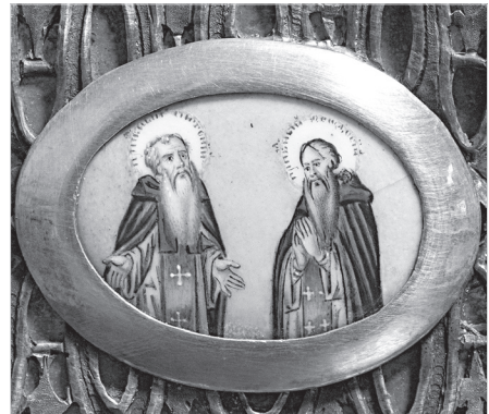
Ил. 13. Г. А. Гвоздарев (?). Прп. Антоний и Феодосий Печерские. Конец XVIII в. Дробница. Медная пластина, эмаль, живопись по эмали. 3,5×4,6 (овал)