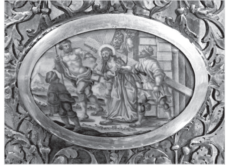
Ил. 4. А. Г. Мощанский. Несение креста. 1802 г. Дробница. Медная пластина, эмаль, живопись по эмали. 5,5×7,8 (овал)