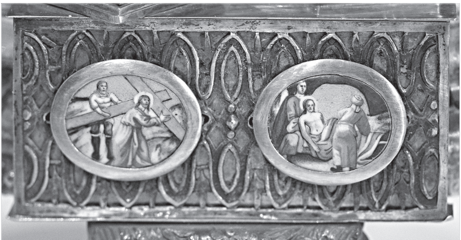
Ил. 7. Неизвестный художник. Несение креста. Положение во гроб. Конец XVIII в. Дробница. Медная пластина, эмаль, живопись по эмали. 3,5×4,6 (овал)