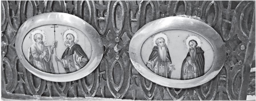
Ил. 11. Г. А. Гвоздарев (?). Св. Иоанн Богослов и прп. Авраамий. Прп. Антоний и Феодосий Печерские. Конец XVIII в. Дробница. Медная пластина, эмаль, живопись по эмали. 3,5×4,6 (овал)