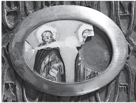
Ил. 10. Г. А. Гвоздарев (?). Преподобные Сергий Радонежский и Ник (он?). Конец XVIII в. Дробница. Медная пластина, эмаль, живопись по эмали. 3,5×4,6 (овал)