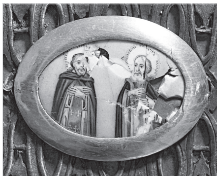
Ил. 8. Неизвестный художник. Моление о чаше. Увенчание терновым венцом. Конец XVIII в. Дробница. Медная пластина, эмаль, живопись по эмали. 3,5×4,6 (овал)