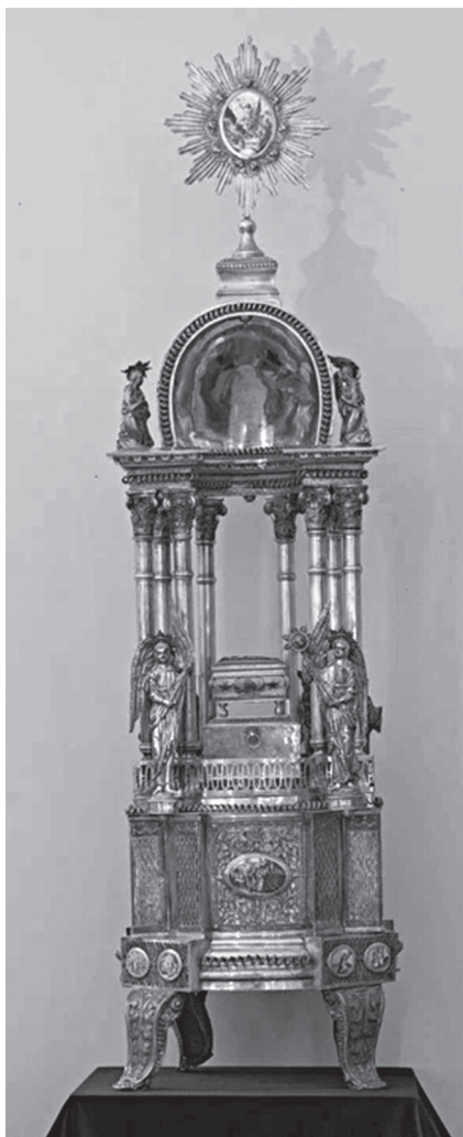
Ил. 1. Дарохранительница. 1802 г. ГМЗРК ДМ-632, ДМ-551