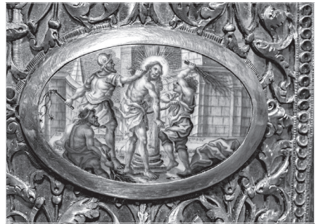
Ил. 6. А. Г. Мощанский. Бичевание Христа. 1802 г. Дробница. Медная пластина, эмаль, живопись по эмали. 5,5×7,8 (овал)