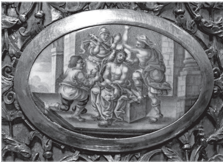
Ил. 5. А. Г. Мощанский. Увенчание терновым венцом. 1802 г. Дробница. Медная пластина, эмаль, живопись по эмали. 5,5×7,8 (овал)