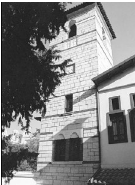
Главная монастырская башня