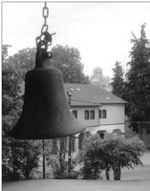
Сигнальный колокол на галерее летнего детского лагеря при монастыре