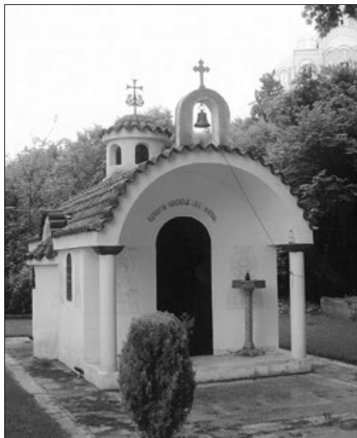
Часовня на погосте