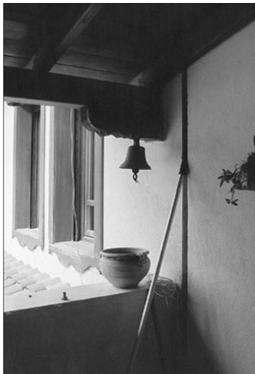
Сигнальный колокол на галерее