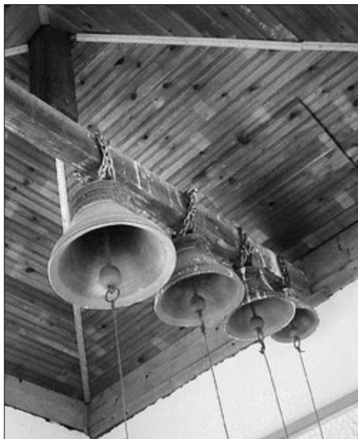
Четыре русских колокола, развешенные под кровлей башни