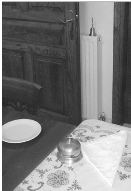
Трапезная. Настольный звонок на столе, на дальнем плане — ручной колокольчик

В 2006 году заложен собор, посвященный святителю-исповеднику Луке Крымскому (Войно-Ясенецкому). Строительство затянулось, но с 2008 года на нижнем полуподвальном этаже действует временный храм.