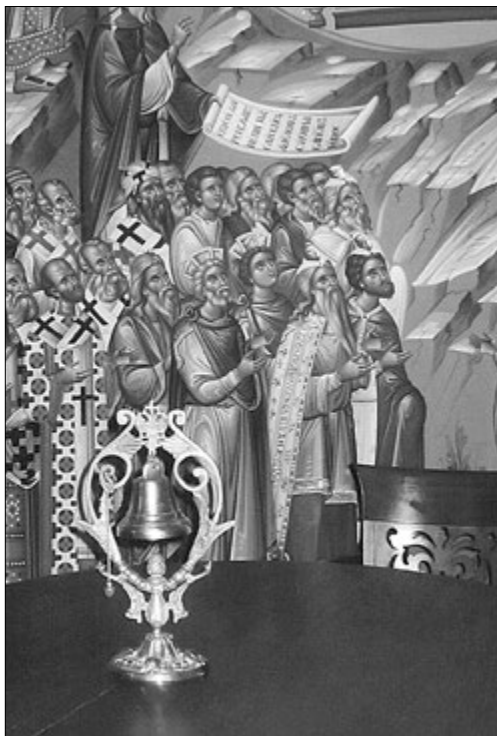
Настольный декоративный колокольчик

На галерее второго этажа этого же здания, выходящей во внутренний дворик, висит небольшой сигнальный колокол , в который бьют, созывая занятых послушаниями на территории монастыря. Следует отметить, что во время моего пребывания в монастыре его ни разу не использовали.