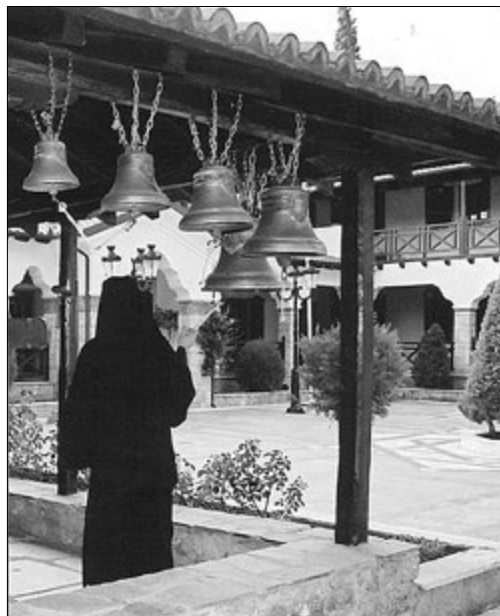
Русские колокола на галерее первого этажа внутреннего дворика перед входом в собор

Самый большой — массой около 100 кг. Общая масса колоколов — около 200 кг. До последнего времени это был основной набор монастыря. Ежедневный звон, начинающийся обычно за 10–15 минут до службы, исполняют о. Давид и о. Серафим: «кто первый к храму подошел — тот и звонит». «У нас нет звонарей — есть послушание» — такая ситуация несколько отличается от отношения к подобным обязанностям звонарей в России. Балансировка языков колоколов организована так, что одному человеку сложно одновременно звонить во все колокола. Попытка специалистов из России улучшить балансировку не была принята греками.