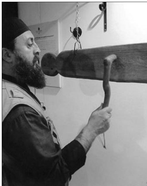
Клепание в древнее било. Частная коллекция. Временная выставка в монастыре